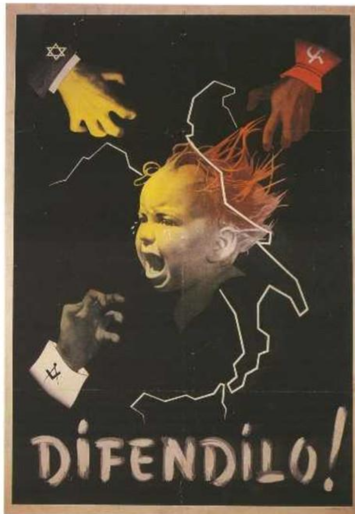
Slika 6. „Difendilo!“, Gino Boccasile

i njihove obitelji, posebice djecu. Također, plakat promovira Mussolinija i Fašizam, čime uzrokuje konflikte između ljudi različitih rasa i socijalnih vrijednosti. 31