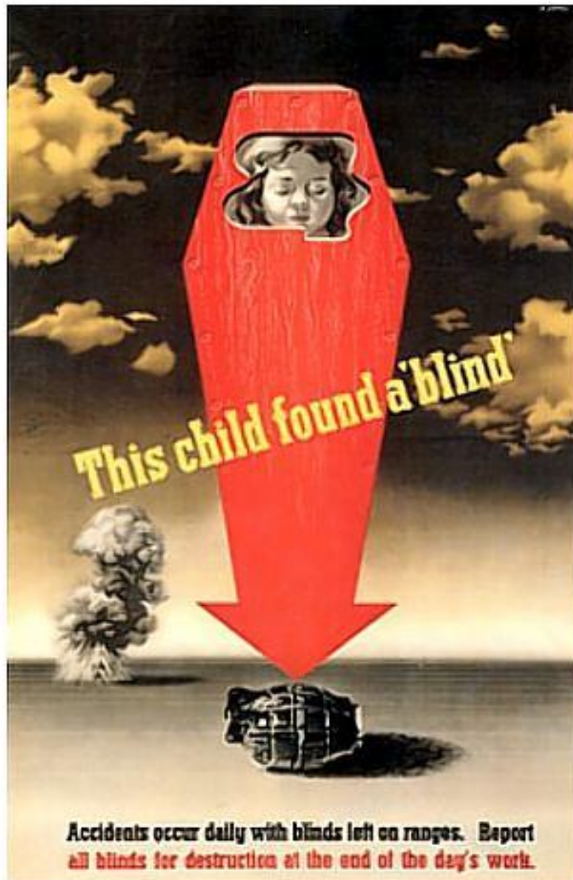
Slika 2. „This child found a blind“, 1943., Abram Games

poprima oblik strijelice koja je usmjerena prema granati. Ovim plakatom Games je htio utjecati na odgovorne (vojnike) i potencijalne žrtve (javnost i djecu). 26