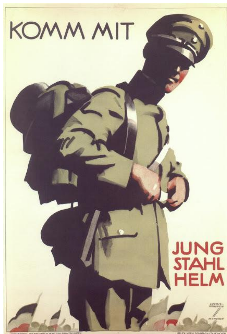
Slika 5. „Komm mit jung Stahlhelm“, Ludwig Hohlwein

U Italiji je djelovao Gino Boccasile kao istaknuti umjetnik plakata čiji radovi su bili sasvim suprotni od onih koje je stvarao Hohlwein. Naime, Boccasile je u svojim plakatima isticao rasizam i antisemitizam, pri čemu je veličao Mussolinija i Fašiste. 30 Jedan od poznatijih plakata pod nazivom „Difendilo“, odnosno brani, prikazuje ruke koje se pružaju prema djetetu. Ruke simboliziraju židovsku religiju i političke vrijednosti, a crna pozadina simbolizira smrt i kaznu. Ruke su smještene na mapi Italije, što predstavlja činjenicu da je dijete na plakatu talijanskog podrijetla. Istovremeno, prijeteće ruke upozoravaju na činjenicu da su Židovi prijetnja talijanskim obiteljima. Svrha ovog plakata bila je uvjeriti Talijane da su Židovi opasni i da će povrijediti njih