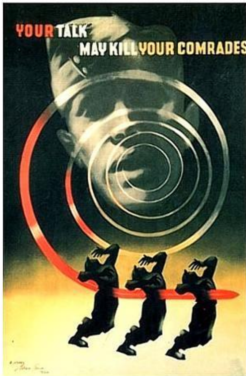
Slika 1. „Talk may kill“, 1942., Abram Games

Još jedan u nizu Gamesovih plakata koji je ostavio snažan utjecaj za vrijeme 2. svjetskog rata je plakat pod nazivom „This child found a blind“ iz 1943. godine. Naime, tijekom rata, djeca su se vrlo često igrala skrivača pa su tijekom igre nerijetko dolazila do mjesta na kojima su vojnici imali obuke za korištenje oružja. Nakon obuke, vojnici su često ostavljali bombe za sobom pa su upravo zbog toga mnoga djeca stradala igrajući se. Plakat prikazuje djevojčicu u crvenom lijesu koji