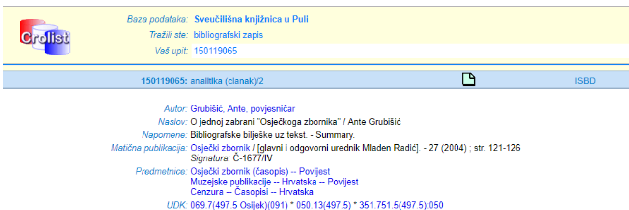
Slika 4: Primjer iz online kataloga Sveučilišne knjižnice u Puli

Ovaj je primjer također pronađen u trima online katalogima visokoškolskih knjižnica koji su redom online katalog Sveučilišne knjižnice u Puli, online katalog Knjižnice Filozofskog fakulteta u Osijeku te online katalog Nacionalne i Sveučilišne knjižnice u Zagrebu. A ovako izgledaju zapisi online: