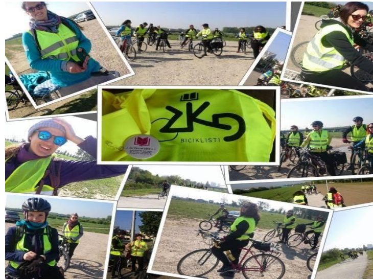
Slika 2. ZKD Biciklisti

projekt s vremenom uspješno proširuje na cijelu Hrvatsku pod nazivom Biciklom kroz knjižnice Hrvatske . 82 Prva biciklijada u sklopu ovog programa, organizirana je 2018. na ruti od Zagreba do Karlovca. 83 ZKD Biciklisti pokušavaju skrenuti pozornost na svoj rad tako što sudjeluju na različitim manifestacijama poput Noći knjige, Dana planeta Zemlja, Zeleni festival – Okrenimo na zeleno, Europski tjedan mobilnosti, Festival znanosti, „Let’s Go Green!“ – 1. međunarodna konferencija o zelenim knjižnicama, itd. 84