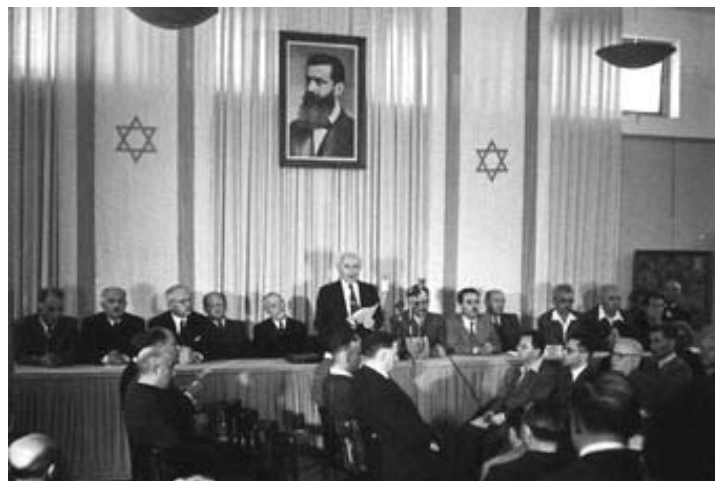
Prilog 3.- Ben Gurion proglašava nastanak države Izrael