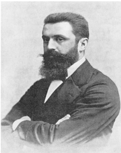
Prilog 1.- Theodor Herzl, začetnik političkog pokreta cionizma

zemljišta, a korumpirana osmanska vlast je žmirila na kršenje zabrana o useljavanju Židova i ograničenja prodaje zemljišta. 18 U prvim desetljećima 20. stoljeća među Židovima dolazi do drugog naseljeničkog vala u Palestinu. U razdoblju 1904.-1914.g. u Palestinu je uselilo između 35 000 i 40 000 Židova, ponovno najviše s prostora Ruskog Carstva. Iseljavanje tamošnjih Židova nisu potaknuli samo progoni, već ratne i revolucionarne okolnosti u kojima se Carstvo našlo: 1904.-1905.g. traje rusko-japanski rat, 1905.g. dolazi do prve ruske revolucije, a 1914.g. Rusija ulazi u Prvi svjetski rat. 19