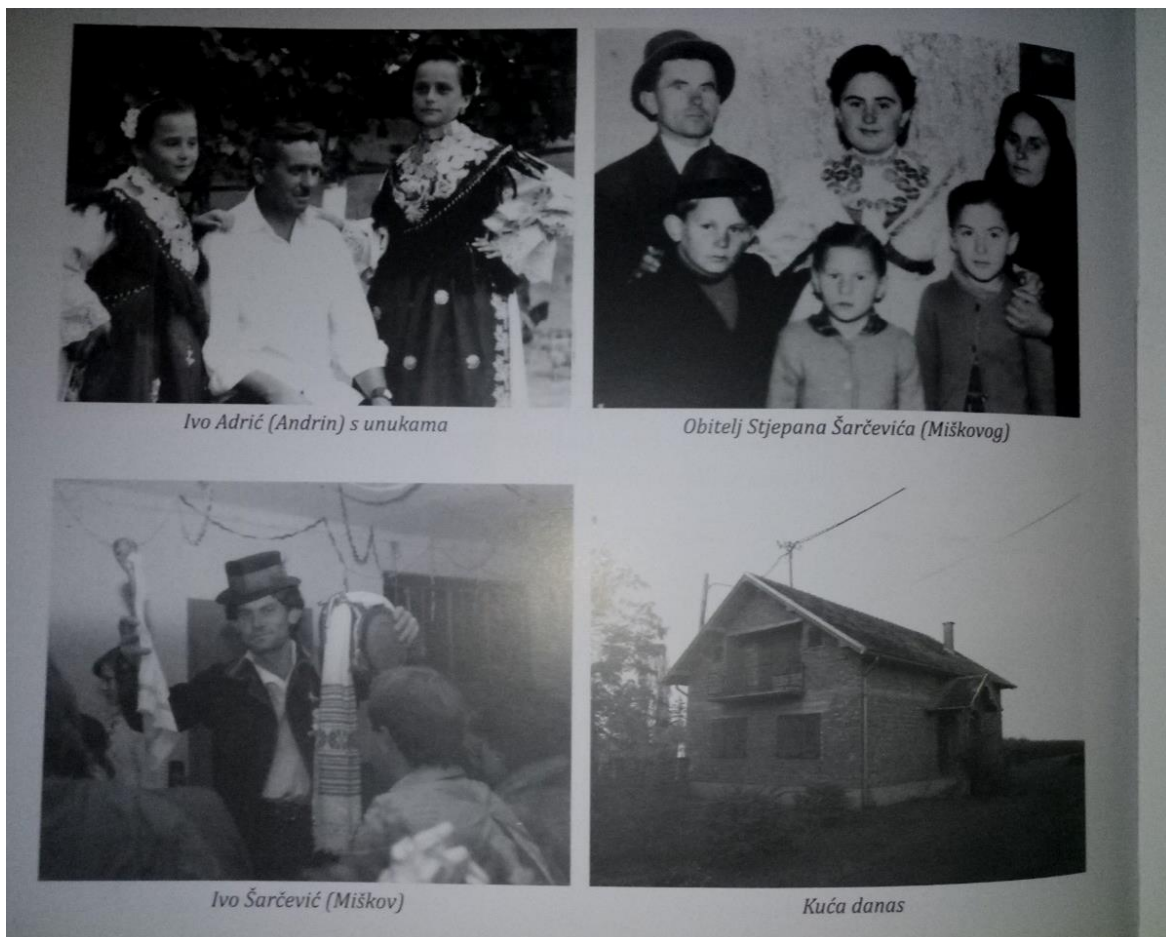
Prilog 1 - Obiteljski nadimci u Novim Perkovicima (izvor: Šarčević, Zdenko. Novi Perkovci . Matica hrvatska - Ogranak Đakovo, 2016., 138.)

Kad je riječ o prezimenima, osobitost je toga govora i tvorba tzv. „obiteljskih nadimaka“. Naime, budući da se svo stanovništvo toga naselja može svesti na gotovo 3-4 prezimena, pojavila se potreba za razlikovanjem. Problematika je razriješena uvođenjem upravo tih „obiteljskih nadimaka“ koji su se tvorili prema imenu ili nadimku nekoga od muških predaka. Tako su postojali: Perini, Grgini, Đurini i slično. Primjerice, Zdenko Šarčević u svojoj monografiji o Novim Perkovicima uz svoje ime navodi i Miškov , a isto čini i pri navođenju drugih osoba kao što je prikazano.