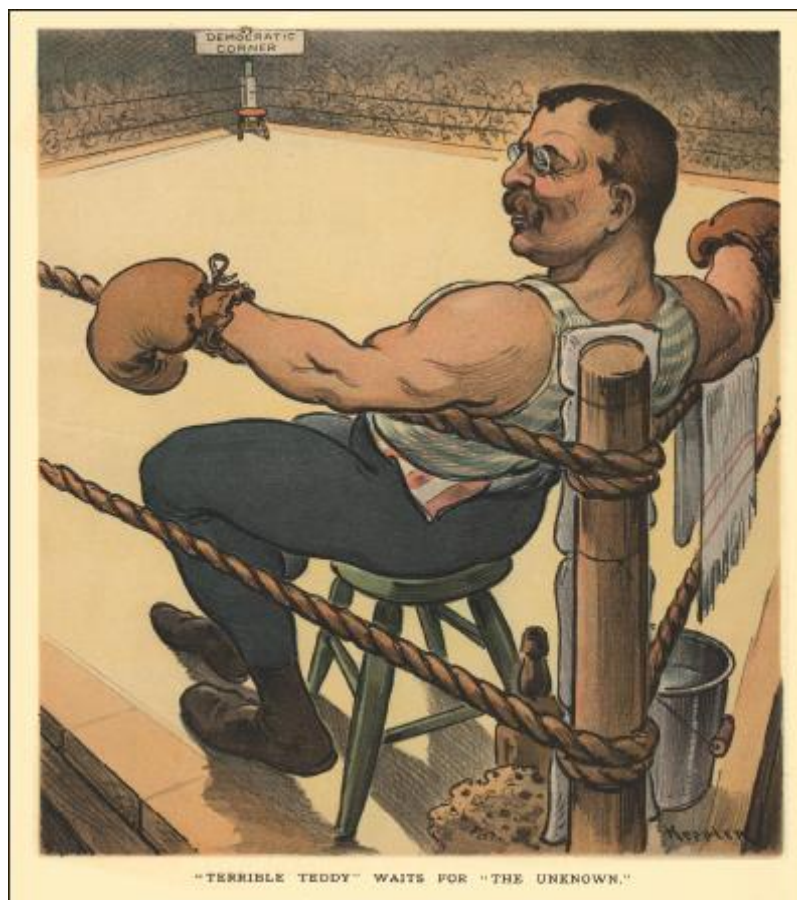
Prilog 3. „Strašni Teddy“ čeka „nepoznatog“. Karikatura iz časopisa Puck prikazuje praznu stolicu u „demokratskom kutu“ nasuprot Rooseveltu

platformi, te je odustala od propale politike slobodnog srebra s obzirom da je sam Parker bio zagovornik zlatnog standarda. 74 Njegovi napadi su bili usmjereni i protiv Rooseveltova voditelja kampanje Georgea Courtelyoua, koji je bio povezan sa korporativnim svijetom. Izbori su došli i Roosevelt je očekivano slavio, pokupivši sve države izvan neosvojivog Juga čiji demokratski zid je ipak uspio malo narušiti, osvojivši državu Missouri. Time je pokupio čak 33 od 45 država koje su sudjelovale u izborima. 75 Nakon pobjede, svojoj ženi je pojasnio kako „više nisam politička slučajnost.“ Imao je i razloga za takav zaključak – bio je prvi slučajni predsjednik koji je potvrdio svoj mandat. 76 Rooseveltov drugi mandat mogao je započeti.