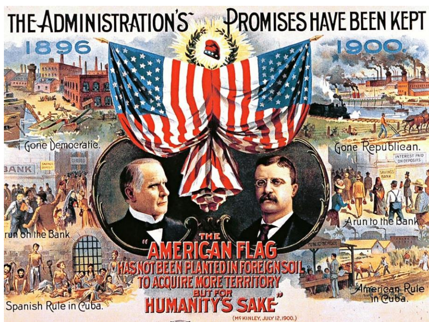
Prilog 1. Poster republikanske predsjedničke kampanje iz 1900.

„naučiti“. Rezultati komisije samo su produžile rat koji je crpio američke resurse i živote. Zbog toga je McKinley smatrao kako njegov posao na Filipinima nije bio gotov te je ubrzo uspostavio drugu komisiju koja je trebala služiti kao vladina organizacija zadužena za uspostavljanje tranzicijske vlasti na Filipinima koja je polagano trebala mijenjati vojnu vladu za građansku vlast. 30 Ovaj put na čelu komisije bio je William Howard Taft, sudac pri šestom okružnom sudu i sin uglednog odvjetnika i političara. 31 Nakon nekoliko mjeseci rada, komisija je izvjestila McKinleya kako kretanja na otocima idu u pozitivnom smjeru. Rat se većinom pretvorio u gerilsku borbu, ali je bilo jasno kako je problem daleko od rješene, te će zbog toga imperijalizam ostati u fokusu izborne kampanje 1900. 32