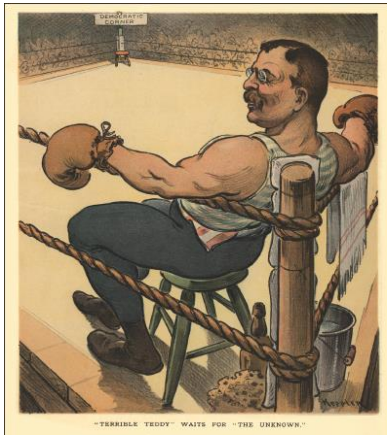
Prilog 3. „Strašni Teddy“ čeka „nepoznatog“. Karikatura iz časopisa Puck prikazuje praznu stolicu u „demokratskom kutu“ nasuprot Rooseveltu

platformi, te je odustala od propale politike slobodnog srebra s obzirom da je sam Parker bio zagovornik zlatnog standarda. 74 Njegovi napadi su bili usmjereni i protiv Rooseveltova voditelja kampanje Georgea Courtelyoua, koji je bio povezan sa korporativnim svijetom. Izbori su došli i Roosevelt je očekivano slavio, pokupivši sve države izvan neosvojivog Juga čiji demokratski zid je ipak uspio malo narušiti, osvojivši državu Missouri. Time je pokupio čak 33 od 45 država koje su sudjelovale u izborima. 75 Nakon pobjede, svojoj ženi je pojasnio kako „više nisam politička slučajnost.“ Imao je i razloga za takav zaključak – bio je prvi slučajni predsjednik koji je potvrdio svoj mandat. 76 Rooseveltov drugi mandat mogao je započeti.