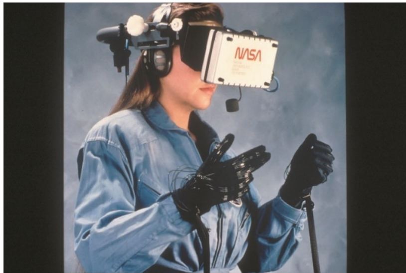
Slika 1. NASA-in VR set, The VIEW 25

virtualne stvarnosti primjenjuju se razne svrhe, zaista olakšavajući praktičan život u fizičkoj stvarnosti.