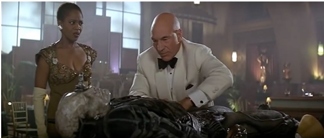
Slika 6. Picard u Holodeku 130

opasnu zonu sukoba koja može za nekoga značiti konačni kraj umjesto krajnje zabave. Imitirajući svog najdražeg lika iz djetinjstva, Dixona Hilla, 129 Picard ostvaruje svoje dječjačke maštarije, no ponekad se to učini opasnim kad se sigurnosne komande isključe, a virtualni metak postaje opipljiva stvarnost. Prema trenutnim mogućnostima tehnologije virtualne stvarnosti, fizičke ozljede od virtualnog metka nisu moguće, ali su zato vrlo izgledne 'ozljede' poput emocionalne boli, osjećaja povrijeđenosti, uznemirenosti, PTSP-a, i sl. koje proizlaze iz naše psihološko-emocionalne povezanosti s avатарom.