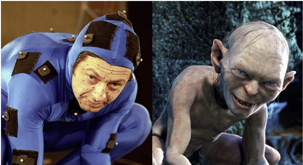
Prilog 5. Andy Serkis kao Gollum 98

Kao što je već rečeno, virtualna stvarnost daleko je od savršenog imaginarijuma u kojem bi svaki korisnik mogao isprogramirati savršenog sebe i svoje idealno okruženje; ušetati se u novi svijet, proživjeti nestalo, prošlo ili moguće. No to ne znači da se tehnologija virtualne stvarnosti polako ne razvija u tom smjeru. Od spomenutih Zimmermanovih DataGlove i PowerGlove do odijela koje je stvorio zajedno s Lanierom i koje je u svojem krajnjem obliku omogućilo CGI formaciju Golluma, tehnologija virtualizacija iznimno napreduje.