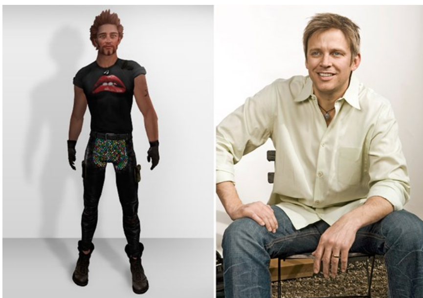
Slika 4. Phillip Rosedale i njegov avatar 97

Nadalje, zanimljivo je i pitanje artificijalizma, odnosno pitanje stvaranja svijeta i inteligentnog dizajna koji je sastavni dio svake religije. Ovdje se stvarno to i događa – virtualni svijet je zaista umjetno stvoreni svijet. No ovaj put svijet ne stvara potpuno realizirano i ostvareno Biće vrhunske mudrosti i znanja koje samilosno i suosjećajno skrbi o stvorenom. Primjerice, već spomenuti svijet Second Life -a stvorila je korporacija Linden Lab , odnosno Linden Research Inc. , u vlasništvu Phillipu Rosedalea 94 . Ako bismo, poput Campbella, 95 povukli paralelu, mogli bismo tvrditi da je Rosedale kao dizajner svijeta Second Life -a nešto poput vrhunskog Stvaratelja koji vodi svoje stado u svijet novih obećanja. Rosedale, kao i drugi njemu slični, postaju tehno-božanstva koja nam obećavaju duhovno ispunjenje i oslobođenje u svijetu novih mitova i novog panteona. „ Mit otvara vrata svijetu dimenziji misterije i realizaciji misterije koja je u temelju svega stvorenog. Ako to izgubimo, gubimo i mitologiju. Ako se misterija manifestira kroz sve stvari, sav svemir postaje, takoreći, sveta slika. Uvijek se obraćamo transcendentalnoj misteriji kroz uvjete svog stvarnog fizičkog svijeta. [...] Ta je sociološka funkcija mita preuzela naš svijet – no i ona je zastarjela. “ 96