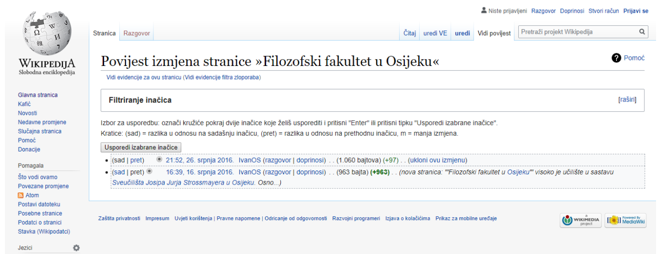
Slika 1. Pregled povijesti izmjena odabrane teme na Wikipediji 13

Većina popularnijih članaka na Wikipediji ima sljedeće složenu povijest promjena i revizija mnogih urednika koji su u većini slučajeva dostupni na vrhu stranice članka u Wikipediji (npr. "Povijest" i "rasprava"). Nadalje, na taj način se doći do podataka o korisnicima (na stranicama "korisnika"). Povijest članka je dostupno standardnim wiki sučeljima, dok je za dobivanje istih potrebno mnogo koraka koji omogućuju opći smisao povijesti članka i urednika. Korisničke procjene vjerodostojnosti mogu se poboljšati boljom podrškom za postizanje smisla za uređivanje i članak povijesti, a uključuju WikiScanner, WikiRage i History Flow sustave.