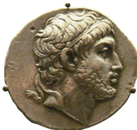
Prilog 2: Prikaz Filipa V. na kovanici

gradove i utvrde koje su bile opljačkane. Pleurat II. je umro i naslijedio ga je sin Gencije nekog neodređenog datuma između 189. i 181. godine prije Krista. 68