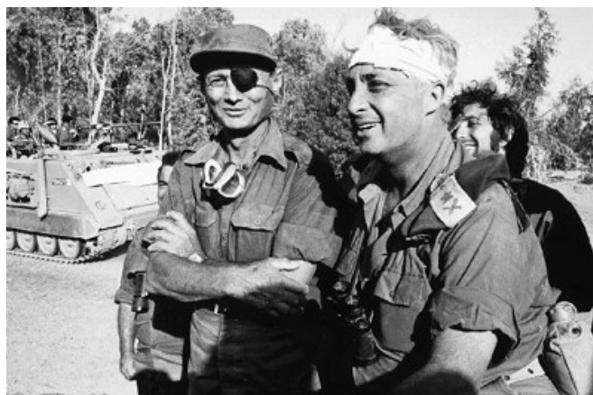
Prilog 3. Moshe Dayan i Ariel Sharon na zapadnoj obali Sueskog kanala.