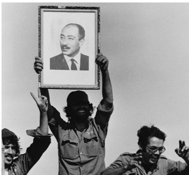
Prilog 1. Egipatski vojnici sa slikom predsjednika Sadata.