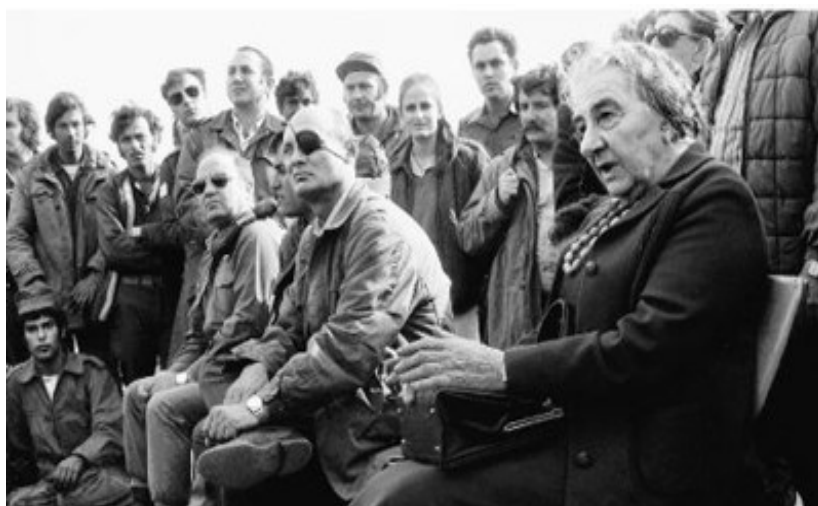
Prilog 2. Sastanak premijerke Golde Meir i ministra obrane Moshea Dayana sa vojnicima nakon prekida vatre.