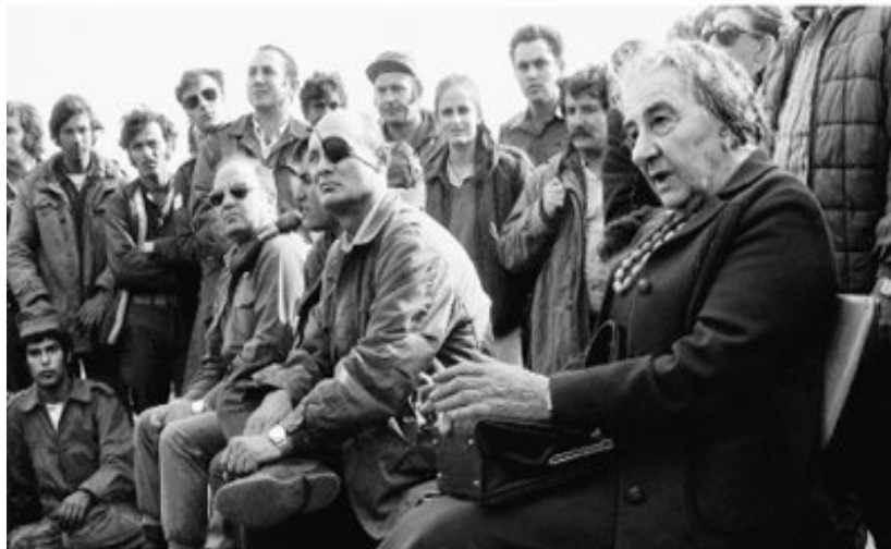
Prilog 2. Sastanak premijerke Golde Meir i ministra obrane Moshea Dayana sa vojnicima nakon prekida vatre.