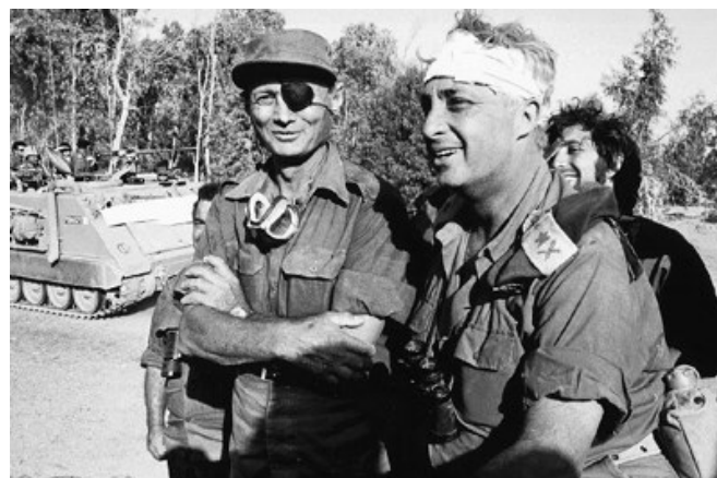
Prilog 3. Moshe Dayan i Ariel Sharon na zapadnoj obali Sueskog kanala.