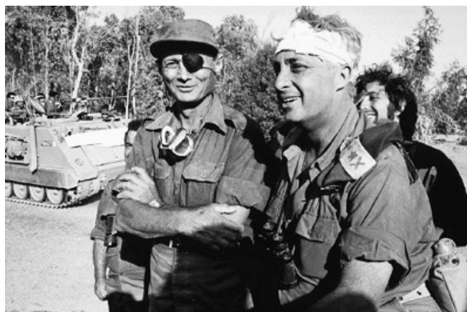
Prilog 3. Moshe Dayan i Ariel Sharon na zapadnoj obali Sueskog kanala.