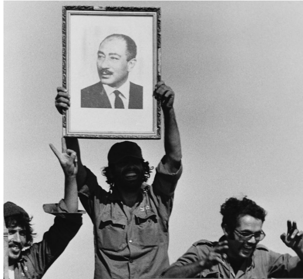
Prilog 1. Egipatski vojnici sa slikom predsjednika Sadata.