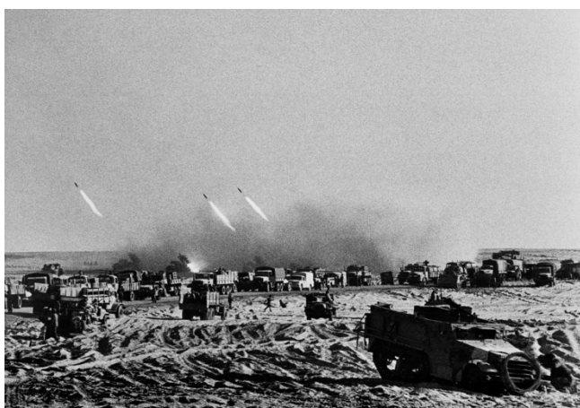
Prilog 4. Izraelska vojska na putu do Sueskog kanala.