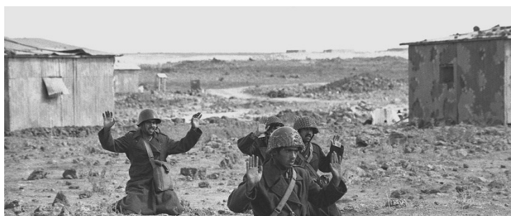
Prilog 5. Predaja sirijskih vojnika na Golanskoj visoravni 10. listopada.