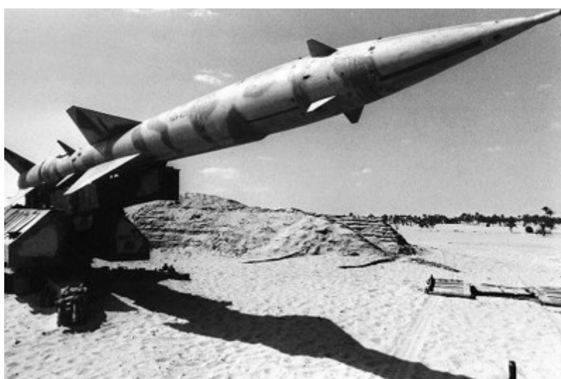
Prilog 6. SAM protuzračni sustav.