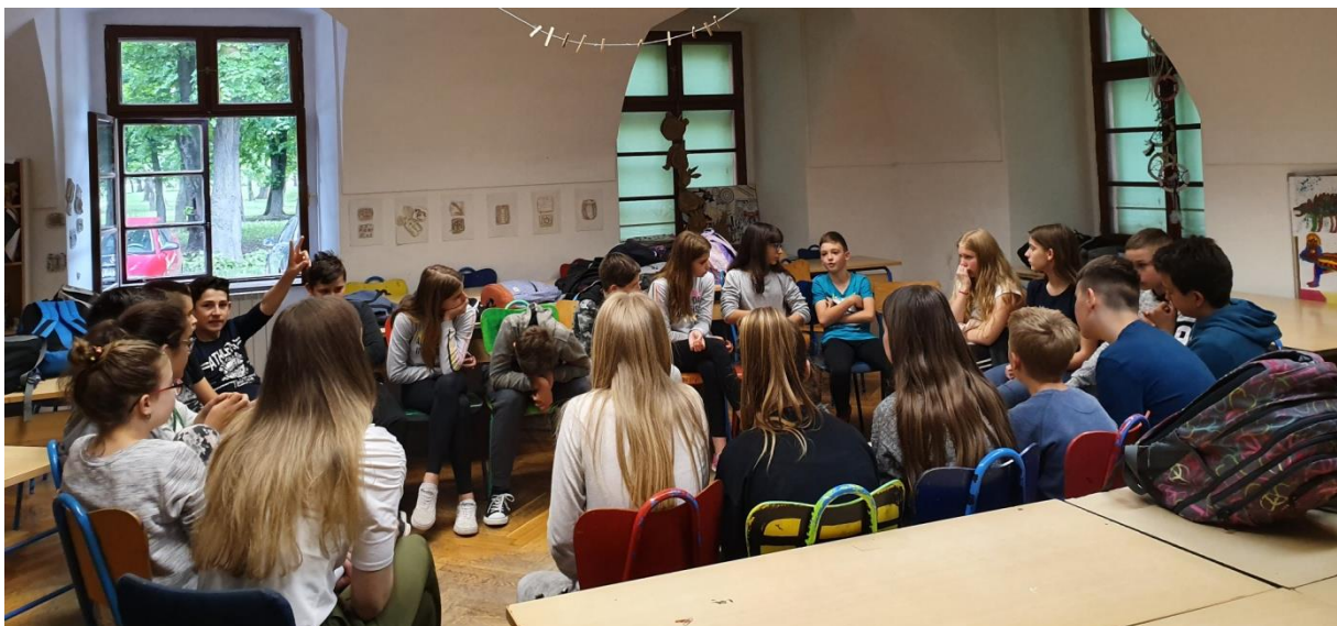
Slika 15. Razgovor s učenicima u krugu