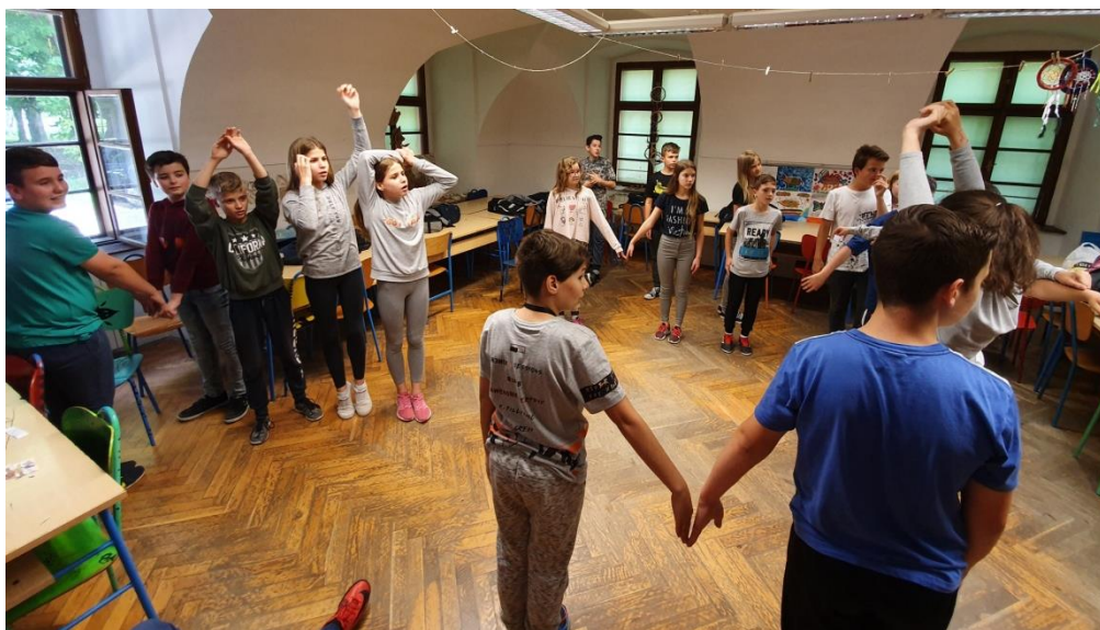
Slika 34. Formiranje slova u timu

Što se tiče same aktivnosti, učenici su kreativno prikazivali slova stoga sam im u jednom trenu svima dala “plusić,, kako bih nagradila kreativno ponašanje.