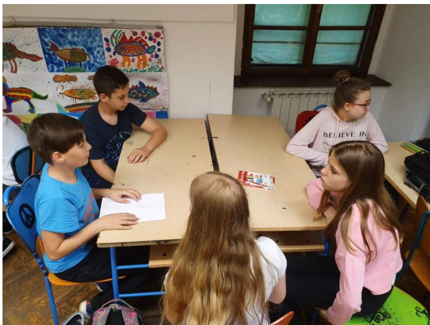
Slika 24. Učenci sudjeluju u grupama te izrađuju kreativne stripove o empatiji