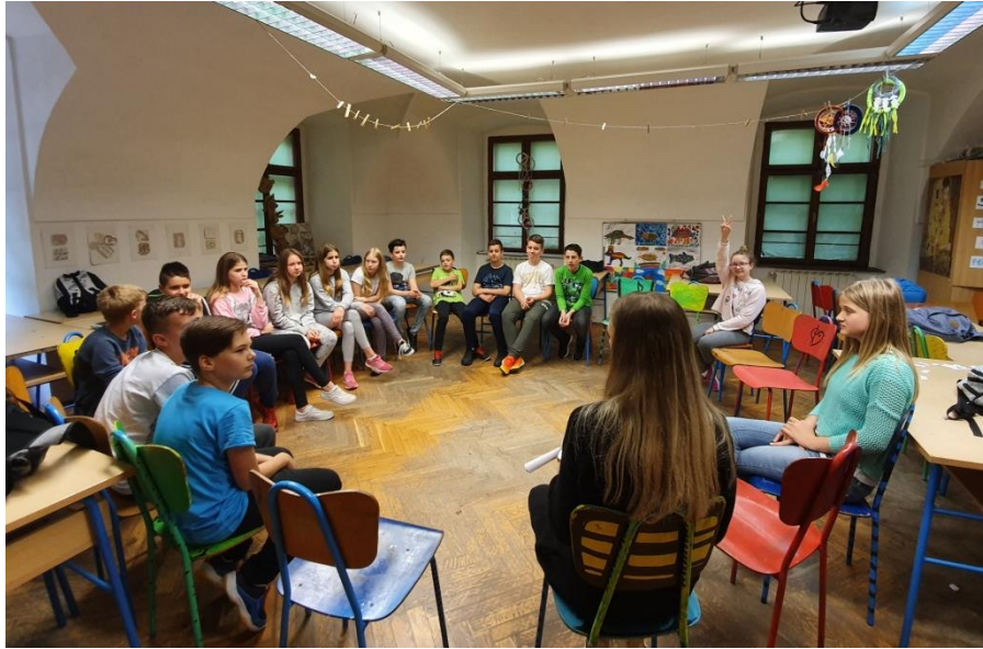
Slika 23. Učenci razgovaraju o empatiji s voditeljicom

Četvrta aktivnost (“Kreativnost i empatija,”) zahtijevala je podjelu u grupe. Učenci su imali za zadatak predstaviti empatiju i njezine značajke kroz strip, priču ili pjesmu. Svaka grupa odlučila se za jedno od navedenog. Na početku im je bilo teško započeti i smisliti priču, no sve su grupe uspjele napraviti zadatak.