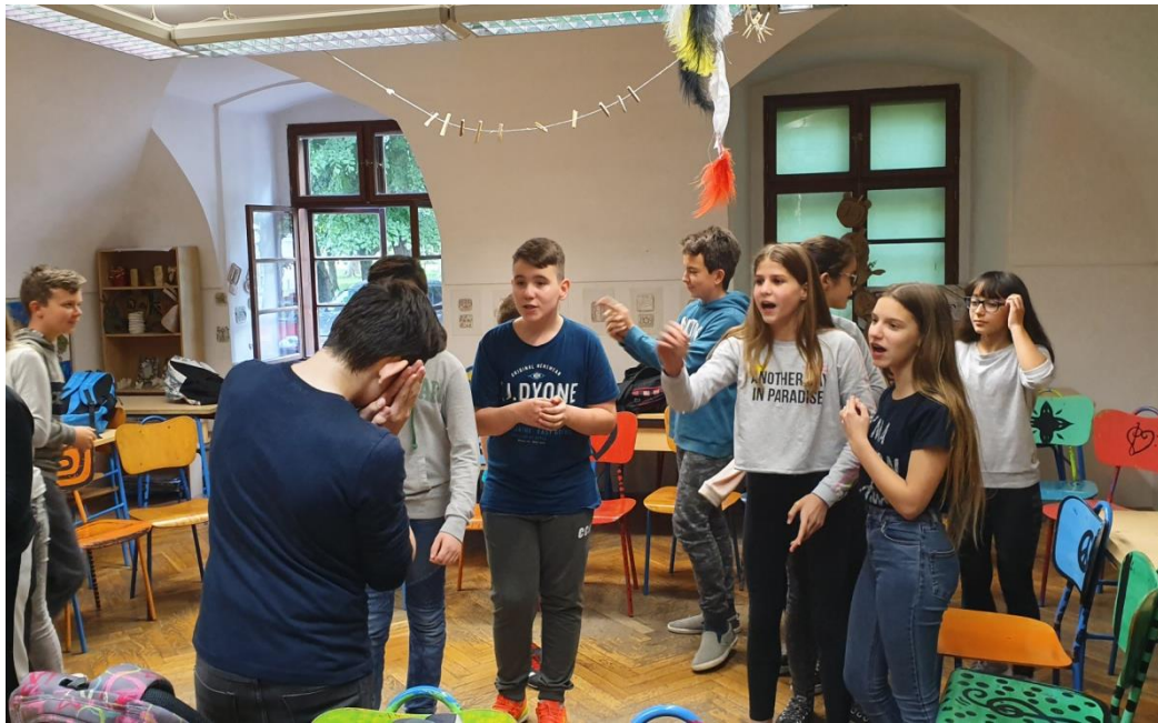
Slika 13. Učenci pogađaju pojmove u timovima