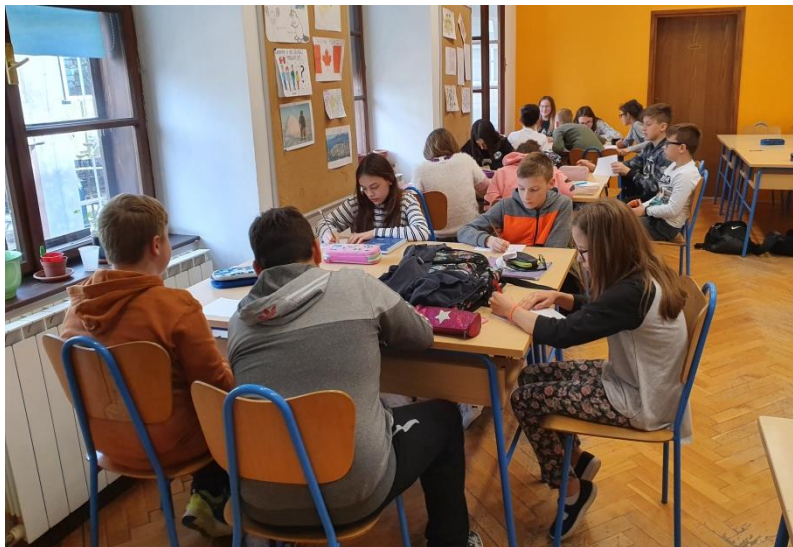
Slika 1. Grupna aktivnost “Pogled u budućnost,,”

U sljedećoj aktivnosti (“Pogled u budućnost,”) učenici su se podijelili u 4 grupe po 5 učenika prebrojavanjem. Trebali su, svatko za sebe, napisati cilj koji žele ostvariti u sljedećih mjesec dana. Kako bih im pomogla, navela sam im kao primjer kako je moj cilj završiti fakultet. Nakon svakog zadatka, učenici su morali zamijeniti papir u krug. Nakon pisanja cilja, pisali su prepreke koje se mogu naći na putu do cilja, ali i rješenja spomenutih prepreka. Za kraj grupne aktivnosti, učenici su trebali napisati pozitivnu poruku kako bi ohrabрили osobu čiji je cilj da to zbilja i ostvari. Ta je aktivnost učenicima bila neobična. Nerijetko su pisali vrlo neozbiljne stvari kako bi nasmijali ostatak grupe. Svatko je pojedinačno čitao ostatku grupe što piše ispod njegovog cilja, a zatim je svaka grupa izabrala najzanimljiviji primjer i pročitala ga ostatku razrednog odjela.