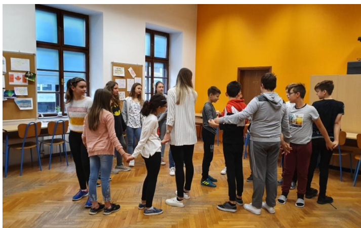
Slika 26. Otpetljavanje čvora s 5. razredom

Prva aktivnost (“Čvor,,) bila je aktivnost otpetljavanja čvora. Svi smo stali jedni kraj drugih, zažmirili te se uhvatili za ruke. Tako smo dobili čvor koji smo trebali otpetljati. Objašnjavanje pravila aktivnosti zahtijevalo je određeno vrijeme. Dok su učenici žmirili, ja sam ih ispravila te spojila dlanove na pravilan način. Kada smo se krenuli otpetljivati, dobili smo dva kruga. Učenike sam na kraju aktivnosti pitala je li im bilo zanimljivo na što su oni potvrdno odgovorili.