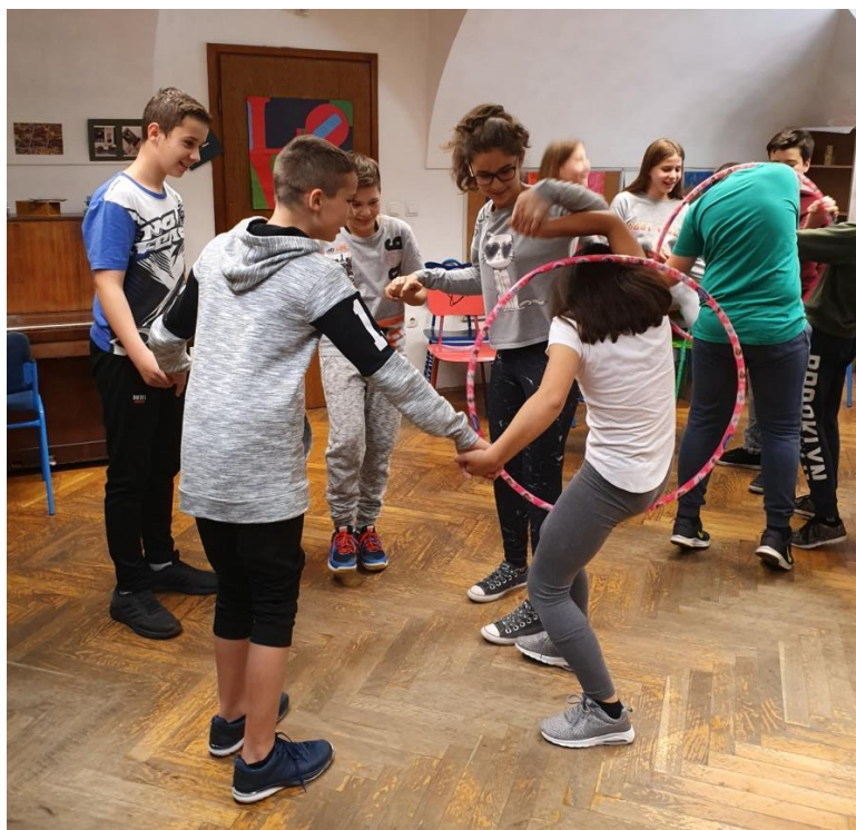
Slika 33. Provlačenje kroz hula-hoop u timovima

Treća aktivnost ("Hula-hoop,,) bila je aktivnost provlačenja kroz hula-hoop. Učenicima sam detaljno objasnila pravila, a zatim podijelila obruče. Svi osim jednog tima su lijepo surađivali. U navedenom timu je bila učenica koju drugi odbacuju. Kada sam im rekla da se uhvate za ruke oni to nisu htjeli napraviti jer ju nitko nije htio uhvatiti za ruku. Iako sam njihovoj grupi posebno objasnila pravila oni ih i dalje nisu poštovali. Unatoč tome, ostali timovi su lijepo surađivali, a jedan je tim nakon osvojenog boda proslavio tako što su si svi dali peticu. Učenike sam pitala žele li ponoviti aktivnost na što su mi vrlo jasno odgovorili da ne žele.