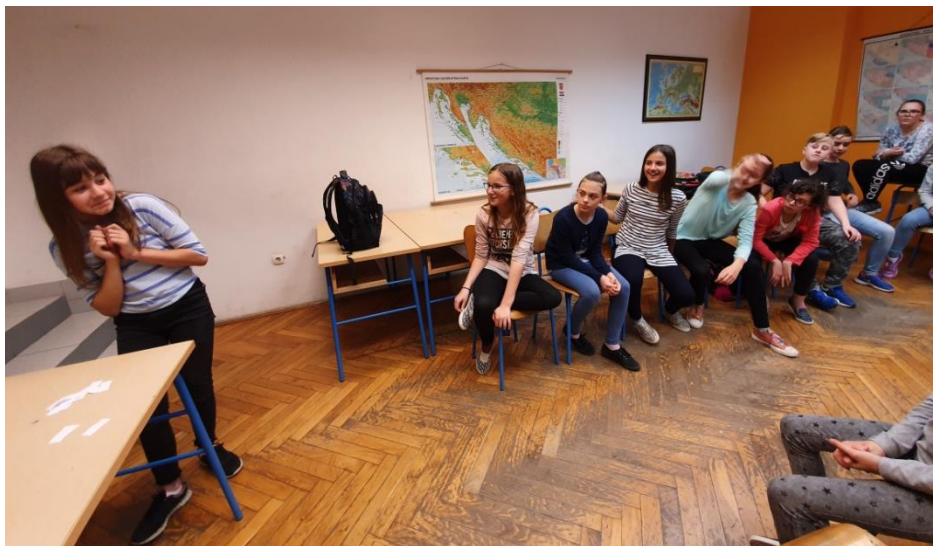
Slika 17. Učenici pogađaju emocije

Za prvu aktivnost ("Pogodi emociju,") učenici su sjedili u obliku slova U, a na stolu ispred njih stajale su kartice s pojmovima, točnije, različitim emocijama (ljutnja, sreća, iznenađenost, tuga, zaljubljenost, nervoza, gađenje, sram, strah, zbunjenost, krivnja, dosada, zabrinutost, ljubomora). Objasnila sam im kako emocije s kartica moraju objasniti samo licem, bez riječi. Svi učenici su se javljali tijekom aktivnosti i pogađali pojmove. Neki pojmovi bili su teži za objasniti, no onda su ih objasnili riječima. Neki učenici nisu znali kako bi objasnili pojam, no onda su odabrali prijatelja koji će umjesto njih objasniti pojam.