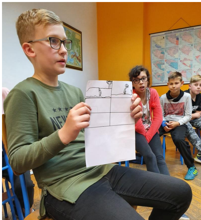
Slika 20. Učenik pokazuje rad svoje grupe

Posljednja grupa ispričala je priču o učenici koja je plakala prije početka sata. Grupa je veoma pažljivo ispričala problem koji se dogodio. Smatram da su učenici dobro riješili problem koristeći strip te da se učenica nije osjećala uvrijeđenom. Nakon njihovog izlaganja započeli smo razgovor o problemu. Učenica je objasnila kako ona nije bila tužna zbog situacije u školi već zbog obiteljskih problema kojih ima. Nažalost, istaknula je kako se nema kome obratiti u razredu kako bi popričala o svojim problemima jer većinom svatko ode na svoju stranu pod odmorom, a na nju zaborave. Neki učenici su istaknuli kako ona njima ne želi reći što ju pati stoga sam im objasnila da, kada je riječ o težim i ozbiljnijim stvarima poput obiteljskih problema, ne smijemo nikoga siliti da nam kaže nešto što ne želi. Objasnila sam im kako svi imaju pravo na svoju privatnost i kako nije svrha da osoba odmah izloži svoje probleme već da joj se ponudi pomoć u bilo kojem obliku. Učenici su izložili nekoliko strana priče. Navedena učenica u nekim trenucima zna biti gruba prema drugima te ih tuži nastavnicima. Velik problem je taj što ona uvijek mora biti ta koja će započeti razgovor i pitati nekoga za igru. Razredni odjel je jako podijeljen i učenici ne uključuju sve u svoje aktivnosti pod odmorima. Također, dječaci iz razreda ismijavaju učenicu, nazivaju ju Srbinom, te joj pjevaju pjesmice kojima joj se rugaju. Kako je učenica odbačena od strane svojih vršnjaka, a u isto vrijeme ima