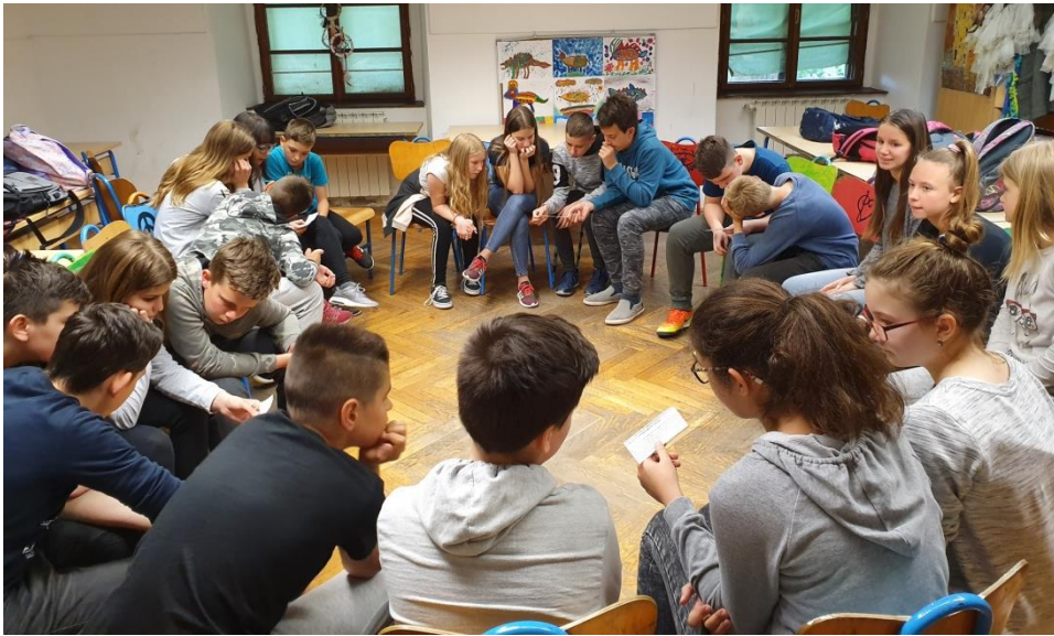
Slika 14. Učenici rješavaju problemske zadatke

razrednika da mi pomogne riješiti situaciju. Smatram da bi učenik samo još više stvarao probleme ukoliko to nisam učinila. Naime, učenici koji nisu ostvarili potrebu za ljubavlju, pripadanjem i samopoštovanjem mogu postati destruktivni. Polaskom u školu, učitelji, nastavnici, a kasnije i vršnjaci, postaju važni u životu pojedinca kako bi ostvario svoje potrebe. Učenici kojima se u razrednom odjeljenju govori kako su "loši," i kako od njih ništa neće biti, nisu u mogućnosti razviti pozitivnu sliku o sebi (Bognar, 1999). Moguće je da je navedeni učenik prošao kroz slična iskustva gdje nije dobio primjerenu pažnju i priliku za izražavanje svojih osjećaja i problema, što je pridonijelo njegovom problematičnom ponašanju.