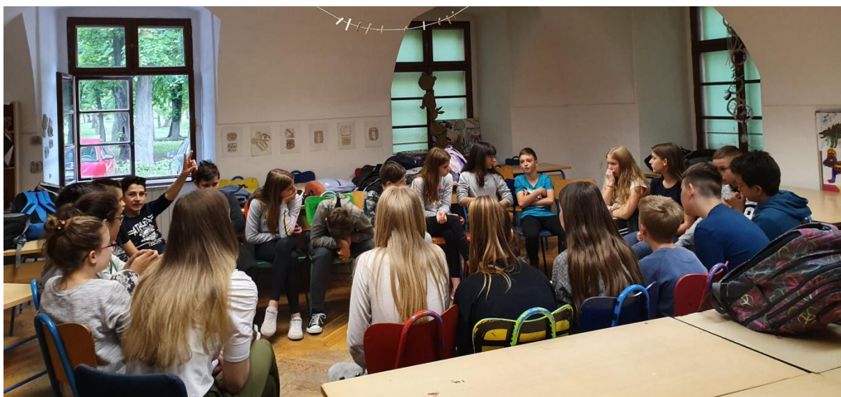
Slika 15. Razgovor s učenicima u krugu