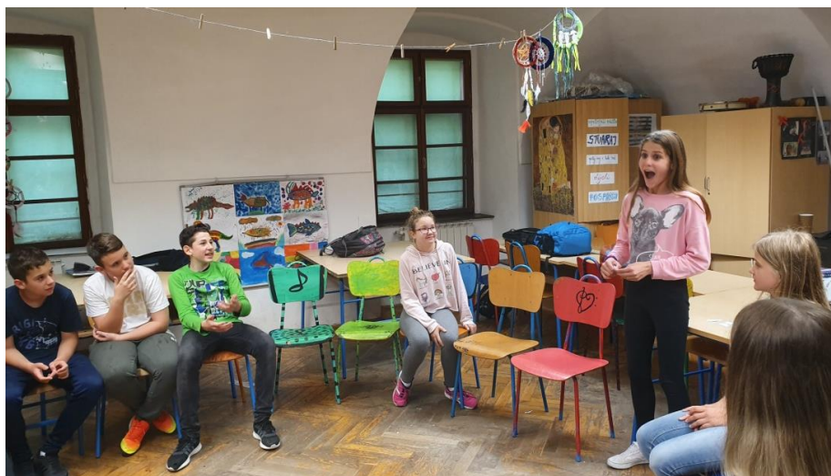
Slika 21. Učenica pokazuje emociju 'sreća,' a drugi pogađaju