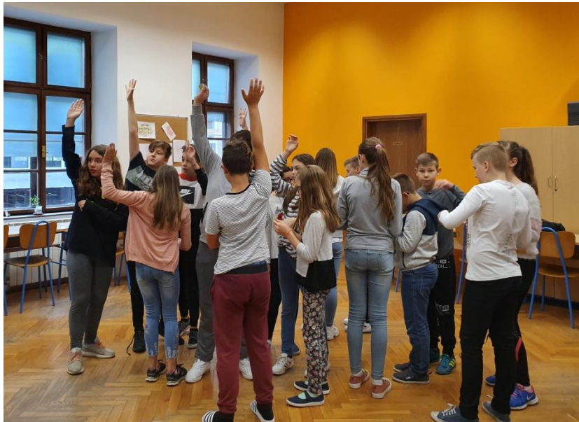
Slika 27. Učenici traže druge članove svog tima

Tijekom druge aktivnosti (“Pronađi svoj tim!,,) učenici su dobili dio puzzle te su morali naći ostale koji imaju puzzle na istu temu. Svaki tim je dobio određeni crtić. Kako su učenici dizali ruke tako sam im dodjeljivala brojeve za timove. Vrlo su brzo obavili ovu aktivnost te bez problema našli svoje timove. Prihvatili su članove svog tima i nisu se žalili jedni na druge. Mislim da je njihova spremnost na suradnju s različitim osobama pohvalna.