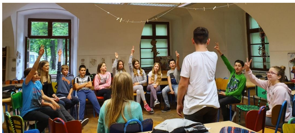
Slika 22. Učenici 6. razreda pogađaju pojmove

Zatim je uslijedila druga aktivnost ("Prepoznavaj i odglumi,). Učenicima sam čitala rečenice koje opisuju različite situacije, a oni su morali pokazati kako bi se osjećali u tim situacijama. Sa 6b nisam koristila lopticu kako bi odabrala učenike koji će pokazati emociju već je cijeli razred pokazivao skupa. S obzirom da su kao razred živahni smatrala sam da loptica ne bi bila dobra ideja. Bilo me strah da će bacanje loptice prijeći u gađanje i preveliku galamu. Učenici su dosta neozbiljno pristupili ovoj aktivnosti. Vjerujem da im je bilo neugodno glumiti te da im je bilo smiješno gledati jedni druge kako glume jer time izlaze iz svoje zone ugone. Ipak, učenici su lijepo prikazali određene emocije. Tijekom aktivnosti, dva učenika su bila preglasna, stoga sam jednog premjestila da sjedi kraj mene. U tom trenu on više nije htio sudjelovati već je sjedio i promatrao ostale kao znak ljutnje na moj zahtjev.