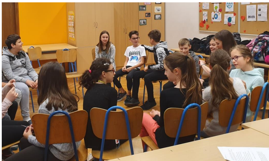
Slika 10. Sudjelovanje učenika u drugom zadatku