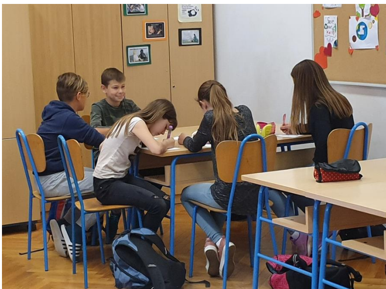
Slika 2. Učenici pišu svoje ciljeve

U trećoj aktivnosti (“Osvoji zvjezdicu, budi pozitivan!,,) učenici su otišli na kraj učionice. Cilj im je bio doći do drugog kraja učionice tako što moraju reći nešto pozitivno o sebi, dobru osobinu ili vrlinu. Učenici su odlično prihvatili i odradili tu aktivnost. U trenutcima kada se netko nije mogao sjetiti ničeg pozitivnog o sebi, razredni odjel je imao zadatak reći dvije dobre stvari. Štoviše, govorili su puno više od dvije dobre stvari. Nije im bio problem istaknuti pozitivne i dobre strane svojih vršnjaka što znači da su dosta povezani u razrednom odjelu te da znaju mnogo toga jedni o drugima. Također, sumentorica Simel Pranjić svojim mi je komentaram ukazala na još nekoliko bitnih značajki: