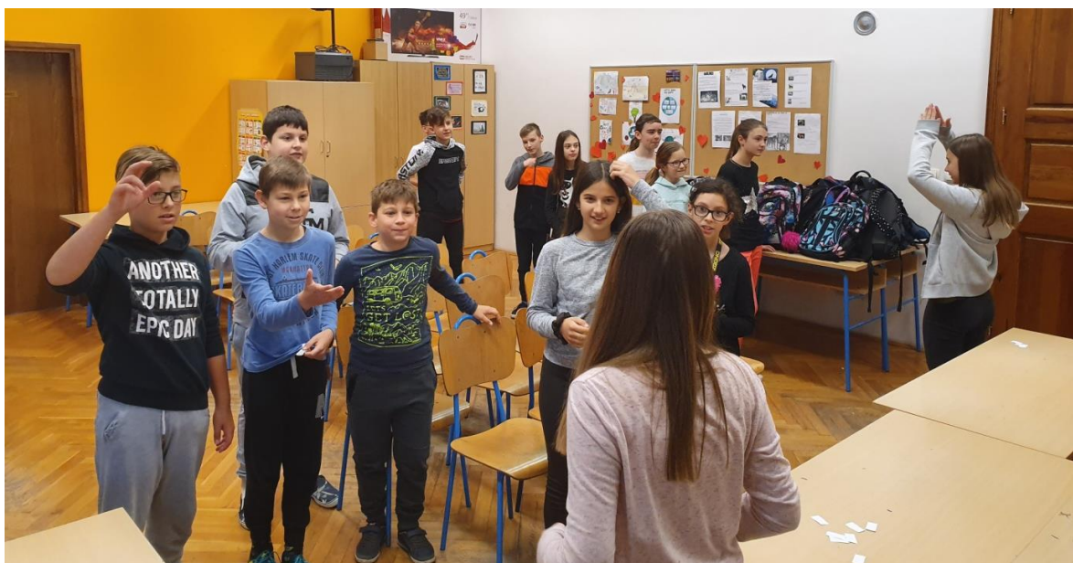
Slika 8. Učenici pokazuju i pogađaju pojmove

Tijekom prve aktivnosti (“Pogodi pojam!,,) učenici su morali samo mimikom i gestama objasniti što više pojmova unutar svog tima. Učenici su za ovu aktivnost imali otprilike 2 minute. Učenicima je trebalo više vremena da se užive u aktivnost s obzirom da je bilo 8.00h ujutro. No bez obzira na rane jutarnje sate lijepo su surađivali, bez vikanja, te jedan po jedan objašnjavali pojmove, što je bio lijep pokazatelj međusobnog poštovanja i discipliniranog ponašanja na koje su naviknuli.