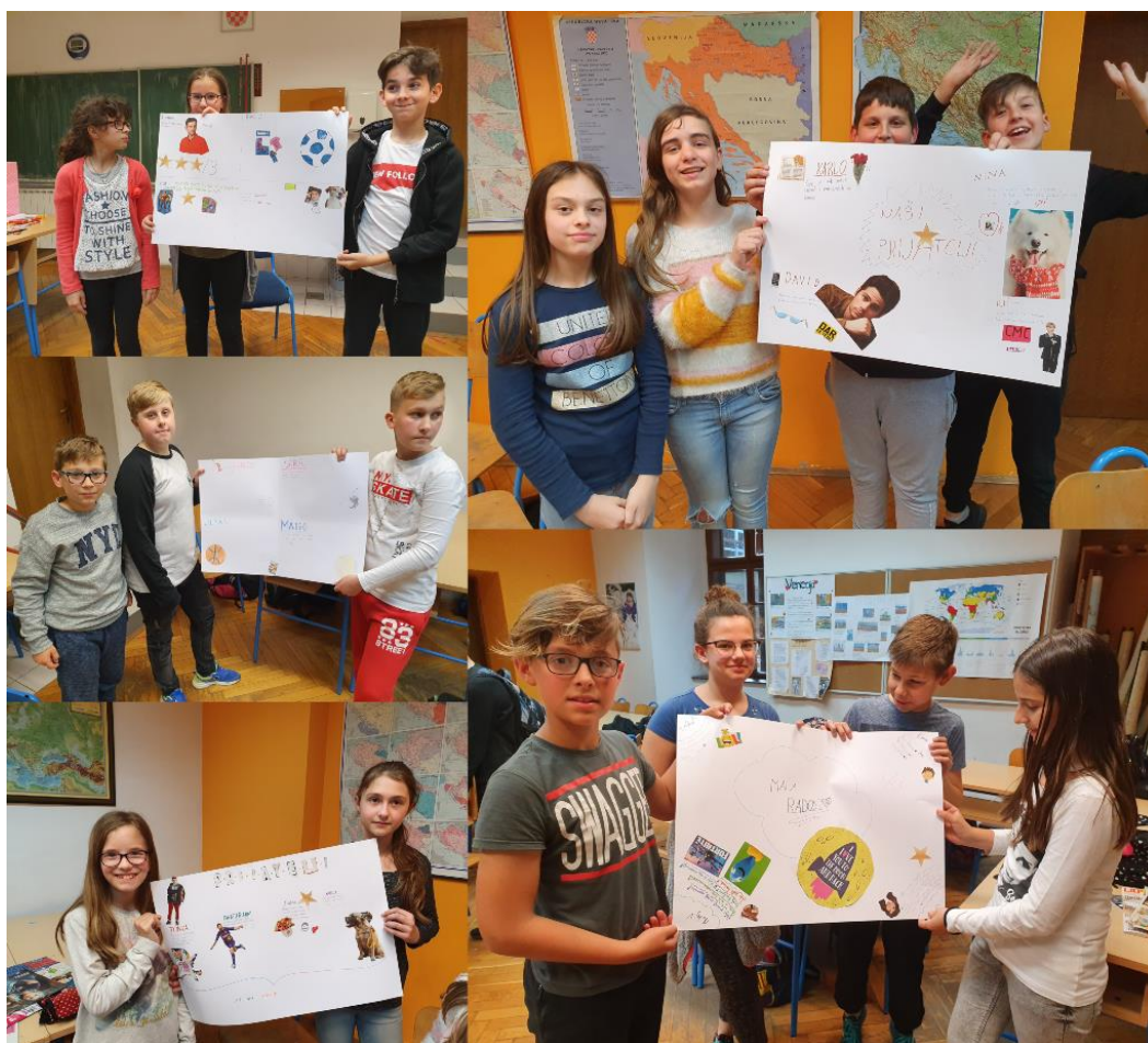
Slika 5. Grupe pokazuju svoje plakate

Bilo mi je važno da svaka grupa izloži što su napravili jer smatram da je jako bitno da učenici čuju što su jedni o drugima lijepo napisali i izradili. Bili su jako uzbuđeni oko plakata, pregledavali su što su drugi napravili i iščekivali čuti što će drugi reći o njima.