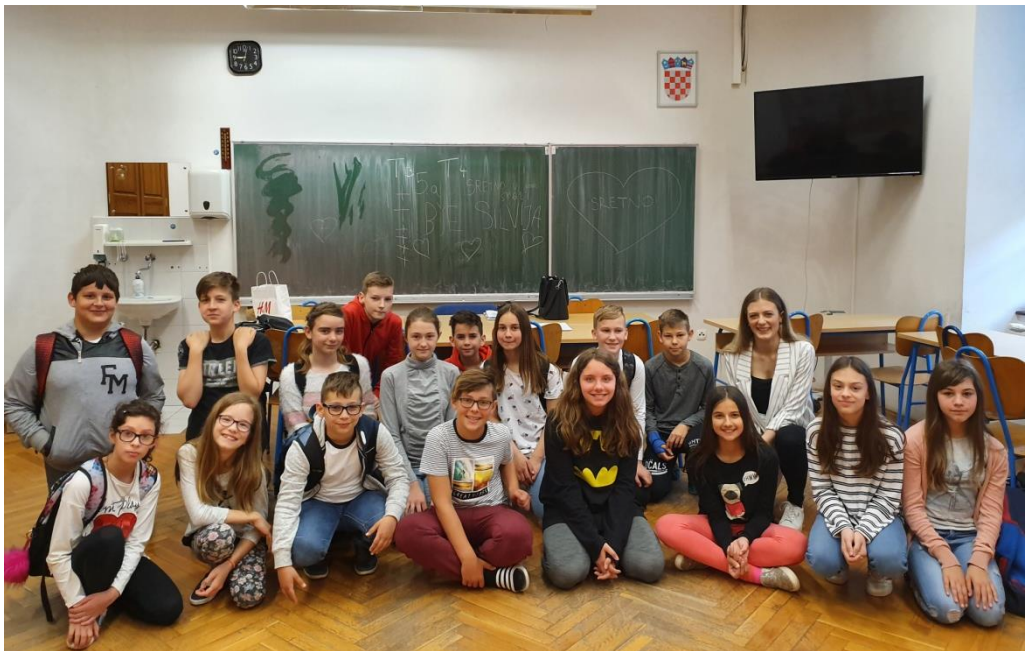
Slika 30. Zajedničko slikanje za kraj radionica

Učenici su mi napisali nekoliko lijepih poruka na ploču u znak oprostaja. Ispitali su me gdje ću sljedeće raditi te hoću li im doći još koji puta. Rekli su kako im je na radionicama bilo lijepo i zabavno. Zatim su tražili od svoje razrednice da se fotografiraju sa mnom za uspomenu. Cijelo iskustvo s 5a bilo je vrlo lijepo i ugodno. Smatram da je svim nastavnicima potreban pozitivan komentar i lijepo djelo kako bi bili motivirani za daljnji rad. Nastavnici su željni pozitivnih povratnih informacija kako od sadašnjih učenika tako i bivših učenika te roditelja. U takvim situacijama nastavnici dobivaju podršku i motivaciju za daljnji rad, trud i isprobavanje novih stvari (Hargreaves, 2001). Učenici su tijekom svih radionica lijepo surađivali, slušali jedni druge te poštovali tuđa mišljenja, stoga mislim da su naučili korisne stvari te da će se u trenucima kada to bude potrebno sjetiti naših razgovora. Istu stvar navela je njihova razrednica te rekla kako smatra da su učenicima radionice bile vrlo korisne i zanimljive. Podrška koju sam dobila od razrednice i učenika ostavlja me motiviranom za daljnji rad. Reakcija razreda na moj odlazak bila mi je neočekivana, lijepo su me iznenadili i usrećili. Svojim činom pokazali su kako mogu biti pažljivi, složni i skladni jer su kao razred vrlo brzo odlučili prirediti kratku oproštajku.