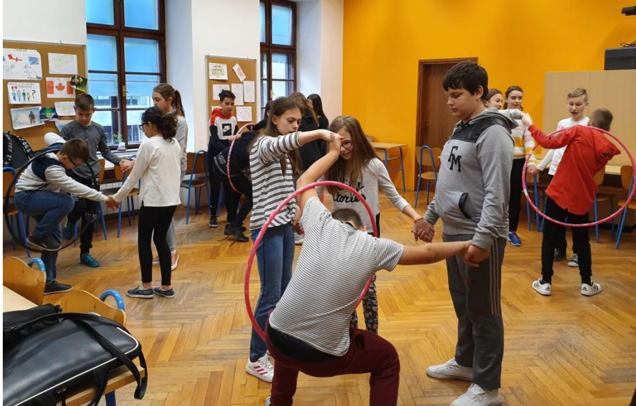
Slika 28. Provlačenje kroz hula-hoop obruče

da pobijede ili da budu prvi, već da zaista do kraja izvrše zadatak. To govori u prilog tomu da je ozračje u učionici više suradničko, nego isključivo natjecateljsko,, (S. Simel Pranjić, osobna komunikacija, 16. srpnja 2019. godine).