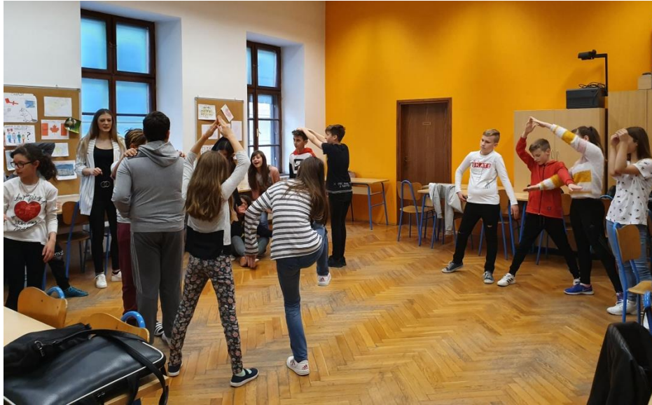
Slika 29. Učenci formiraju slova

Na kraju natjecateljskih aktivnosti prvi tim imao je tri “plusića,, drugi tim jedan “plusić,, treći tim dva “plusića,, a četvrti je bio bez “plusića,,. Zatim smo napravili krug sa stolicama te počeli s petom aktivnošću (“Suradnja,,) tijekom koje smo razgovarali o dosadašnjim aktivnostima i suradnji. Prvo sam učenike pitala kako im je bilo raditi u timovima na što su mi odgovorili kako im je bilo super. Zatim su učenice rekle: “Bilo mi je jako zabavno i jako dobro zato što smo morali raditi u grupama da se dogovorimo kako će koja slova izgledati,, ; “Bilo je dobro i zanimljivo je bilo,, . Učenci su istaknuli svoje najdraže aktivnosti, a svatko je imao određenu aktivnost koja se istaknula za njega.