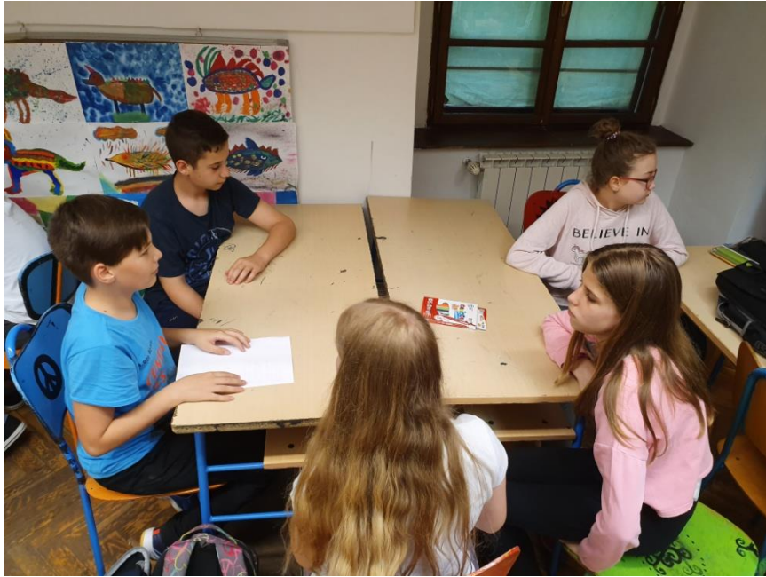
Slika 24. Učenci sudjeluju u grupama te izrađuju kreativne stripove o empatiji