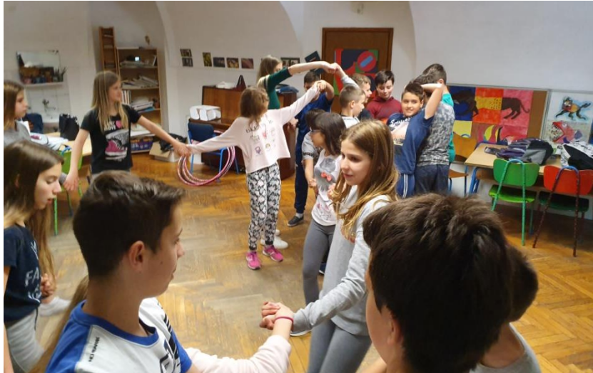
Slika 31. Otpetljavanje čvora s 6. razredom

Za drugu aktivnost (“Pronađi svoj tim!,,) podijelila sam učenicima dijelove puzzle, a njihov zadatak bio je pronaći ostale s istim puzzlama i tako stvoriti tim. Prije podjele puzzli učenicima sam objasnila način rada, isto kao i u 5. razredu. Učenici su brzo uspjeli pronaći svoje timove, a aktivnost im je bila zanimljiva. Izdvojila bih tim koji je pažljivo položio svoje puzzle na pod, prije nego su javili da su pronašli svoje članove. Ovime su pokazali kako im je bila bitnija kvaliteta kojom će odraditi aktivnost od toga da budu prvi. Takva ponašanja su poželjna među učenicima stoga mi je bilo drago vidjeti njihovu pažnju tijekom ove aktivnosti.