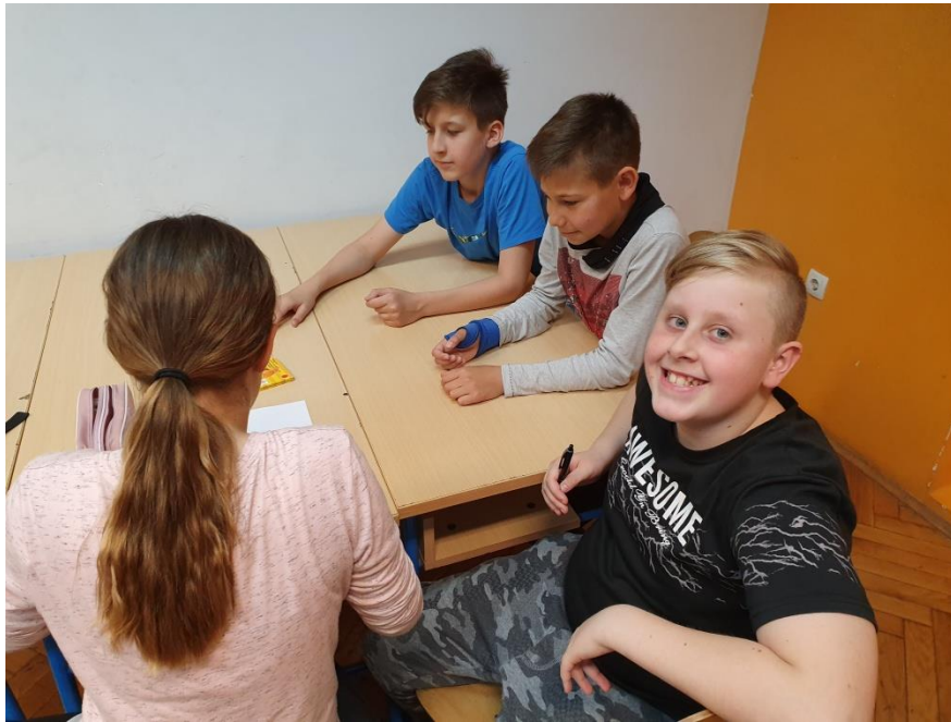
Slika 19. Učenici u grupi izrađuju strip na temu empatije

Usljedio je grupni rad (“Kreativnost i empatija,”) tijekom kojeg su učenici trebali osmisliti priču, pjesmu ili strip u kojem će prikazati što je empatija i koja je njezina važnost. Nažalost, prve tri aktivnosti trajale su duže od predviđenog s obzirom na živahnost i energiju koju su učenici imali, stoga nisu do kraja stigli izraditi svoje stripove.