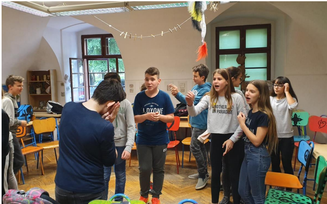
Slika 13. Učenici pogađaju pojmove u timovima

U drugoj aktivnosti (“Verbalna i neverbalna komunikacija,,), učenici su u parovima izvršavali dobivene zadatke, kao i učenici 5. razreda. S obzirom da je jedna učenica bila bez para, kritička prijateljica Arijana sudjelovala je u ovoj aktivnosti. Tijekom razgovora o ostvarenoj aktivnosti, učenici koji su morali ignorirati svog para izjasnili su se kako su se osjećali “ loše jer mi je papirić rekao da to radim a ja to nisam htio raditi,, ; “ dosadno, on tu priča a ja ga moram ignorirati,, . Njihovi parovi, koji su bili ignorirani dok su govorili, osjećali su se “ dobro jer sam znao da me mora ignorirati,, ; “ meni nije bilo bitno jer moj problem nije bio baš važan,, . Ipak, najbolje su se osjećali kada su trebali slušati i ohrabrivati osobu. Kada sam zamolila učenike da dignu ruku ako misle da je da je ovaj drugi, pozitivniji način komuniciranja najčešći za njihov razred, samo je nekoliko učenika diglo ruku, a nekoliko je bilo neodlučnih.