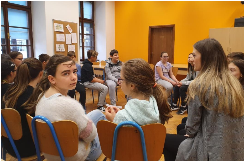
Slika 9. Sudjelovanje učenika u prvom zadatku