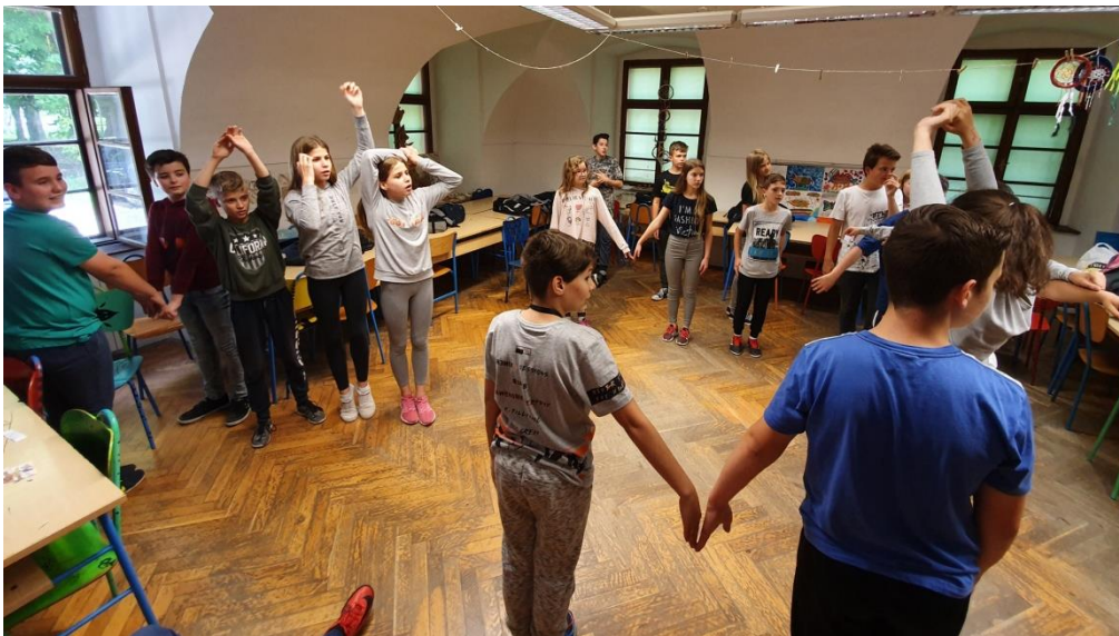
Slika 34. Formiranje slova u timu

Što se tiče same aktivnosti, učenici su kreativno prikazivali slova stoga sam im u jednom trenu svima dala “plusić,, kako bih nagradila kreativno ponašanje.