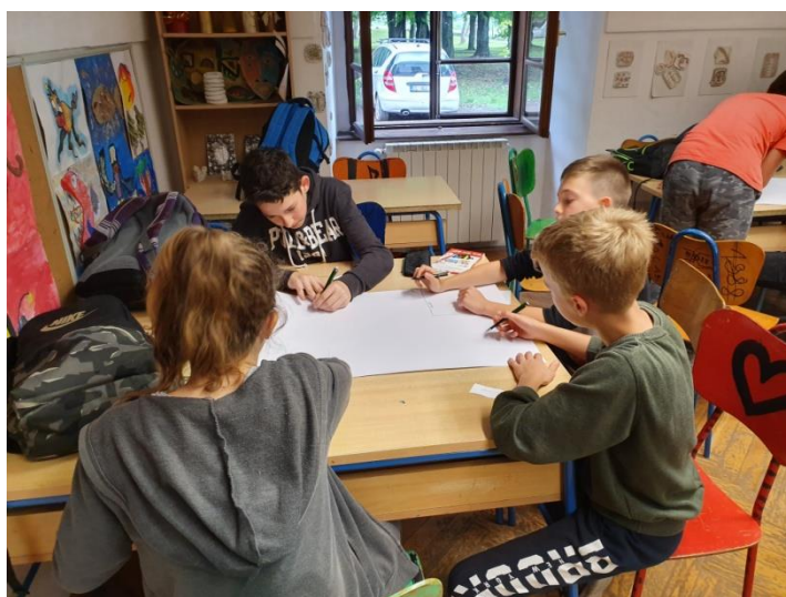
Slika 6. Učenici sudjeluju u grupnoj aktivnosti izrade plakata

U drugoj aktivnosti ("Napravi plakat o meni!,,) sam, za razliku od situacije u 5a, odmah učenike upozorila na vrijeme koje imaju za izradu plakata. Kako se neki učenici nisu poznavali dovoljno dobro, nisu znali što bi napisali. U tim trenucima pitali su druge učenike za pomoć, a njihov razrednik je također pomagao i predlagao ideje što mogu napisati.