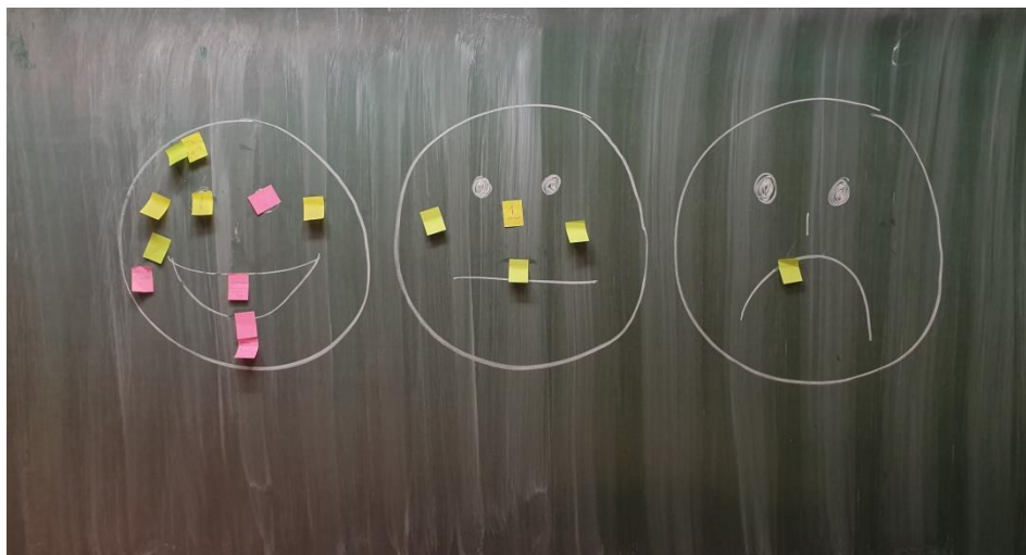
Slika 12. Evaluacija treće radionice u 5. razredu

Za evaluaciju sam učenicima podijelila ljepljive papiriće na koje su mogli napisati svoje dojmove, što im se najviše ili najmanje sviđjelo. Papiriće su zalijepili na smješka koji odgovara njihovom dojmu o radionici. 11 učenika zalijepilo je svoj papirić na sretnog smješka, 4 učenika na neutralnog i jedan učenik na tužnog smješka. Neke od poruka na papirićima bile susu: “zadnja radionica mi je najzanimljivija zato što smo naučili iz nje,,; “danas mi je bio jako lijep dan i naučila sam puno stvari,,; “super, smješno,,. Što se tiče aktivnosti, dvoje učenika navodi kako im je prva aktivnost bila najbolja. Upravo iz ovakvih učeničkih komentara može se vidjeti važnost pedagoškog djelovanja u školama. Odmicanjem od frontalnog načina rada i uvođenjem rasprava, oluja ideja, radionica, aktivnosti koje potiču rješavanje problema, rada u grupama učenicima dajemo mogućnost da budu konstruktori vlastitog znanja. Aktivnim sudjelovanjem učenici puno efikasnije usvajaju znanja i razne kompetencije (Matijević, 2016).