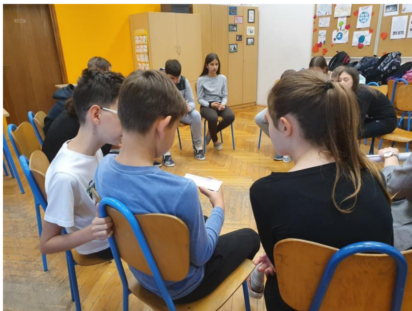
Slika 11. Učenci u grupama rješavaju problemske zadatke

Tijekom predstavljanja svog problema učenici su ukratko objasnili o čemu se radilo u priči te predložili svoja rješenja. Ozbiljno su shvatili svoj zadatak, slušali su jedni druge te ponudili odlična rješenja. Neka od njihovih rješenja uključivala su i odrasle osobe poput nastavnika. Važno je da učenici vide nastavnike kao osobe koje im mogu pomoći ukoliko postoji problem te da se neće ustručavati obratiti nastavnicima za pomoć. Jedna učenica lijepo je predstavila što je bio problem u priči gdje se jedan dječak hvalio drugome i zanemario njegov problem: “Oni su mogli riješiti problem tako da je Karlo mogao poslušati Leonov problem i mogao mu je dati neki savjet, a onda je poslije mogao pričati o svojim uspjesima jer postoji velika razlika između hvaljenja i pričanja o svojim uspjesima, ali da mi poslušamo drugoga a ne da samo pričamo o sebi i ne slušamo drugoga,,