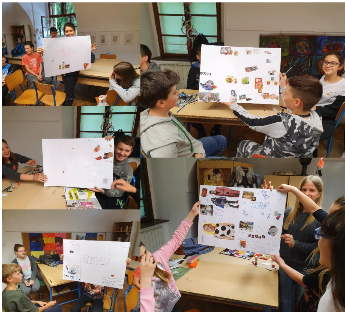
Slika 7. Grupe izlažu svoje plakate

223). Nadalje, autor navodi kako je veliki propust nastavnika što ne omogućavaju dovoljno prilika upravo za učeničko javno izlaganje. Učenici bi svakodnevno trebali javno govoriti, izlagati i nastupati. No, javno izlaganje učenika u ovoj aktivnosti u oba razreda bilo je kratko i nesigurno. Jedan od razloga je nedostatak vremena. U 6. razredu radionica je vremenski bila puno kvalitetnije organizirana, no bez obzira na to, vremena za izlaganje nije bilo dovoljno. Sljedeći mogući razlog za kratko i nesigurno izlaganje je neugodnost pričanja pred drugima. Moguće je da postoji, s jedne strane, strah onoga koji izlaže od toga hoće li se osobi o kojoj govori svidjeti to što izloži. No s druge strane, može postojati i strah osobe o kojoj govori, gdje osoba nestrpljivo čeka što će drugi izložiti i hoće li reći nešto pozitivno o njoj. Ono što bih pohvalila je činjenica da su svi učenici predstavljeni na lijep i pozitivan način. Smatram kako bi se neugodnost smanjila češćim izlaganjem učenika ovakvim aktivnostima, te poticanjem da se izražavaju nesmetano, otvoreno i bez straha od osude.