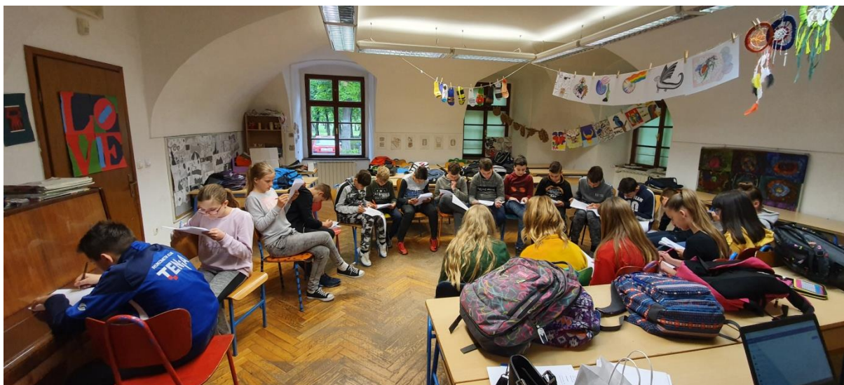
Slika 3. Učenci popunjavaju evaluacijske upitnike