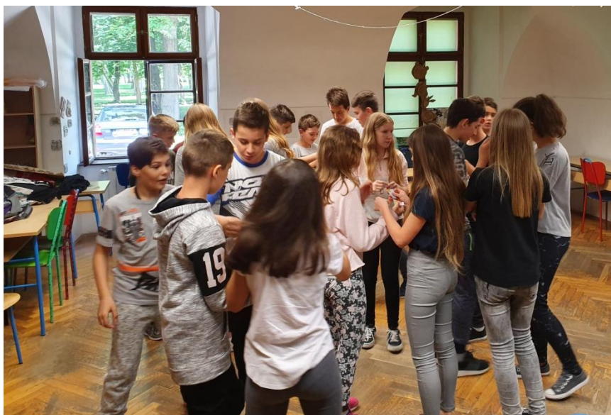
Slika 32. Traženje timova

Za drugu aktivnost (“Pronađi svoj tim!,,) podijelila sam učenicima dijelove puzzle, a njihov zadatak bio je pronaći ostale s istim puzzlama i tako stvoriti tim. Prije podjele puzzli učenicima sam objasnila način rada, isto kao i u 5. razredu. Učenici su brzo uspjeli pronaći svoje timove, a aktivnost im je bila zanimljiva. Izdvojila bih tim koji je pažljivo položio svoje puzzle na pod, prije nego su javili da su pronašli svoje članove. Ovime su pokazali kako im je bila bitnija kvaliteta kojom će odraditi aktivnost od toga da budu prvi. Takva ponašanja su poželjna među učenicima stoga mi je bilo drago vidjeti njihovu pažnju tijekom ove aktivnosti.