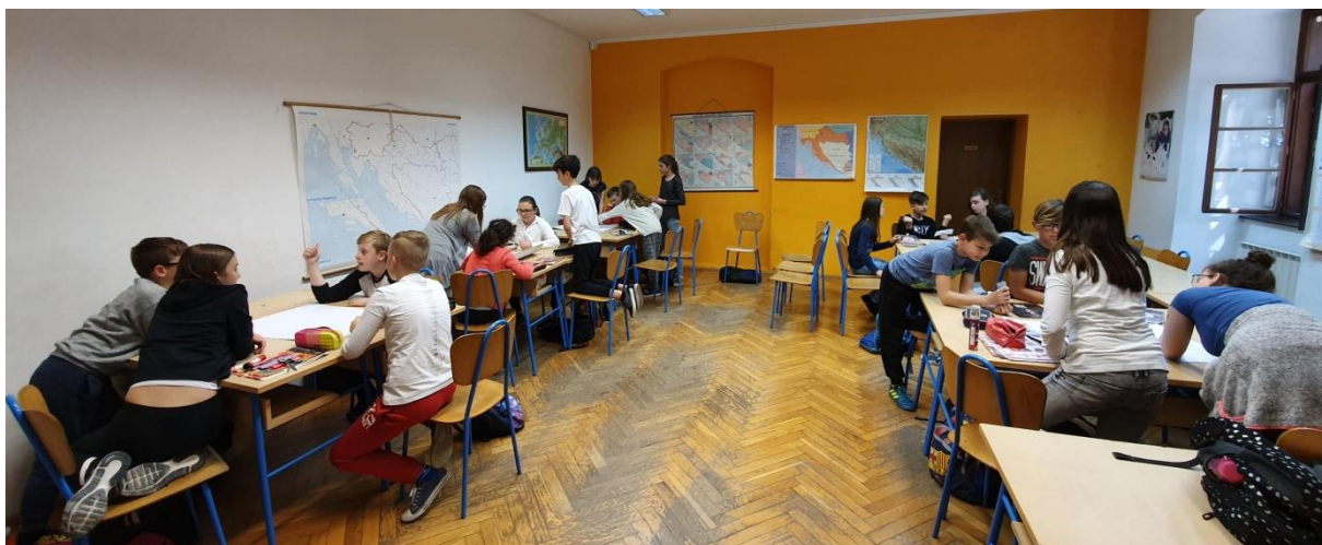
Slika 4. Učenici izrađuju plakate u grupama

Bilo mi je važno da svaka grupa izloži što su napravili jer smatram da je jako bitno da učenici čuju što su jedni o drugima lijepo napisali i izradili. Bili su jako uzbuđeni oko plakata, pregledavali su što su drugi napravili i iščekivali čuti što će drugi reći o njima.