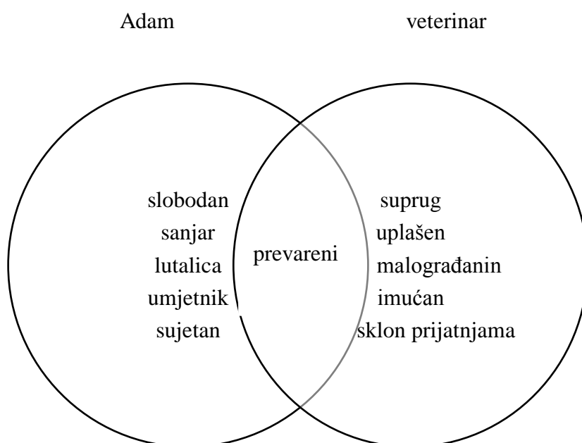
Vennov dijagram 1, opreka i sumogućnost psihemskih narativnih figura Adam i veterinar

I veterinar i Adam dijele sastavnicu biti prevaren , 72 što ih čini komposibilnima te omogućuje stvaranje događaja između njih.