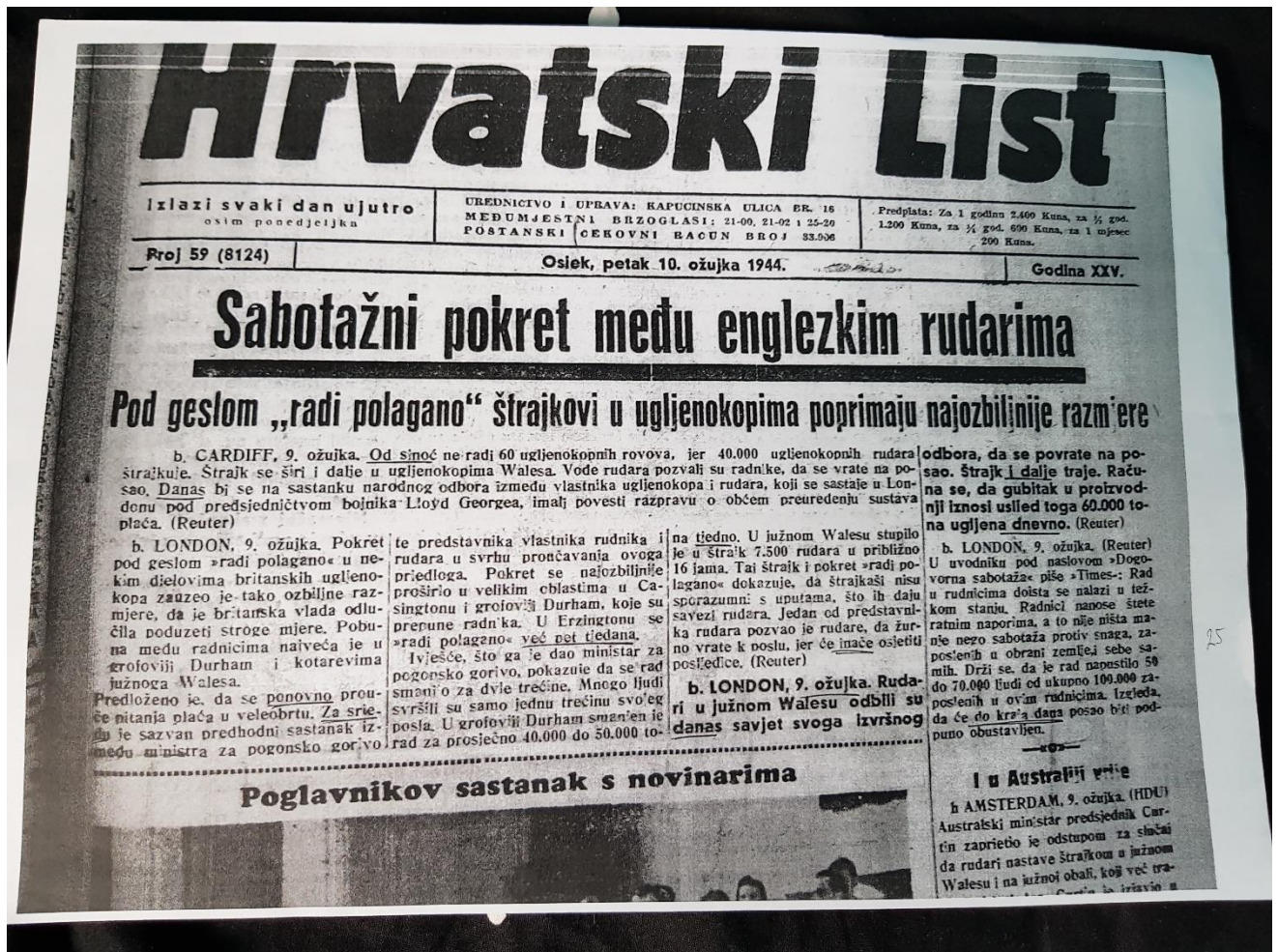
Slika 5. Hrvatski list, 10. ožujka 1944.