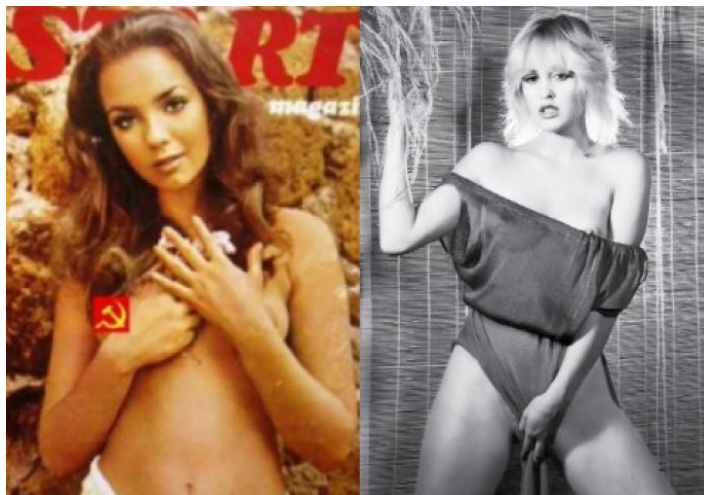
Slika 5. Start