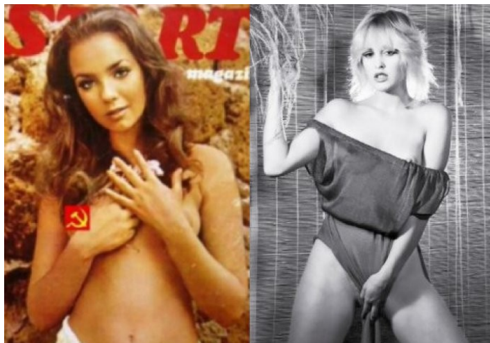
Slika 5. Start