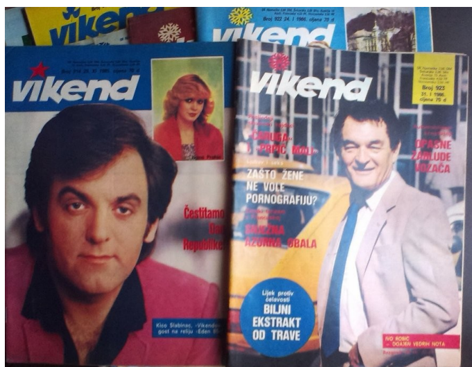
Slika 4. Vikend

Izvor: Internet: Vikend, preuzeto 5.8.2018. sa https://www.njuskalo.hr/casopisi-magazini/vikend-svi-1-kn-kom-pojedinačno-2-kn-kom-oglas-20829269