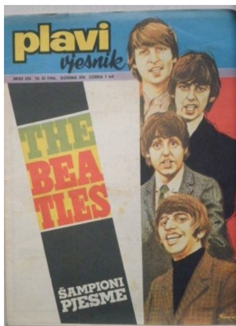
Slika 1. Plavi Vjesnik