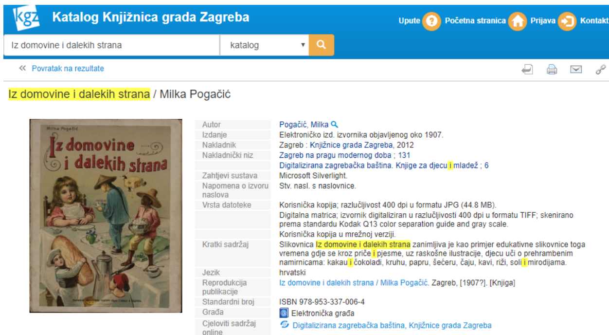
Slika 4. Usporedba katalogiziranja tiskane i e-knjige – fotografija zapisa e-knjige

Kataložni opis se i kod tiskane i kod e-knjige sastoji od osam skupina koje se popunjavaju prema podacima koji se nalaze unutar publikacije. Skupine se sastoje od nekoliko elemenata od kojih su neki za tiskane i e-knjige isti, a neki različiti. Prilikom katalogiziranja tiskanih i e-knjiga unutar skupina i za elemente koristi se ista interpunkcija. 49