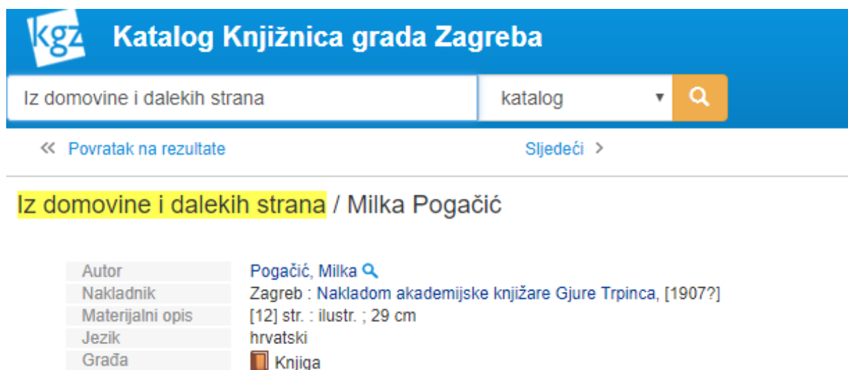
Slika 3. Usporedba katalogiziranja tiskane i e-knjige – fotografija zapisa tiskane knjige

Nakon što su ukratko predstavljene skupine i pravila katalogiziranja tiskane i e-knjige na primjerima kataložnih zapisa istog naslova u različitim oblicima odnosno u obliku tiskane i obliku e-knjige bit će prikazano što je to različito, a što isto u katalogiziranju tiskanih i e-knjiga. Primjer na kojima će usporediti katalogizacija tiskanih i e-knjiga je djelo Iz domovine i dalekih strana autorice Milke Pogačić koje se u katalogu Knjižnica grada Zagreba može naći u tiskanom (Slika 3) i elektroničkom obliku (Slika 4).