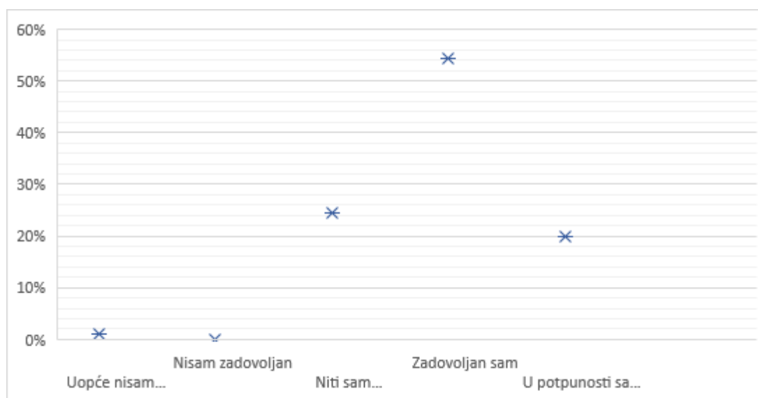
Grafički prikaz 1. Uspješnost vlastitog pretraživanja

S obzirom da većina studenata više preferira korištenje novih tehnologija pri pretraživanju znanstvenih i stručnih informacija, istraživanjem se također saznalo i jesu li tijekom studija ikada koristili baze podataka na koje je fakultet pretplaćen, Google Scholar i slično u svrhu pretraživanja informacija, odnosno literature za vlastiti rad. Većina je studenata (89.1%) na ovo pitanje odgovorilo potvrdno. Iako je 10.9% studenata odgovorilo da nije do sada koristilo gore navedene informacijske resurse, treba uzeti u obzir da mlađi studenti (studenti prve i druge godine preddiplomskog studija) nemaju još dovoljno razvijene sposobnosti za naprednije oblike pretraživanja te upravo to može biti razlog što su odgovorili negativno na ovo pitanje. Studenti koji su odgovorili potvrdno na ovo pitanje, u sljedećem su pitanju morali ocijeniti uspješnost vlastitoga pretraživanja te su rezultati vidljivi u Grafičkom prikazu 1.