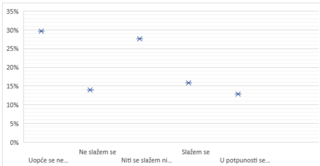
Grafički prikaz 8. Tvrdnja: Ne volim pretraživati baze podataka jer uglavnom pronalazim izvore na stranim jezicima

Što se tiče naprednih tehnika pretraživanja kao što su Booleovi operatori, pretraživanje po ključnim riječima, frazama i slično, 80.2% studenata odgovorilo je da se upoznao s njima tijekom studija. Preostalih 19.8% studenata, od kojih se 11.9% niti slaže niti ne slaže s prethodnom tvrdnjom, ne treba uzeti kao loš rezultat jer se radi o odgovorima studenata 1. i 2. godine preddiplomskog studija. Idućom tvrdnjom čiji su rezultati vidljivi u Grafičkom prikazu 9 nastojalo se utvrditi koliko studenti smatraju navedene tehnike pretraživanja korisnim pomagalom pri pretraživanju informacija te 73.3% studenata smatra da se pomoću naprednih tehnika za pretraživanje može puno brže doći do traženih informacija, a 20.8% studenata se niti slaže niti ne slaže s navedenom tvrdnjom. Tek 6% studenata smatra da im napredne tehnike ne mogu pomoći da brže i preciznije pretražuju informacije, ali ovaj se podatak može uzeti s rezervom s obzirom da se radi o minimalnom broju studenata koji je opovrglo ovu tvrdnju.