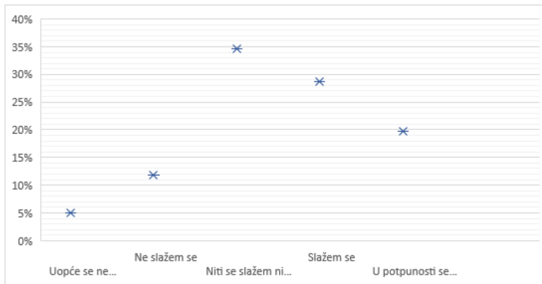
Grafički prikaz 7. Tvrđnja: Baze podataka prilično su jednostavne za pretraživanje te s lakoćom pronalazim tražene informacije

podataka prilično jednostavne za pretraživanje te da se s lakoćom mogu pronaći tražene informacije. Zanimljiv podatak je da se čak 34.7% studenata nije moglo odlučiti smatra li tvrdnju točnom ili netočnom što se može pripisati činjenici da dugotrajnost i uspješnost pretraživanja ovise i o ozbiljnosti i zahtjevnosti rada zbog kojega se vrši pretraživanje. Dok se skoro polovina studenata (48.5%) složila s tvrdnjom, 16.9% ne smatra baze podataka jednostavnima za pretraživanje što može ovisiti i o godini studija studenata koji su odgovorili ovako s obzirom da još nisu stekli iskustvo u pretraživanju istih. Odgovori studenata na ovu tvrdnju vidljivi su u Grafičkom prikazu 7.