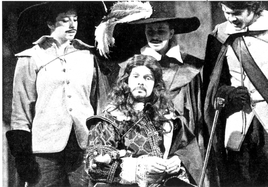
E. Rostand, Cyrano de Bergerac , HNK Osijek, Darko Milas

bavi. Dok Don Quijote s tim nema nikakvih problema, Cyrano se i pred skorom smrt plaši Roksani iskazati svoju ljubav. Upravo nam strah od iskazane ljubavi, sučeljavanje s mogućim porazom, nesigurnost... i danas omogućuju potpuno suživljavanje s glavnim dramskim likovima, i baš uz pomoć straha Cyrano živi na kazališnim pozornicama već više od sto osam godina. Krešimir Mikić i Olga Pakalović zatiru rijetke nelogičnosti i slabe točke osječke izvedbe Cyrana de Bergeraca i iz tog razloga one nisu izrečene te uz Zlatka Svibena, "senkerovski" rečeno, proniču u tajnu čuvanja kvalitete kazališnog proizvoda u uvjetima brze i lake pokvarljivosti. Na tome im hvala.