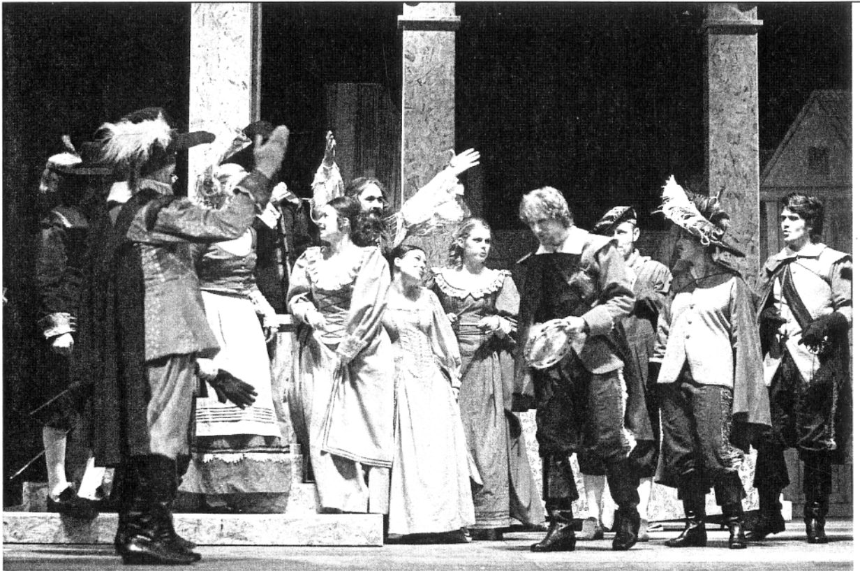
E. Rostand, Cyrano de Bergerac , HNK Osijek

uran što se time željelo postići. Smatram da bi predstava u potpunosti funkcionirala da se koristio samo Kušanov prijevod, isključujući bojazan kako bi junačku komediju u pet činova u stihovima pretvorio u proznu junačku komediju. Kušanovim prijevodom, zbog njegove bliskosti sa suvremenim jezikom, samo bi još više potencirali svezvremenske teme iz Rostandova dramskog teksta, pogotovo one koje su dotiču usamljenosti i nemogućnosti te neželjenosti izražavanja osjećaja. Usto ne bih htio posebno isticati težnju većine teatrologa za uporabom uvijek novih prijevoda tekstova zbog evolucije jezičnih iskaza na suvremenoj kazališnoj sceni koji je u očitom zaostatku. Uporabom i prilagodbom stranog teksta tome se nikako ne pridonosi.