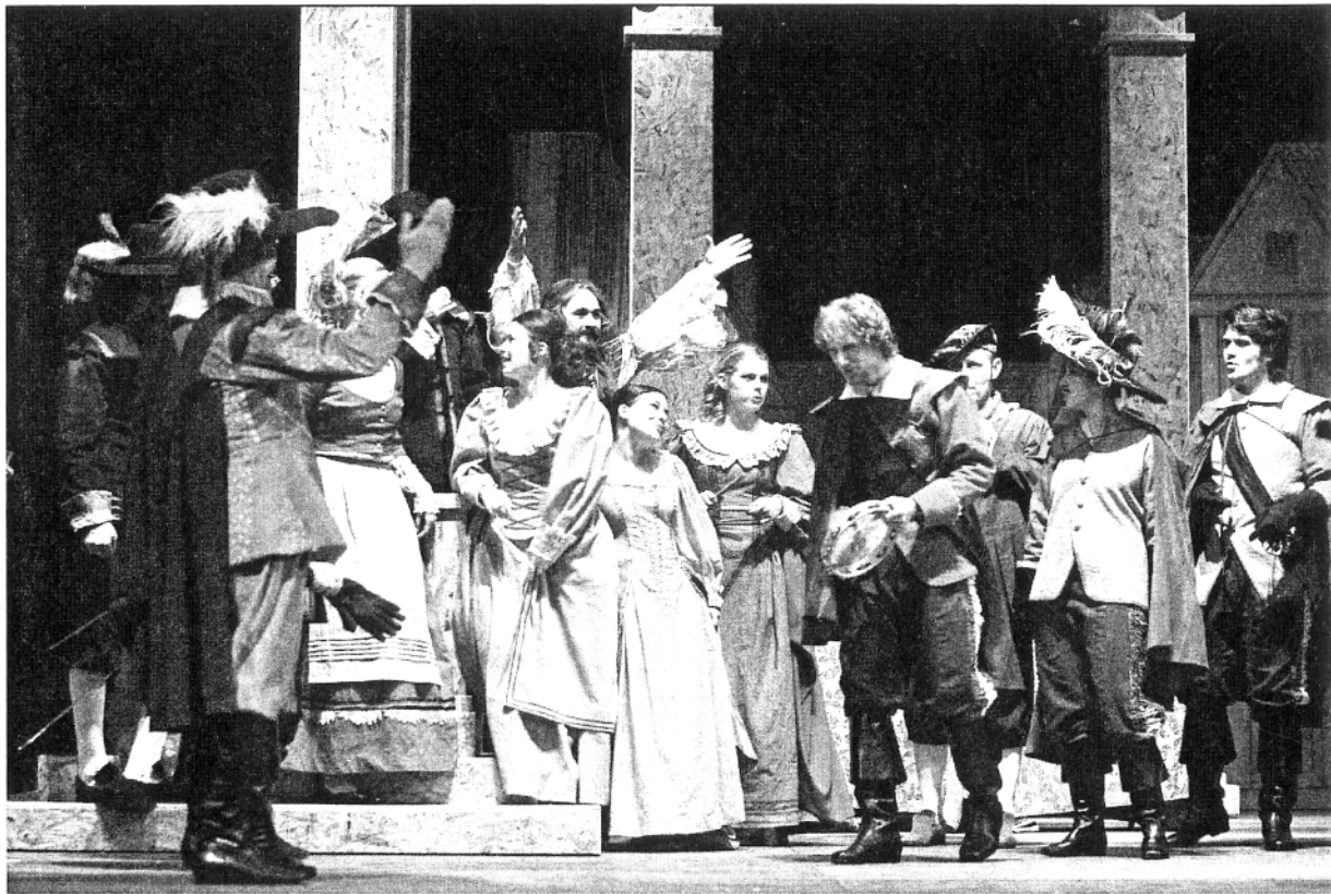
E. Rostand, Cyrano de Bergerac , HNK Osijek

uran što se time željelo postići. Smatram da bi predstava u potpunosti funkcionirala da se koristio samo Kušanov prijevod, isključujući bojazan kako bi junačku komediju u pet činova u stihovima pretvorio u proznu junačku komediju. Kušanovim prijevodom, zbog njegove bliskosti sa suvremenim jezikom, samo bi još više potencirali svezvremenske teme iz Rostandova dramskog teksta, pogotovo one koje su dotiču usamljenosti i nemogućnosti te neželjenosti izražavanja osjećaja. Usto ne bih htio posebno isticati težnju većine teatrologa za uporabom uvijek novih prijevoda tekstova zbog evolucije jezičnih iskaza na suvremenoj kazališnoj sceni koji je u očitom zaostatku. Uporabom i prilagodbom stranog teksta tome se nikako ne pridonosi.