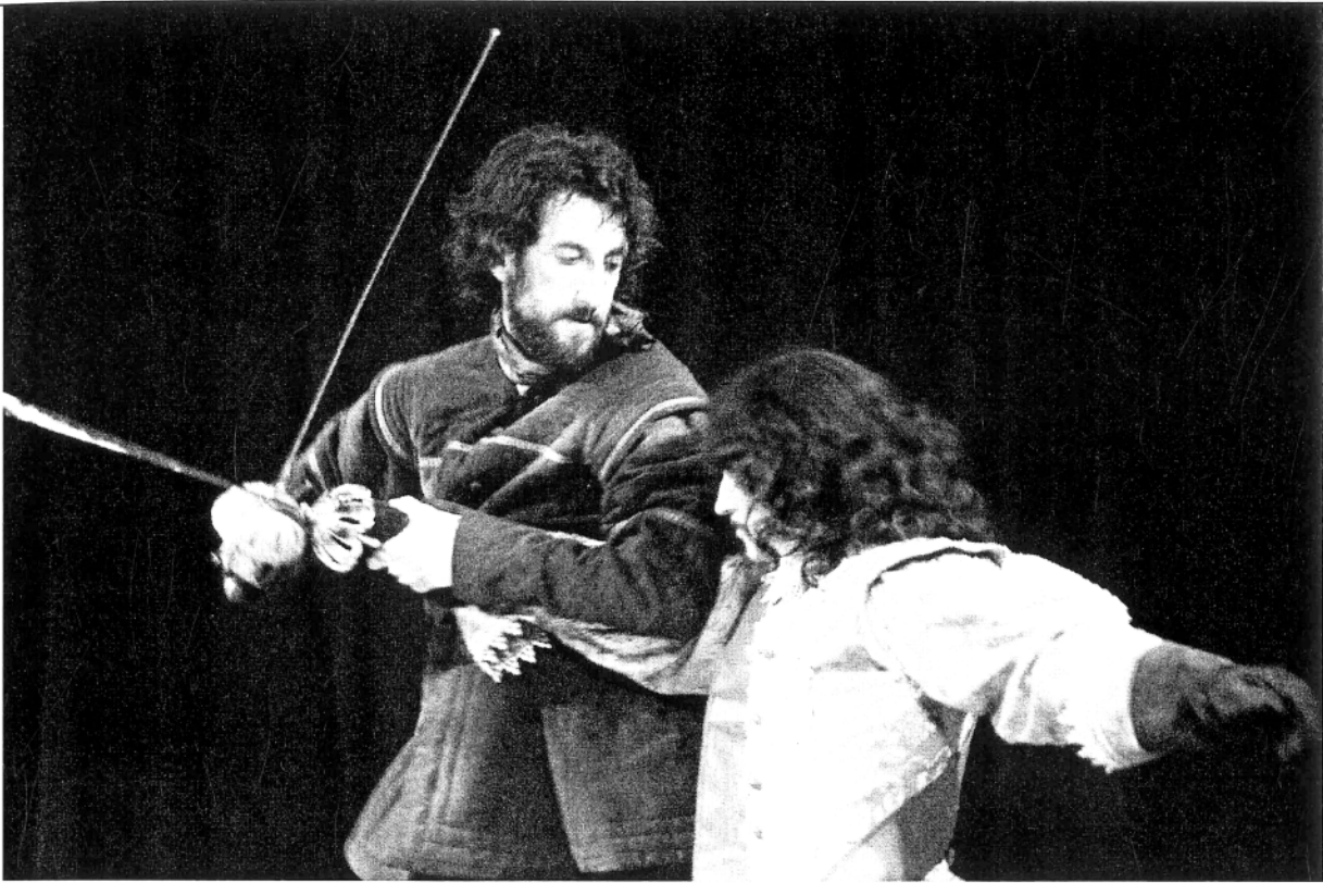
E. Rostand, Cyrano de Bergerac , HNK Osijek, Krešimir Mikić

riječi, bez scenske geste ili pokreta glumaca, a poznavajući Rostandov tekst, mogao bih raspodijeliti uloge baš kako je to i redatelj učinio. Svaki kostim svojim oblikom, količinom i rasporedom materijala ocrta temeljne karakterne osobine svakog pojedinog lika i uvelike pojednostavljuje posao glumcu. Rasvjeta (Josip Ružička) i oblikovanje svjetla (Ivo Nižić) su od izuzetne važnosti u središnjem dijelu uprizorenja kada podno balkona skriveni Cyrano svoje ljubavne stihove namijenjene Roksani suflira Christianu. I doista kako je i zamišljeno, Roksana ni u jednom trenutku nije u mogućnosti primijetiti skrivenog Cyrana. Sjena je raspoređena tako da se njome čak daje i prostora za neverbalne nesuglasice između Christiana i Cyrana koje Roksanimom oku ostaju skrivene, ali ne i publici. Igru svjetla i sjene omogućuju dva na trenutke sukobljena dramska lika kojim, kroz prolaženje tamnim, odnosno svijetlim dijelovima pozornice, čas naziremo samo figuru, a čas bivamo upoznati s njihovom nutrinom kroz "čitanje" grimasa na licu.