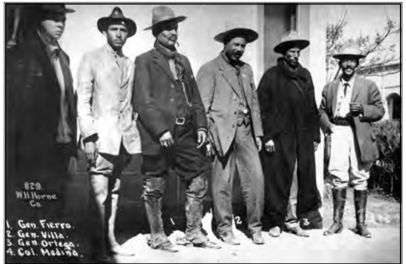
Pancho Villa i revolucionari

Madero je pokušao voditi politiku kompromisa, no to se pokazalo vrlo neuspješnim. Ljevica je imala teško izvedive želje o temeljitoj socijalnoj reformi, a desnica se odupirala gotovo svim Maderovim reformama. Bilo je nemoguće zadovoljiti sve strane, no Madero je, kao idealist, baš to pokušavao te time pokazao da ipak nije bio pravi političar za to krizno vrijeme jer je odbijao vidjeti probleme. (Goldfrank, 1979: 145)