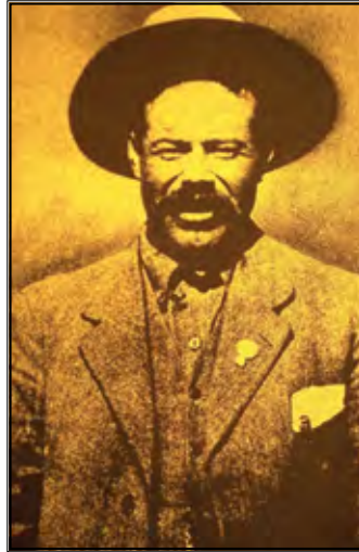
Pancho Villa (1878.-1923.)