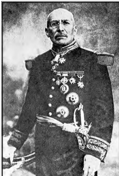
Victoriano Huerta (1850.-1916.)