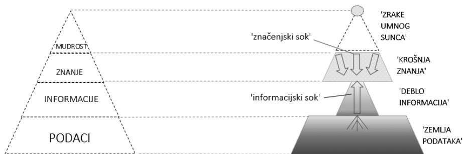
Slika 3. Dinamična inačica DIKW-hijerarhije – DIKW-stablo ili „stablo znanja“.

Sloj mudrosti u statičnoj slici DIKW-modela pretvorio se u „umno sunce“ dinamičnog DIKW-modela odgovorno za stvaranje još jednoga gradivnog elementa nužnog za rast znanja – „značenjskog soka“. Informatijski i značenjski sok u metaforičnom smislu tako predstavljaju jedinu energiju koja ulazi u sustav „stabla znanja“ omogućujući njegov rast. Ta metaforična slika (i simbol), osim što ukazuje na činjenicu da informacija i značenje ne mogu biti jedan te isti fenomen, čini informaciju vidljivom u cijelom procesu stjecanja znanja, što je u stvarnosti teško ostvariti. Iako subjektivna, jer se nalazi unutar „stabla znanja“, informacija u sebi može nositi i nešto objektivno. 81 Nemetaforičnim jezikom rečeno, premda se jedino može percipirati kao unaprijed kodirana (u prijenosu) i sa značenjem (ugrađena u strukturu znanja), informacija nas na svoj način informira o onome što dolazi izvan našeg kognitivnog sustava.