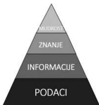
Slika 1. DIKW-hijerarhija u svom najjednostavnijem obliku.

Neki autori DIKW-hijerarhiju predstavljaju u drukčijem obliku. N. Shedroff prikazuje ju u obliku krugova koji se međusobno preklapaju 6 , dok ju D. Clark zamišlja u koordinatnom sustavu (slika 2). 7 Apcisa „Clarkova koordinatnog sustava“ jest razumijevanje , a ordinata kontekst ; krugovi konceptata nižu se se jedan iznad drugoga, s tim da su konceptu podataka, koji vremenski prethodi ostalima, dodijeljene najmanje „vrijednosti“ razumijevanja i konteksta , a mudrosti pak najviše. Dakle prema D. Clarku podaci su najmanje razumljivi te se nalaze izvan svakog konteksta, dok se ostali koncepti DIKW-hijerarhije za vrijeme procesiranja „zaodijevaju“ sve većom razumljivošću i kontekstualnošću. 8