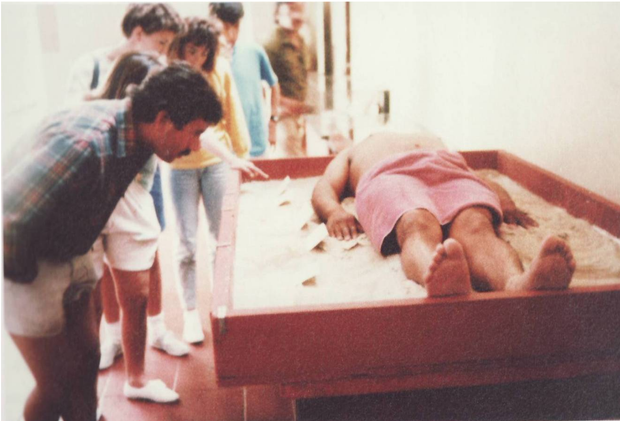
Figure 4: James Luna: The Artcraft Piece – 1987. (Luna, 2005:15)

Skrenuvši pozornost na sebe kao artefakt, Luna je jasno razotkrio vezu između institucija znanja Zapada, imperijalizma i kulture spektakla, činjenicu da gledateljeva konzumacija artefaktnog d rugog odražava i održava društvene odnose moći. Ukazavši na "okliznuće između identiteta i različitosti" (Bhabha, 2002: 90), tako što je muzejskoj publici izložio samog sebe, živućeg suvremenog Indijanca, Luna je osporio formativnu snagu etnografskog nadzora. On je dakle još jednom poremetio "metonimije prisutnosti" (Bhabha, 2002: 90), i prisvojio subjektivnost nečujnog d rugog . Kako bi tema bila komična, ona mora biti približena, tumači Bahtin. Smijeh uništava svaku distancu; on ometa i djeluje "u zoni maksimalnog približavanja" (1989: 455), a likove razotkriva kao subjekte njihova vlastitog, a ne oficijelnog diskursa (Bauer 674, 680). Slično, i hibridnost ima destabilizirajući efekt tako što izvlači na vidjelo "nužnu deformaciju i premještanje svih položaja diskriminacije i dominacije" te upravlja "pogled diskriminiranog nazad prema oku moći" (Bhabha, 2002: 112). Lunina je performativna poruka proizvela upravo takav efekt. Mnogi posjetitelji izložbe bili su zbunjeni, pa i šokirani, kad su shvatili da gledaju u izloženog živućeg Indijanca koji im