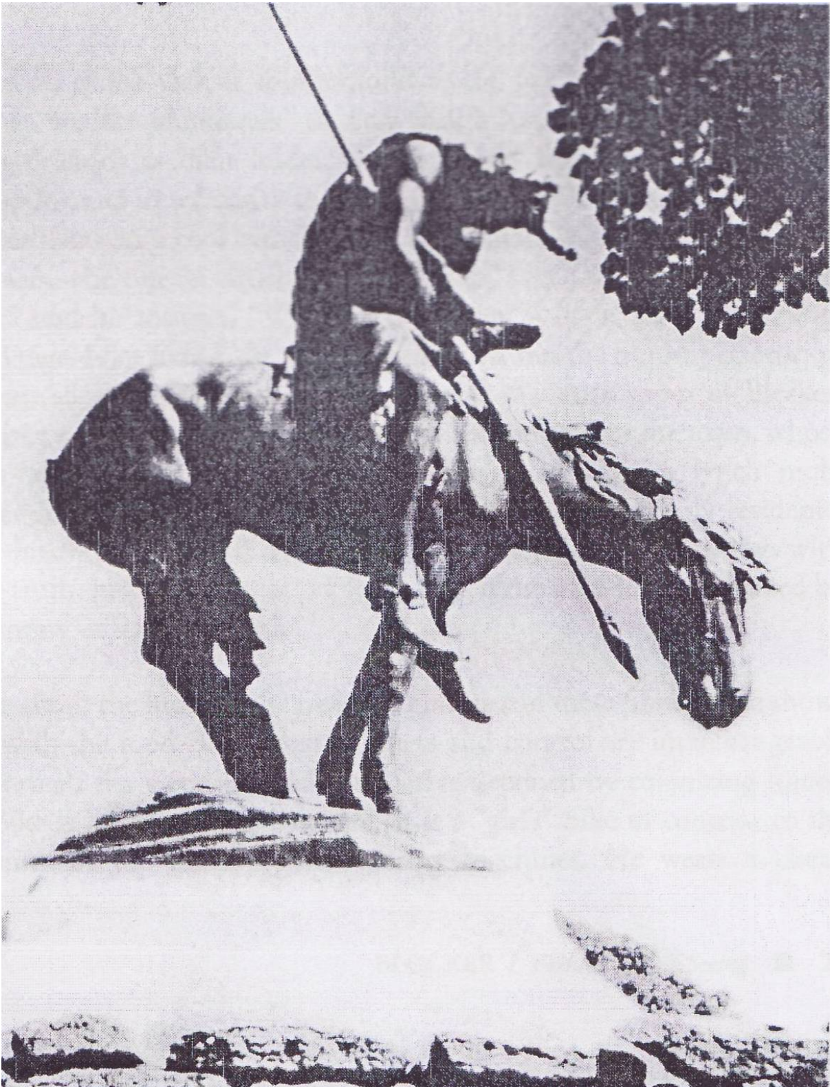
Figure 1: James Earle Fraser: The End of the Trail – 1894. (Fraser 26). [F2]