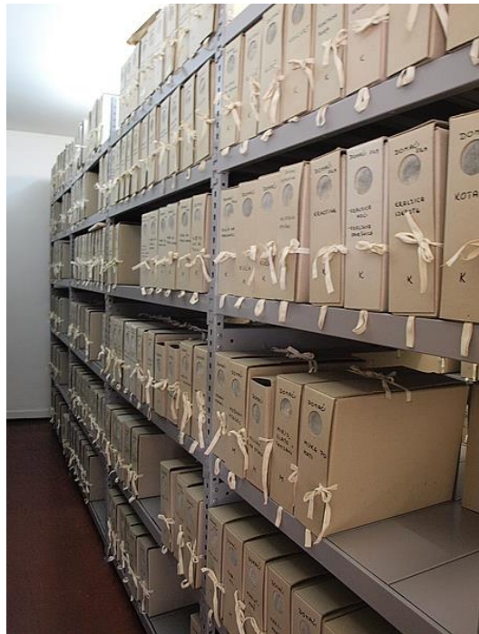
Slika 6. Popratno filmsko gradivo u spremištu HK