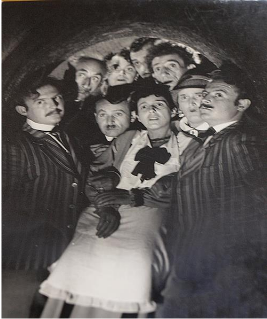
Slika 4. Iz zbirke filmskih fotografija HK: fotografija sa filmskog seta