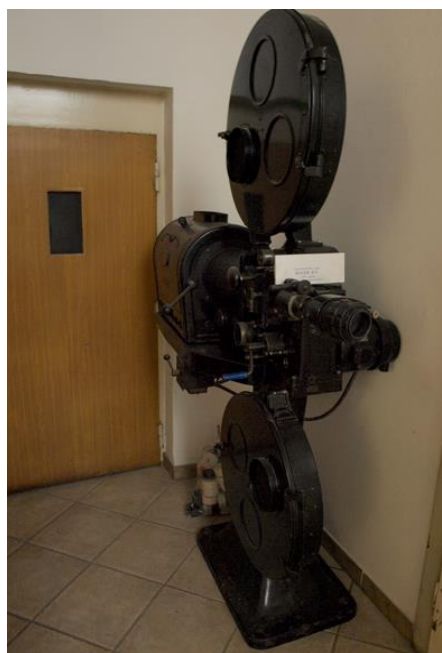
Slika 12. Filmski projektor Bauer