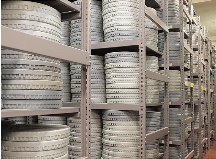
Slika 1. Izgled spremišta Hrvatske kinoteke: plastične kutije za pohranu filmskih vrpci

Kao i kad je riječ o nitratnoj vrpci, acetatnu je vrpcu također važno pregledavati i tehnički ispitati barem svake dvije godine, što uključuje i prematanje te pranje kako bi se odstranili nakupljeni plinovi i kiseli sastojci. Kada je riječ o praksi europskih filmskih arhiva, dugotrajna pohrana filmskog gradiva na triacetatnoj podlozi provodi se na temperaturi od 10 °C i RV od 40 %.