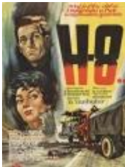
N. Tanhofer: H8..., 1958.