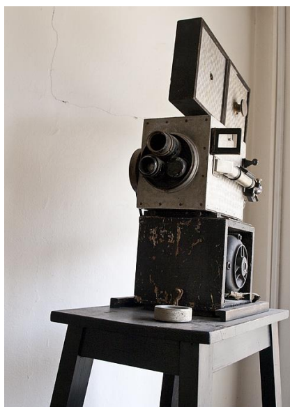
Slika 9. Filmski projektor iz Škole narodnog zdravlja Andrija Štampar