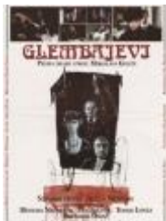
A. Vrdoljak: Glembajevi, 1988.