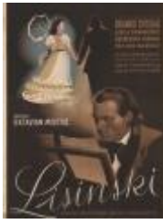
O. Miletić: Lisinski, 1944.

Izbor filmskih plakata domaćih filmova iz zbirke Hrvatske kinoteke: