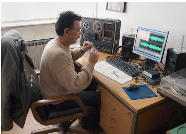
Slika 8. Preslušavanje tonских zapisa

Osim na filmsko gradivo Hrvatska kinoteka je svoju djelatnost s vremenom proširila i na zvučne zapise. Od 1999. godine surađuje s Croatia Recordsom i Hrvatskim radiom na prikupljanju, čuvanju i zaštiti fono gradiva i nosača zvuka, stoga postaje Hrvatski audiovizualni arhiv (slika 8).