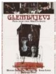
A. Vrdoljak: Glembajevi, 1988.