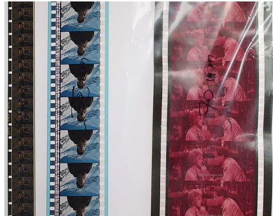
Slika 3. Usporedba formata filmskih negativa (16 mm, 35 mm i 70 mm)

Zaštita “malih“ formata najčešće se provodi povećavanjem i kopiranjem: „Zaštita filmskog gradiva na formatu 9,5 i 8 mm, budući da je riječ o preobratnim 35 kopijama filmova, najsigurnije je presnimiti spomenutim postupkom povećanja na 16 mm ili 35 mm vrpca i to na način da se izrađuju novi dublnegativi i kopije“ 36 Zahvaljujući tome što su bili dugo čuvani u obiteljskim zbirkama i malo projicirani, mnogi od filmova na formatima 8 i 9,5 mm su ostali u prilično dobrom stanju unatoč nesavršenim uvjetima kućnog “skladištenja“, strpljivo čekajući da budu ponovno otkriveni i oživljeni. Iako se presnimavanje na 16 mm vrpca navodi kao najbrži način zaštite ugroženog gradiva, zbog skupoće i složenosti ovog postupka filmski arhivi se češće odlučuju za presnimavanje amaterskih (neprofesionalnih) filmova na digitalne formate: DVD za primjenu, a za dugotrajnu pohranu na ostale formate (tvrđi disk, digitalna beta - posebna magnetna videovrpca za profesionalno snimanje elektronskom tehnikom). Tako će se sačuvati do pojave nekoga novog digitalnog formata. 37