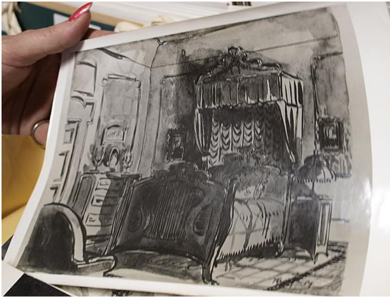
Slika 7. Primjer ručno slikane scenografije za film