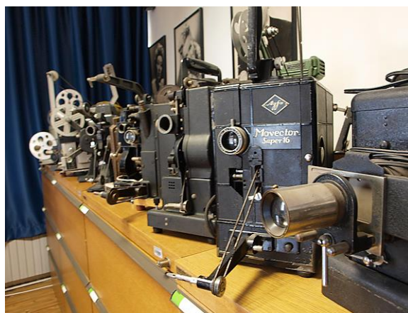
Slika 11. Dio zbirke filmske tehnike HK