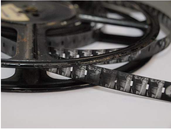
Slika 2. 16 mm filmska vrpca