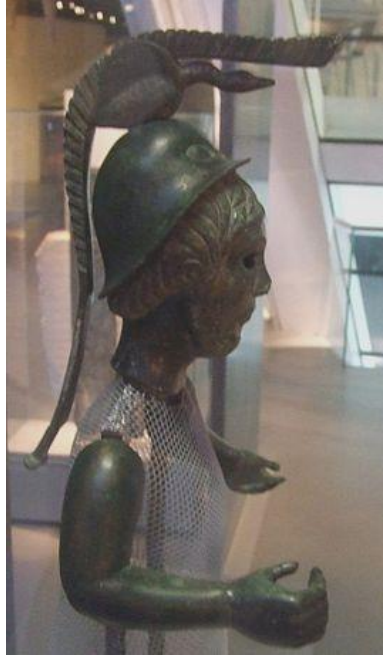
Prilog 9: Kip božice Brigid iz Rennes-a, datira iz 1. st. p. Kr., izveden iz rimske božice Minerve