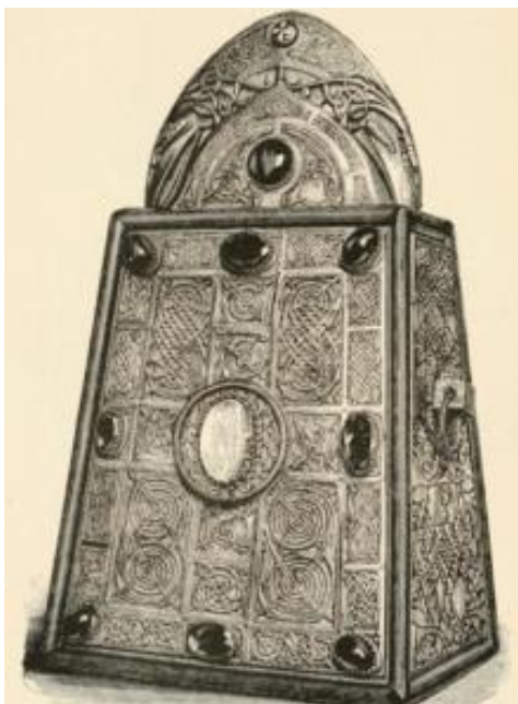
Prilog 11: Ilustracija zvona sv. Patrika, original se čuva u Nacionalnom muzeju Irske u Dublinu

Tijekom romantizma slijedi povratak starim kulturnim dobrima keltsko-germanskog podrijetla. Time su se bavili pjesnici i slikari. O tome pričaju Grimmove bajke. Još uvijek postoji – šuma iz bajki; na rubovima rijetka i kultivirana, s glavnim stablom za korištenje, hrastom, prema središtu divlja i zastrašujuća. Božićno drveće postalo je dijelom „njemačkog Božića“. Pored njega su druga stabla, koja se žrtvuju u posebnim prigodama: grana kojom se ukrašava novoizgrađena kuća, svibanjsko stablo ukrašava se u čast proljeća, grmom metlari najavljuju mlado vino ili novo pivo. No sva ta stabla ne predstavljaju više žrtveni dar kao u poganska vremena. Danas keltsko kršćanstvo, s posebnim oblicima molitve i štovanja stvorenog reda, ponovno oživljava. 40