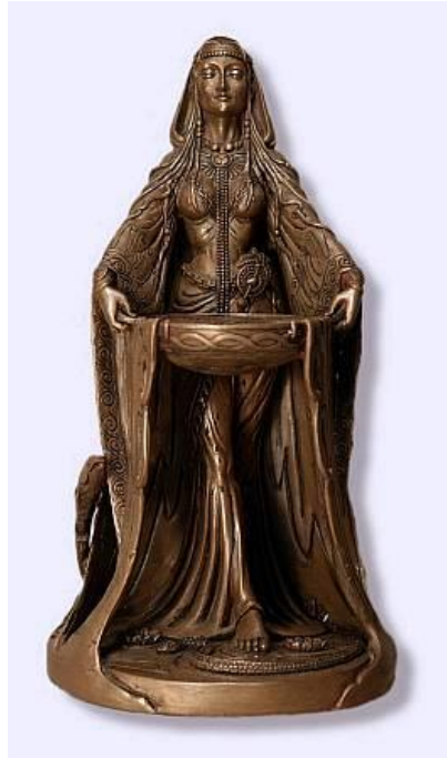
Prilog 4: Prikaz božice Danu

brkaju s dvijema drugim božicama: s najvjerojatnije njenom kćerkom Brigit i s Anu. S obzirom na trojno božanstvo, ona je zastupala majčinsku ulogu, Brigit djevicu, a Anu staricu. Brigit je među velikim irskim (keltskim) božicama kudikamo najsnažnija i najtolerantnija. O tom dovoljno govori i činjenica da je danas još vrlo omiljena među pukom. Bila je i zaštitnica umjetnosti i kulturnih dobara, što ju je u očima Grka izjednačavalo s Atenom, a kod Rimljana s Minervom. 10