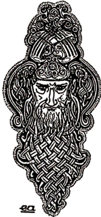
Prilog 5: Moderni prikaz boga Mananan-a

jedra ni kormilo; bojnim konjem „Aonbarrom“ moglo se putovati kopnom i vodom. Predaja ne kaže ništa o tom kako se Mananan domogao tih Lugovih darova. Pjenom okrunjeni valovi nazivani su njegovim konjima, a u kasnijim mitovima, junaku Cuchulianu je strogo zabranjeno gledati ih. Mananan je nosio ogromni ogrtač koji je mogao poprimiti bilo koju boju, a mnogi su vjerovali kako su čuli da leprša na vjetru dok bi razbješnjeli bog koračao naokolo. Otok na kojem se nalazilo njegovo prijestolje po njemu je i dobio ime. 14