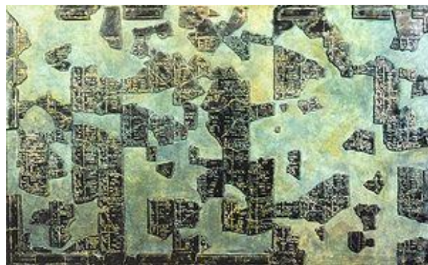
Prilog 12: Fragmenti kalendara iz Coligny-ja

Blagdani su usko vezani sa sadržajima legendi i mitova. U središtu je prije svega bilo slavljenje božica majki. Bitan sastavni dio tih svečanosti bila su žrtvovanja. Pored biljnih i životinjskih žrtava prinošene su i ljudske žrtve, i to kako kod Kelta na kontinentu tako i od strane Kelta na otocima. 43