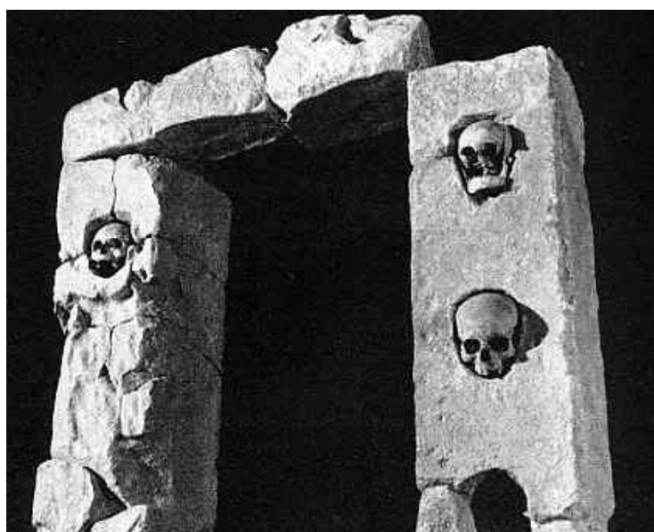
Prilog 7: Lubanje u kamenim stupovima iz Roquepertuse-a

Ljudska glava je imala značenje koje mi ne možemo potpuno shvatiti. Ona ima središnje mjesto u velikim ranim svetištima u Entremontu i Roquepertuseu, koji su puni niša za glave, a odrubljena je glava vjerojatno najrasprostranjeniji motiv keltskog slikovnog prikazivanja. Značenje kulta glave u staroj religiji nagovještava velški Mabinogion, gdje pratioci Bendigeida Vrana, odrubivši mu glavu, uživaju osamdeset sretnih godina – poznatih kao "Svečanost plemenite glave", i "nije im neugodno što umjesto Bendigeida Vrana imaju njegovu glavu." Kult predaka nagovješten je i znacima štovanja na grobnim humcima i Cezarovim naglašavanjem da se Gali pozivaju na zajedničko porijeklo od božanstva koje Cezar naziva Dis Pater, što, međutim, nigdje drugdje nije dokazano. 24