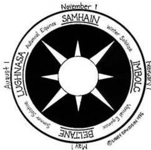
Prilog 13: Ilustracija četiri glavne keltske svetkovine

Lughnasa je proslavljana 1. kolovoza. Slavljena je u čast boga Luga. Ovdje se Keltima pružala prilika za trgovanje, zabavu te sudske i političke odluke. 48