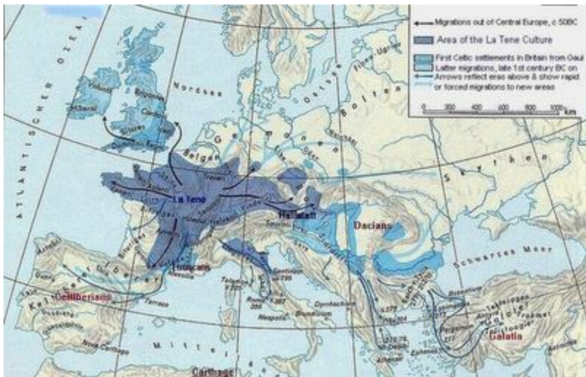
Prilog 1: Karta migracija Kelta

su naselja obrubljena masivnim nasipima ( oppida ). Nasipi su bili čvrsti jer su ih gradili kombinirajući veliko kamenje, drvene grede i zemlju ( lat. muris gallicus ), a površina zaštićenog naselja je ponekad bila impozantna. Primjerice, Masalije pokraj Ingolstadta iznosi 380 hektara. Tipična kulturna građevina Kelta je mali hram pravokutnog tlocrta, a kopali su i „obredne rovove“ ponekad i do 30 metara duboke, palili žrtvene vatre...Masovno su proizvodili staklene ukrase i cijenili mnoge alate (lončarske, tokarske, klesarske, kovačke, krznarske, itd.), proizvodeći razna dobra o čemu svjedoče očuvani kvalitetni alati i sprave. 4