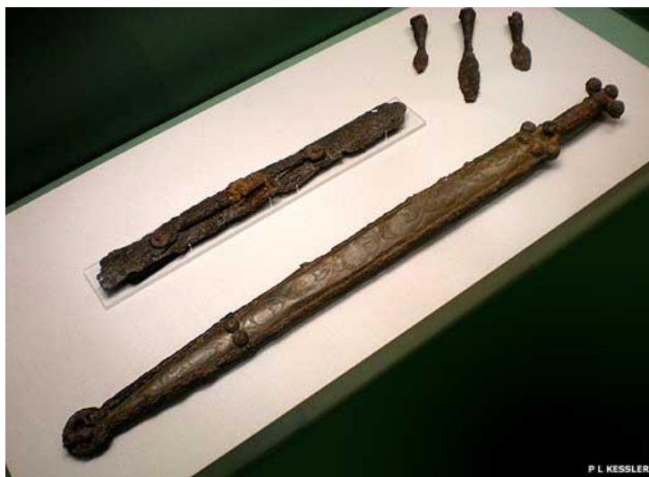
Prilog 14: Keltski mač iz istočnog Yorkshire-a, Engleska, datira se između 300. i 200. g. pr. Kr.

Među kasnolatenskim materijalom, čak i onim koji potječe iz grobnih cjelina, ističe se brojno oruđe – od raznih poljoprivrednih alata do kućanskih i obrtničkih. U kasnolatenskim grobnim inventarima javljaju se kao novost i raznovrsne posude od brončanog lima: kotlići, vjedra, kaserole, simpula sa i bez sita, plitice, i sl. Najveći broj tih nalaza importiran je iz italskih radionica. Na primjeru importiranog brončanog posuđa, moguće je pratiti trgovački put iz Italije u naše Međurječje. 57