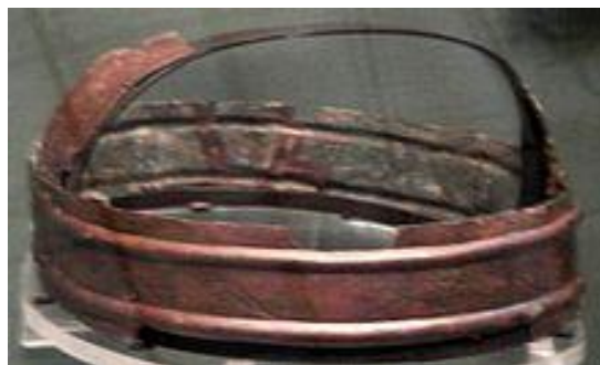
Prilog 10: Kruna ratnika iz Deal-a, Engleska, datira između 200. i 150. g. pr. Kr., a vjeruje se da su ju nosili druidi.

Svi klasični pisci bili su impresionirani druidima, keltskim svećenicima. Kad Strabon o njima govori kao o istraživačima etike, vjerojatno ih idealizira. Njihova uloga u žrtvovanju, proricanju i liturgiji ("oni koji predaju pamćenju ogromne količine poezije", kaže Cezar), bolje je dokazana. Veze keltske predaje s predajom vedske Indije zanimljiva je ali još neprovjerena mogućnost. Nakon pobjede kršćanstva u keltskim zemljama preostala su se vjerovanja promijenila, neka su lokalna božanstva poistovječena sa zlim duhovima, a neka druga, pak, sa svojim kultovima liječenja, istovremeno su, vjerojatno, sjedinjena s kršćanskim svecima. 35