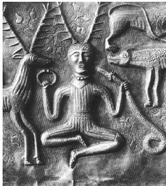
Prilog 6: Prikaz rogatog boga Cernunnos-a

Cernunnos je bio najčuvenije rogato božanstvo, ali postoje i druga božanstva koja iskazuju naklonost prema svijetu prirode, iako nemaju Cernunnosove kompleksne atribute. 19