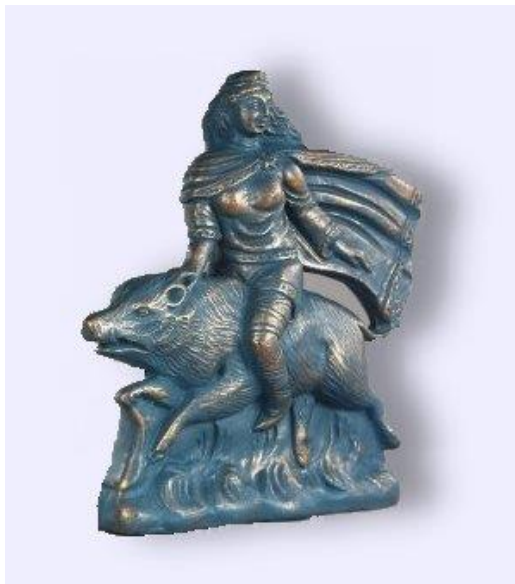
Prilog 8: Prikaz Arduinne – keltska (galska) božica šume

Osobine svetih krajolika često su bile nazivane prema lokalnim božanstvima s kojima su se povezivali. Primjerice, šuma u Ardenima na tromeđi Francuske, Belgije i Njemačke dobila je ime po božici Arduinni. I obredi su odražavali brigu o svetosti prirodnog svijeta. Sitnije žrtve, koje su prinošene kako bi se održala plodnost zemlje, polagale su se u kućanske jame za skladištenje, dok su se slobodnije žrtve ostavljale u iskopima napravljenima posebno za obrede. 25