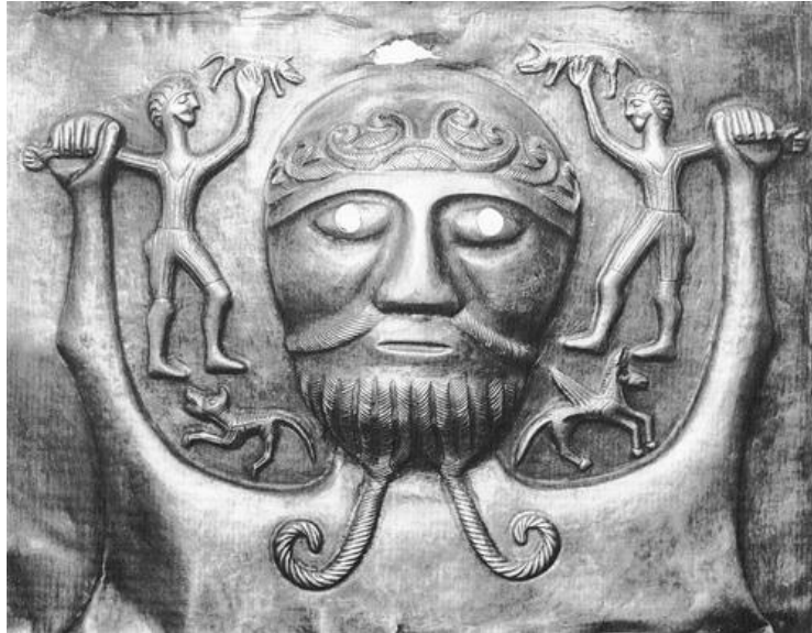
Prilog 2: Prikaz boga Dagde

Njegov opis podsjeća na vođu i boga koji istodobno figurira i kao hranitelj naroda. Opis njegove strašne vanjštine nesumnjivo je djelo njegovih sljedbenika koji su ga prikazivali što je bilo moguće strašnijim kako bi utjerali strah u kosti neprijateljskim plemenima. Usprkos razornim i smrtonosnim moćima koje su mu pripisivane, Dagda je također bio majstor glazbe i magije što je vidljivo iz priče o njegovoj znamenitoj harfi, kojom je upravljao izmjenama godišnjih doba. 7