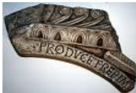
Slika 4. Trpimirov natpis

Mnogi su filolozi iznosili čvrste pretpostavke kako se i pri kristijanizaciji Hrvata zasigurno njihov jezik zapisivao latinskim slovima, barem osnovna liturgijska štiva. U korpusu