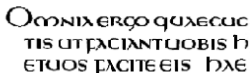
Slika 1. Latinička uncijala

„Pismo koje je slijedilo majuskulni ustroj utemeljen u kapitali i koje svjedoči blago razvijen četverolinijski ustroj (izbacivanjem „slabih“ dijelova iznad i ispod osnovnih dviju redačkih linija), osobito potaknut sve masovnijim prepisivanjem biblijske književnosti, i to ponajprije za novu knjišku formu – kodeks (sastavljenu od pergamentnih araka), bila je uncijala.“ 4 Ta se latinica oblikovala još u rimsko carsko doba, a afirmirala se tek s prepisivanjem kršćanskih tekstova i njome se intenzivno pisalo sve do 9. stoljeća. Bliža je brzom pisanju nego kapitala, ističe se debelim crtama i oblim formama jer okruglo pismo bolje pristaje kad se piše perom. Zato uncijala postaje pismo kodeksa, dok kapitala ostaje za natpise. Nakon pet stoljeća dominacije, njezini se oblici mogu prepoznati i u mlađim kodeksima u naslovima. U načelu vrijedi pravilo: što je tekst mlađi i slova su oblicima manja, rjeđe se zamjećuje probijanje osnovnih linija, a broj kraćenja i ligatura u starijim je tekstovima mali. Tim tipom latiničnog pisma pisan je Čedadski evanđelistar iz 5./6. stoljeća.