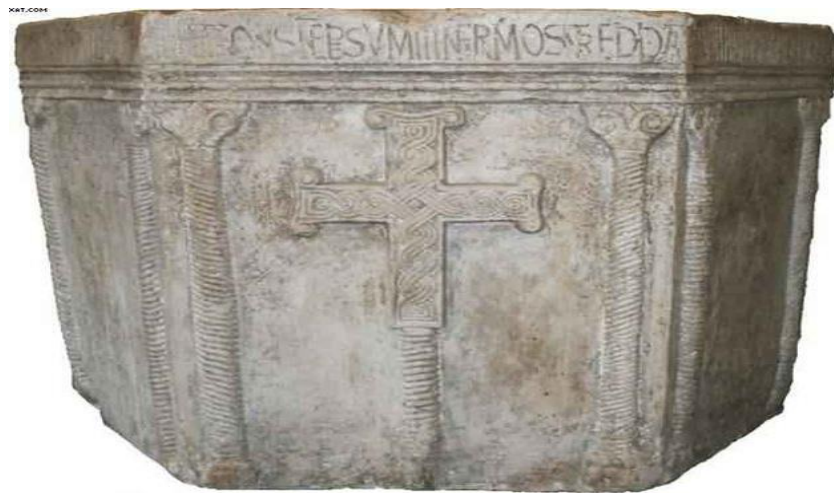
Slika 3. Krstionica kneza Višeslava

pokušaje sustavnoga korištenja latinskoga jezika, s asonancama i aliteracijama; Natpis kneza Branimira iz Muća Gornjeg datiran u 888. godinu; Nadgrobní natpis kraljice Jelene iz Solina datiran u 976. godinu koji je „vrhunski epigrafski spomenik koji svjedoči o vrlo visokoj razini latinske pismenosti u samoj zori hrvatskog življenja na ovom prostoru“ 11 ; Natpis kneza Držislava iz Kapitula kod Knina (10. stoljeće). Budući da se u to vrijeme pismenost najviše veže uz crkvu očekivano je da su svi natpisi zapravo dijelovi crkvenoga namještaja. Razina klesarske obrade slova epigrafske kapitale zadovoljava visoke kriterije, ali se ne može reći isto i za jezik, očigledno je da se zanemaruju temeljna gramatička pravila. Zapisi na pergamentu, sastavljeni u to vrijeme, sačuvani su samo u rijetkim prijepisima, npr. isprava kneza Trpimira gdje se prvi put svjedoči hrvatsko ime od samih Hrvata, i to s vladarskom titulom: dux Chroatorum.