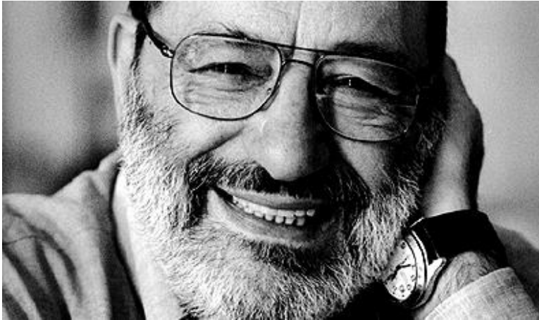
Prilog 1: Umberto Eco