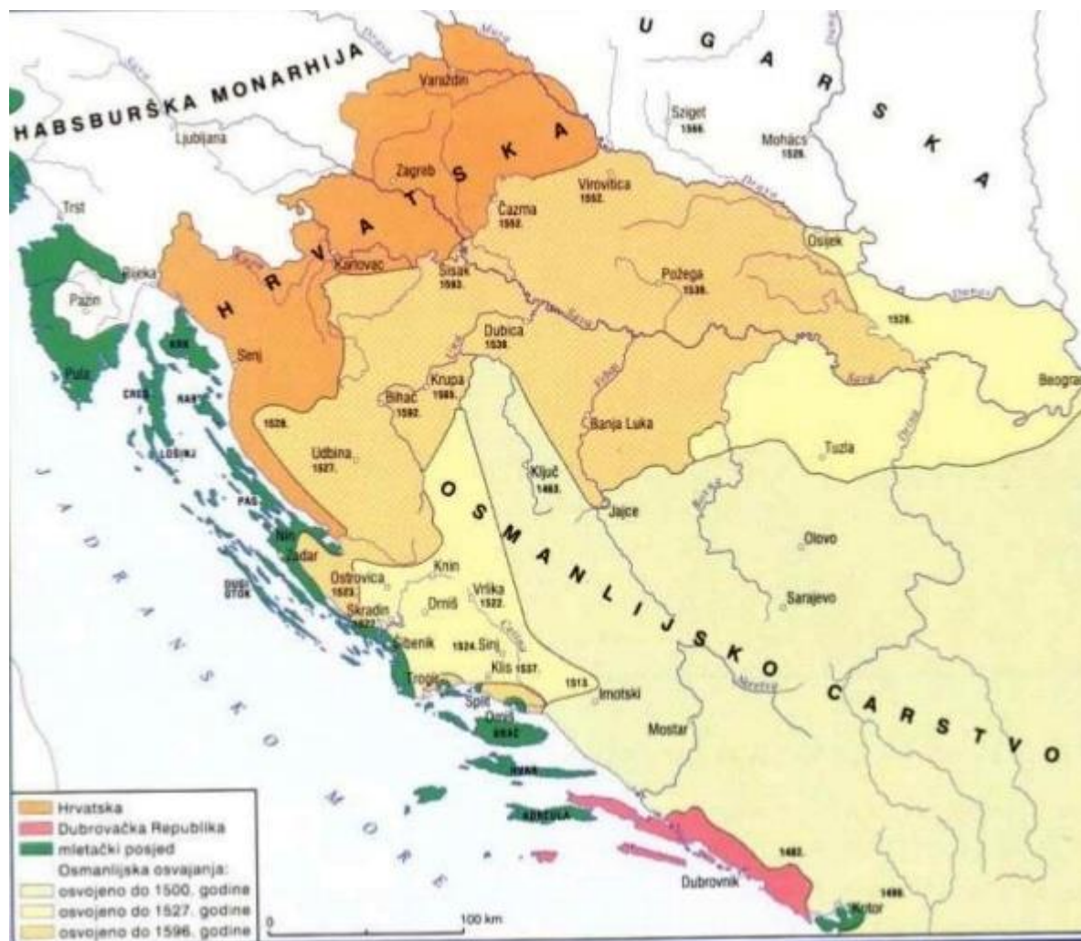
Prilog 2. Hrvatski teritorij od 1500.-1596.

kolovoza kreće preko mosta. Prelazak nije išao brzinom kakvom je sultan htio jer je most bio dosta uzak. Prelazak je završio 23. kolovoza. Grad su zapalili, opustošili, dok su sam most porušili. 122