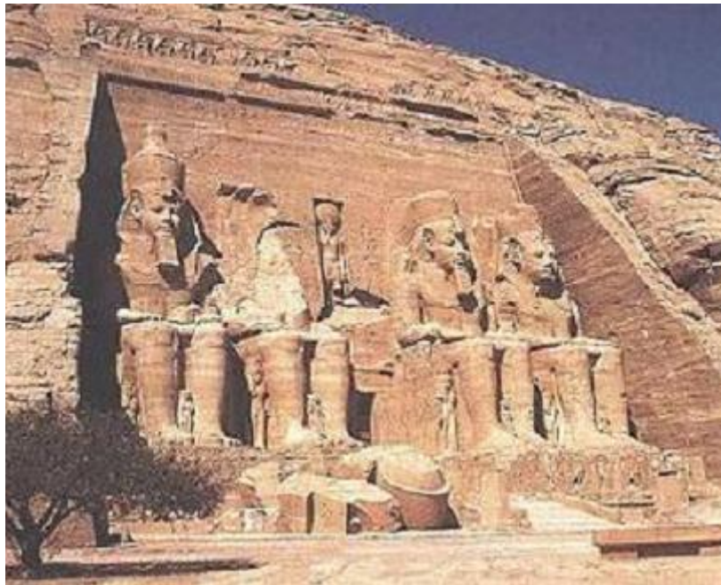
Sl. 4. Abu Simbel

Za prekretnice (21. ožujka i 23. rujna) sunce se u određene sate nalazi u posve ravnoj liniji prema hramu. Zatim se sunce pušta da polako, sasvim polako iz tame izrone božanske statue uklesane u stijenu u svetinji nad svetinjama. Pojavljuju se tako, ruku položenih na ramena, Re- Horahte, Ramzes II. i napokon Amon-Re. Samo statua boga Ptaha ostaje uronjena u tamu zagrobnog života jer ovaj bog simbolizira svijet tame. Hram najdraže faraonove žene Nefertari nalazi se stotinjak metara od velikog hrama. 26