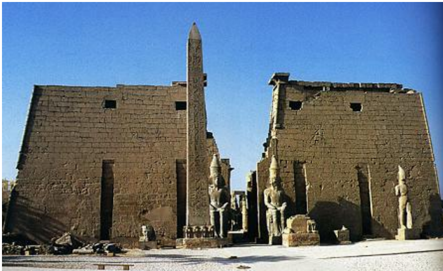
Sl 3. Ulazno pročelje hrama u Luxoru

Hram u Luxoru sagradio je Amenhotep III. ( oko 1390. – 1353. god.pr.Kr.) kao mjesto proslave godišnje svečanosti Opet tijekom koje se kralj ujedinjuje sa svojim božanskim ka (duhom) kako bi se ojačala kraljeva vladarska sposobnost. Tijekom svečanosti kulturni kip boga Amona nošen je na sjever u Luxor iz daleko većeg hrama boga Amona u Karnaku. 21