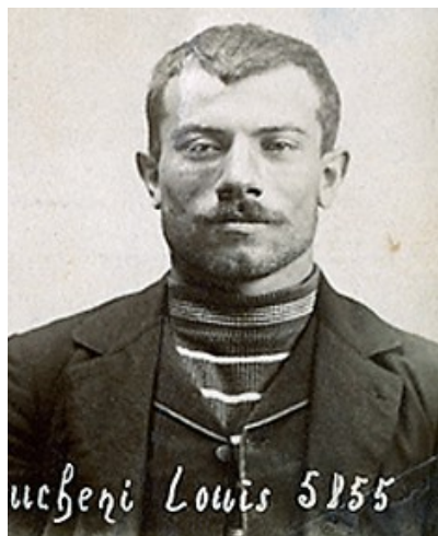
Slika 7. Luigi Lucheni (1873.-1910.), talijanski anarhist i ubojica ugarsko-hrvatske kraljice Elizabete 1898. godine.

Osječki kapucini spominju da se 10. rujna 1898. "zbio strašan zločin" kada je talijanski anarhist Luigi Luccheni ubio austrijsku caricu Elizabetu. 217