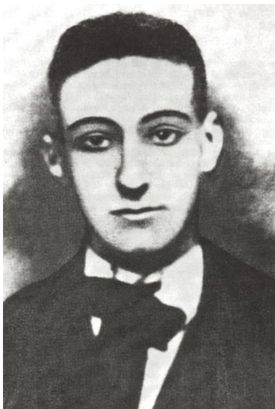
Slika 12. Janko Polić Kamov, riječki pjesnik i simpatizer anarhističke ideje.

umjetnik, anarhist, ateist, alkoholičar... Čerina ga je nazvao "glasom nezaštićenih". 300 Darko Gašparović rekao je da je Kamov bio stranac u vlastitom književno-jezičnom okružju. "Nije doista čudno da je Kamov takvim svojim pisanjem odmah izazvao kontrareakciju koja ga je faktički izbacila iz korpusa hrvatske književnosti kao strano tijelo". 301