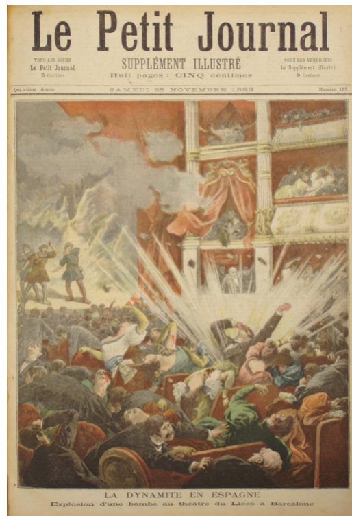
Slika 6. Naslovnica francuskih novina Le Petit Journal s ilustracijom tero rističkog napada anarhista Santiaga Salvadora u kazalištu u Barceloni (studeni, 1893. godine).

Krajem 19. i početkom 20. stoljeća izvršen je niz atentata na svjetske državnike a odgovornost za napade preuzeli su anarhisti koji su prakticirali tzv. propagandu djelom . Riječ je o zamisli da se fizičkim nasiljem usmjerenim prema političkim strukturama potakne općedruštvena revolucija. Unatoč protivljenju brojnih slobodara ovakvim metodama, anarhizam je ostao obilježen kao nasilna i nepoželjna filozofija.