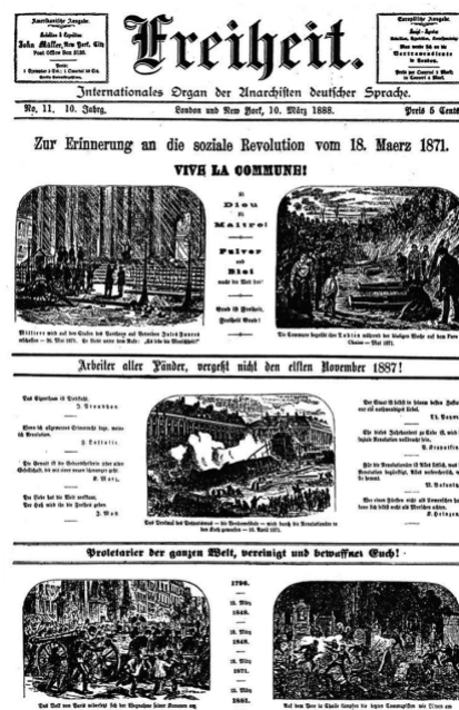
Slika 8. List Freiheit (pokrenut 1879.) kojeg je uređivao Johann Most (1846.-1906.), njemački anarhist i zagovarnik revolucionarnog terorizma. Pretpostavlja se da je kružio i među hrvatskim radništvom. Naslovnica od 10. ožujka 1888. godine.