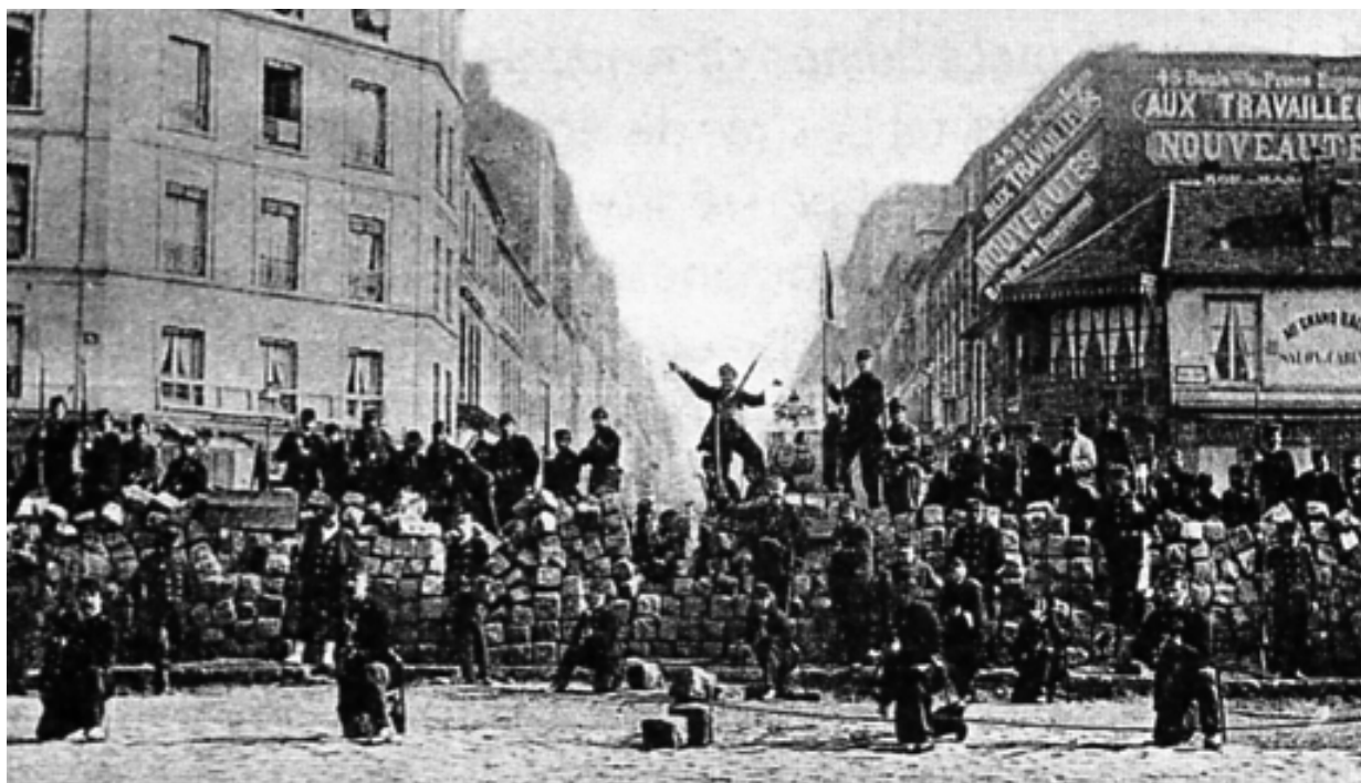
Slika 5. Barikade Pariške komune, ožujak 1871. godine.

"Revolucionarni socijalizam je upravo dao izraz svojoj prvoj i izvanrednoj manifestaciji kroz praksu Pariške komune...", napisao je Mihail Bakunjin, najgorljiviji anarhist svog vremena. 171 Uspostavljanje komune, koja se održala na životu od ožujka do svibnja 1871. godine, i danas se smatra jednim od najvećih uspjeha radničkog pokreta u vrijeme industrijske revolucije. Nakon poraza u ratu s Pruskom, nezadovoljstvo francuskog puka izmorenog ratom, nestašicom hrane i općom bijedom rezultiralo je otvorenom okretanju prema socijalističkim idejama i njihovoj primjeni u praksi. Iako je debata o ideološkom karakteru i eventualnoj budućnosti komune i dalje prisutna, neosporna je činjenica da je osnivanje kooperativnih radničkih udruženja i poduzimanje ostalih mjera za ostvarivanje socijalne jednakosti bilo nešto iznimno radikalno u tadašnjem društveno-političkom kontekstu.