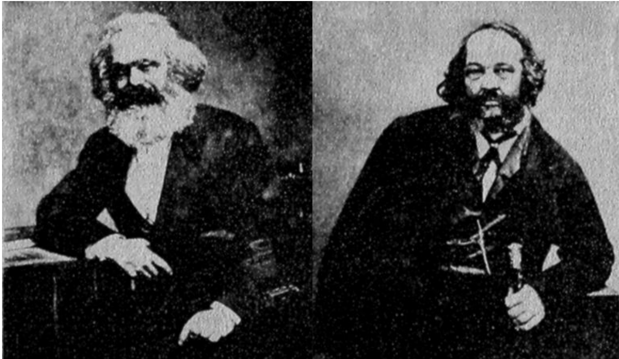
Slika 1. Karl Marx i Mihail Bakunjin - vodeće ličnosti Prve internacionale.

Na Bakunjinovu kritiku da će "vladavina učenih" biti stvarna diktatura, Marx 1874./1875. godine u tekstu Koncept Bakunjinove knjige 'Državnost i anarhija' odgovara: "Ne, dragi moj! Klasna vladavina nad slojevima staroga svijeta, koji se bore sa njima, može postojati samo dok ne bude uništena ekonomska podloga klasne egzistencije". U istom članku Marx Bakunjinove teze naziva "đačkim budalaštinama" i "političkim buncanjem", Bakunjina oslovljava s "magarče" i tvrdi da ovaj poznaje samo političke fraze te da mu je socijalna revolucija potpuno nepoznat koncept. Marx, također, izdvaja kako je volja, a ne ekonomski uvjeti, osnova za Bakunjinovu revoluciju. Na Bakunjinovo pitanje "Hoće li možda cijeli proleterijat stajati na čelu vlade?", Marx kaže s dozom cinizma: "Sačinjava li, možda, u nekom sindikatu cijeli sindikat njegov izvršni odbor? Hoće li prestati svaka podjela rada u tvornici, kao i različite funkcije koje otuda proizlaze? U Bakunjinovoj tvorevini od dolje prema gore – hoće li svi biti na visini ? Onda neće biti ničega što je dolje . Hoće li svi članovi općine u isti mah upravljati zajedničkim interesima oblasti ? Onda nema nikakve razlike između općine i oblasti ". 67