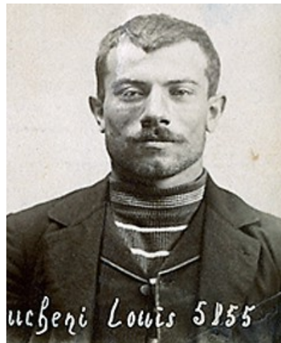
Slika 7. Luigi Luccheni (1873.-1910.), talijanski anarhist i ubojica ugarsko-hrvatske kraljice Elizabete 1898. godine.

Osječki kapucini spominju da se 10. rujna 1898. "zbio strašan zločin" kada je talijanski anarhist Luigi Luccheni ubio austrijsku caricu Elizabetu. 217