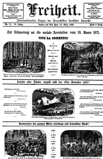
Slika 8. List Freiheit (pokrenut 1879.) kojeg je uređivao Johann Most (1846.-1906.), njemački anarhist i zagovornik revolucionarnog terorizma. Pretpostavlja se da je kružio i među hrvatskim radništvom. Naslovnica od 10. ožujka 1888. godine.