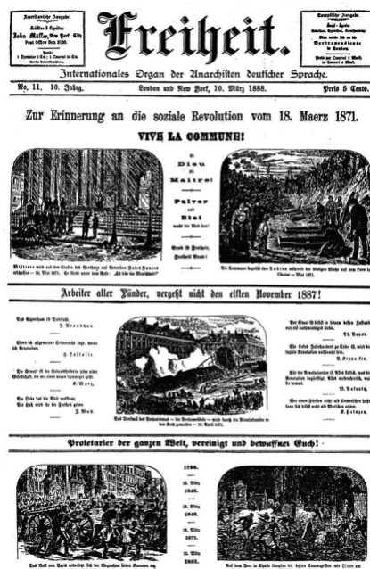
Slika 8. List Freiheit (pokrenut 1879.) kojeg je uređivao Johann Most (1846.-1906.), njemački anarhist i zagovarnik revolucionarnog terorizma. Pretpostavlja se da je kružio i među hrvatskim radništvom. Naslovnica od 10. ožujka 1888. godine.