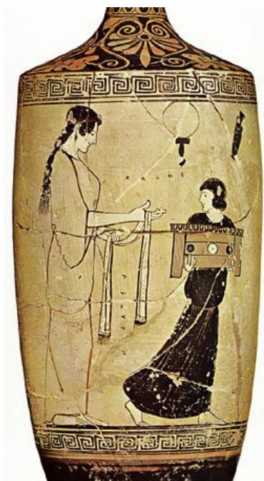
SLIKA 4, Atički lekythos, žene u svakodnevnom životu

Mnoštvo je vaza i vrčeva na kojima su sačuvane slikarije s prizorima svakodnevnog života. Tako je i mnogo prikaza žena u njihovim dnevnim poslovima, primjerice dok predu vunu ili tipične scene iz obiteljskog života. Na posudama i ostalim oslikanim predmetima često se prikazivalo muškarce i žene u interakciji, gdje su žene bile redovito bez vela, a poznato je da žene nisu izlazile nepokrivene i da na većini događanja nisu bile prisutne. Ako su te slikarije bile odraz ondašnje realnosti tko su onda te žene koje su u tako slobodnoj interakciji s muškarcima? Iako možemo pretpostaviti da su žene prikazane na vazama vjerojatno prostitutke takva objašnjenja nisu dostatna. Ponekad su to pogrebne scene ili scene vjerskih rituala na kojima su žene smjele pristustvovati. 135