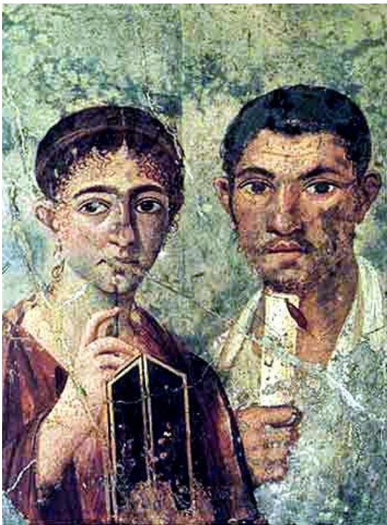
SLIKA 1, Bračni par, freska iz Herkulaneuma

noći godišnje provede odvojeno od svog muža. Žena je općenito bila tretirana nešto bolje od roba, a mogla je čak biti prodana u roblje. Bila je pod vlašću oca, a kasnije muža te nije bila zaštićena zakonom. Kasnije tijekom Carstva miraz je postao važan i pomogao je da se učvrsti ženin položaj. Bila je na neki način zaštićena, jer ukoliko bi se suprug okrenuo mladim