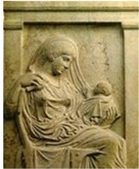
SLIKA 2. Mlada žena sa sinom, 410.g.pr.Kr.

Kontinuitet obitelji ovisio je o životnom ciklusu žene, a na porođaj se gledalo kao na vrlo opasan proces u kojemu žena riskira svoj život. Ona žrtvuje sebe u korist produžetka potomstva, moguće je kako su zato žene preminule pri porođaju bile slavljene jednako kao i junaci poginuli u bitci. Čini se kako je žena morala preminuti kako bi joj se priznala ta njezina važna uloga. Česti su bili slučajevi da žene uspješno prođu kroz porod, ali ih on toliko oslabi da su kasnije često bile bolesne i iznemogle. Bile su podložne groznicama i različitim epidemijama zbog kojih je i smrtnost bila velika. Problem je bio i u tome što je većina majki bila vrlo mlada i zbog toga su trudnoće bile rizične. Također su trudnoće bile vrlo česte, primjerice začele bi vrlo brzo nakon poroda. Nakon porođaja dijete ostaje majci na brigu. Otac je njegov skrbnik i ima vlast nad njim, ali majka je ta koja ga odgaja i njeguje. Osim toga, njoj pripomažu i druge žene koje žive u kućanstvu. 66 Primjerice, u Rimu iako su se brinule o djeci, žene nekada nisu same dojile nego su za to imale dojilje surogate, sluškinje ili