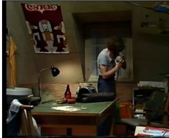
Abb. 20: Der Off-Ton