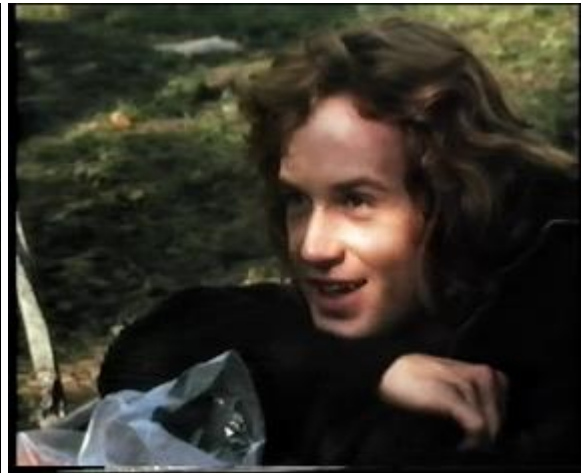
Abb. 18: Der High-Key-Stil