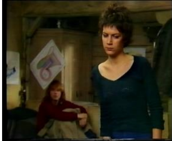
Abb. 32: Amerikanisch