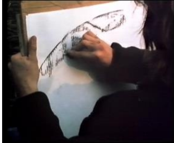
Abb. 35: Detail