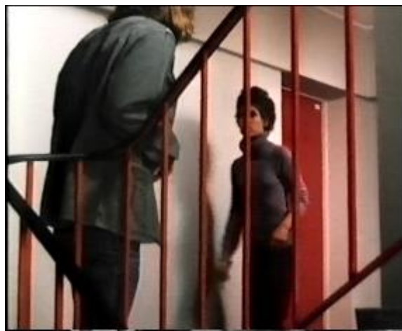
Abb. 37: Froschperspektive

Das zeigt sich im Film in der Szene, als Charlie nach einem Streit mit ihrem Mann Dieter in den Flur gerannt kommt und mit Edgar weggeht, um eine Bootsfahrt zu unternehmen.