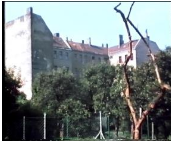
Abb. 28: Weit oder Panorama

In diesem Roman ist es die Szene, als Edgar erfährt, dass Charlies Verlobter Dieter von der Armee zurück ist.