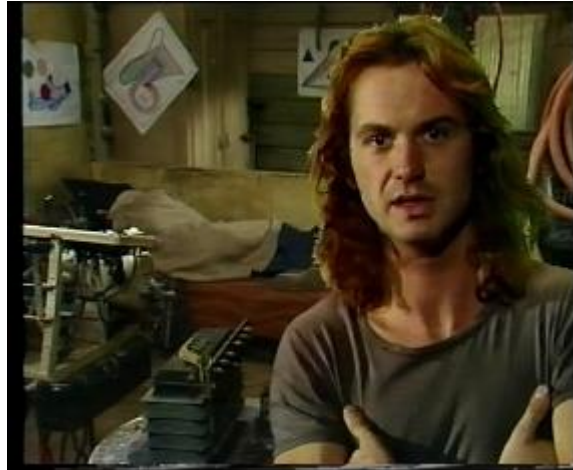
Abb. 36: Normalsicht