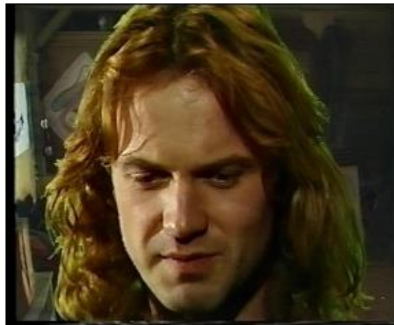
Abb. 34: Groß oder Close-Up Einstellung

Dies finden wir in der Szene, als Edgar darüber spricht, dass er sich eine Arbeit suchen sollte, aber noch nicht dazu beireit ist.