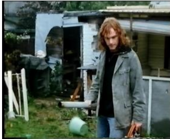
Abb. 31: Halbnah

Diese Einstellung finden wir in der Szene, als Edgar Material für seine Spritze sucht.