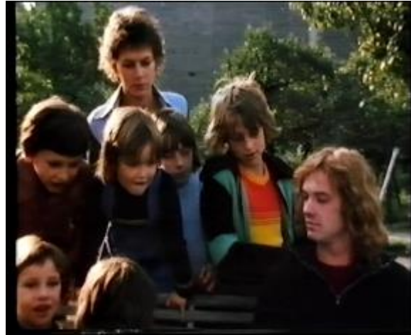
Abb. 7: Kinder aus dem Kindergarten