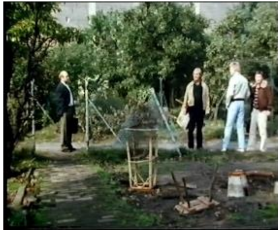
Abb. 29: Total

Dies ist im Film in der Szene zu sehen, als Addi und die Truppe Edgar besuchen kommen. Man sieht das ganze Umfeld.