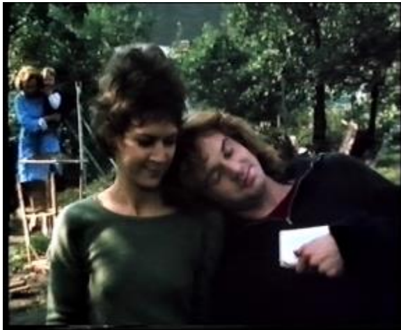
Abb. 17: Der High-Key-Stil