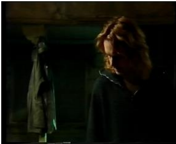
Abb. 15: Der Low-Key-Stil

Der Low-Key-Stil wird bei dramatischen Szenen eingesetzt. Er schafft sozusagen eine dramatische Atmosphäre und schafft Spannung. Ihn charakterisieren ausgedehnte, wenig- oder sogar gar nicht durchgezeichnete Schattenflächen.