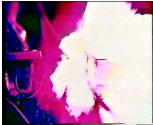
Abb. 16: Der Low-Key-Stil

Der High-Key-Stil stellt eine Stimmung der Heiterkeit, Hoffnung, Zuversicht, Glück und Problemlösbarkeit dar. Er schafft gute oder positive Stimmung durch genaue oder überdeutliche Beleuchtung. 74