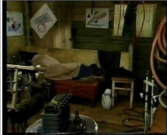
Abb. 14: Der Normalstil

Der Low-Key-Stil wird bei dramatischen Szenen eingesetzt. Er schafft sozusagen eine dramatische Atmosphäre und schafft Spannung. Ihn charakterisieren ausgedehnte, wenig- oder sogar gar nicht durchgezeichnete Schattenflächen.