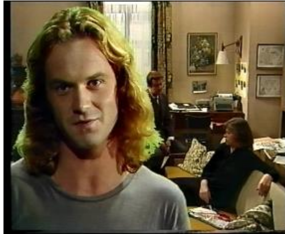
Abb. 19: Der On-Ton

Die On- und Off-Töne spielen eine sehr wichtige Rolle in der Verfilmung des Werks. Im Film finden wir viele On- und Off-Töne. On-Töne z. B. in den Dialogen zwischen einzelnen Figuren, Edgars Monologen, Tonband usw.