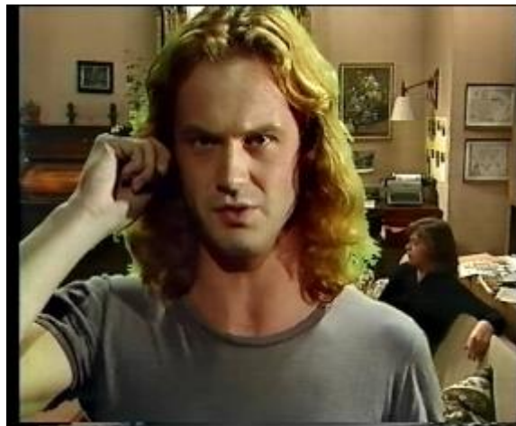
Abb. 40: Grundform II

Grundform II: Hier liegt die Handlung der beiden Figuren oder Personen im Film auf der selben Achse wie die Blickrichtung der Kamera. Diese Form wird oft im Fernsehen eingesetzt, wo der Sprecher der Nachrichten z. B. direkt auf die Kameraachse spricht und den Zuschauer dadurch direkt anspricht und ihn auffordert, genau hinzuhören und sich auf das vom Reporter oder Sprecher Gesagte zu konzentrieren. 98