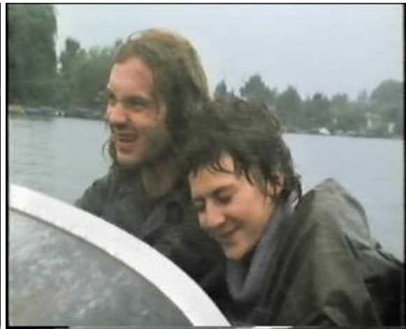
Abb. 22: Die Bootsfahrt