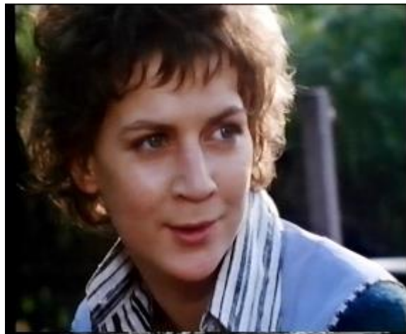
Abb. 33: Nah oder Head and Shoulder

Diese Einstellung finden wir in der Szene, als Charlie und Edgar auf der Bank miteinander reden und sich das erste Mal sehen und kennenlernen.