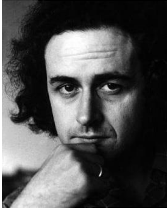
Abb. 1 – Ulrich Plenzdorf