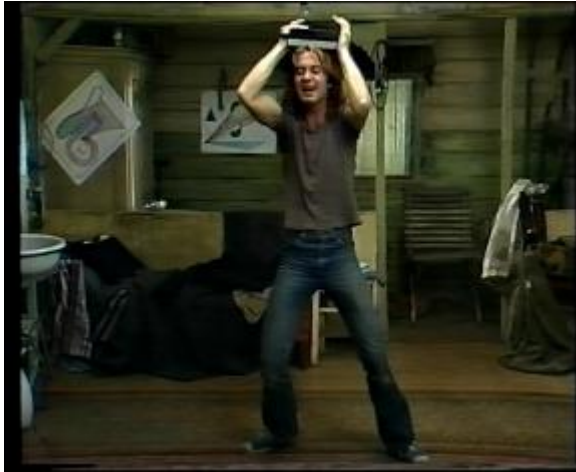
Abb. 13: Der Normalstil