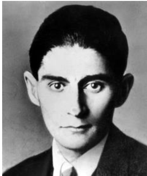
Prilog 1: Franz Kafka

Franz Kafka rodio se u središtu Praga 3. srpnja 1883. godine. U dobi od šest godina, 16. rujna 1889. godine, Franz je napustio svoje samotničko okruženje i krenuo u svijet obrazovanja. 3 Kafku je uvijek odlikovala oštromna politička svijest, simpatija za žrtve društvene nepravde i nepovjerenje prema moćnicima. Živeći u vrijeme češke borbe za odcjepljenje od konzervativnog carstva, kojim se upravljalo iz Beča, Kafka je bio više nego svjestan toga što je bilo u igri. Njegovo je vrijeme u Pragu bilo okarakterizirano kao vrijeme tranzicije i pobune, kada pod nogama nema čvrstog tla, vrijeme bez sadašnjosti i bez povezanosti. Desetogodišnji Kafka krenuo je 20. rujna 1893. godine u Starogradsku njemačku gimnaziju. 1896. godine, iako slabo prakticirajući židovsku vjeru, Franz je prošao obred bar micve. 4