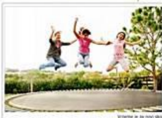
Virginita je sa novih škola

© 12/01/2014 Pozdravi iz srednje Pozdravi iz srednje admin