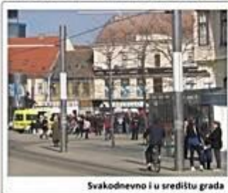
Svakodnevno i u središtu grada

© 05/09/2013 Pozdravi iz srednje Pozdravi iz srednje admin