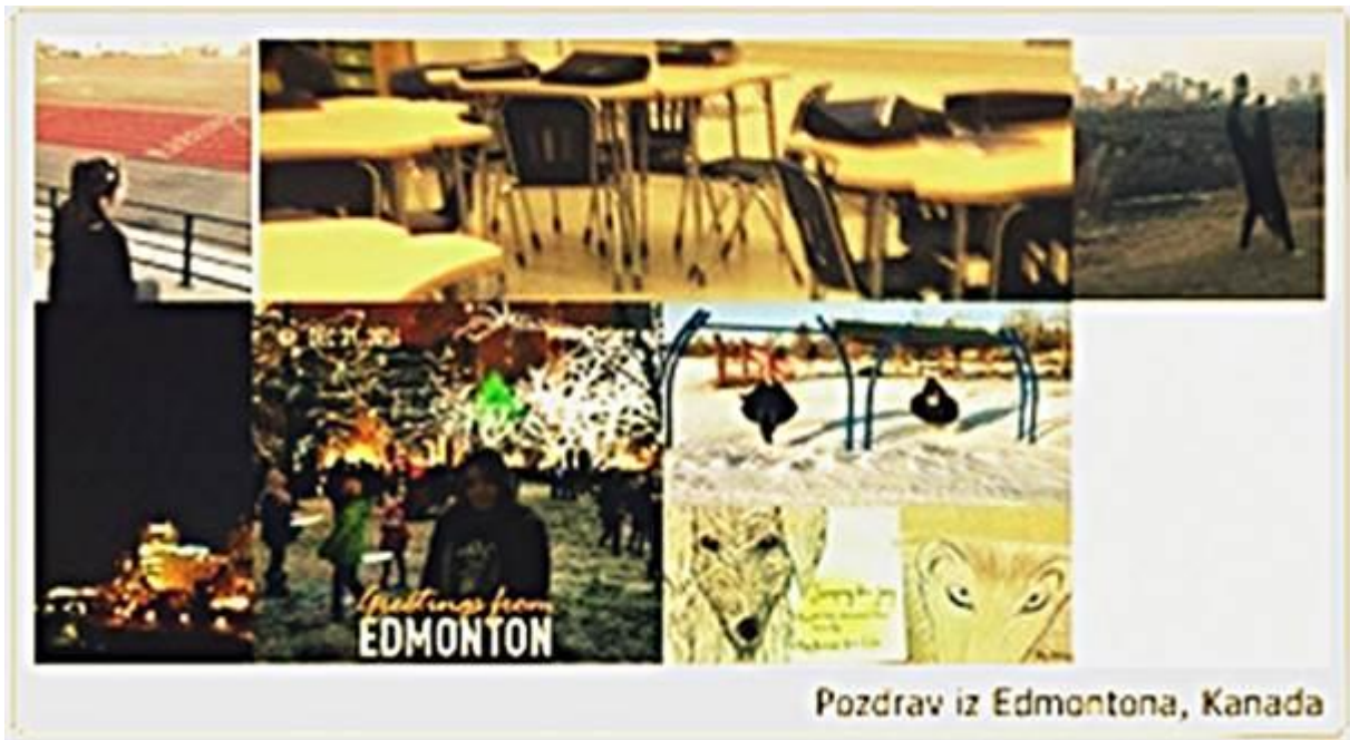
Pozdrav iz Edmontona, Kanada