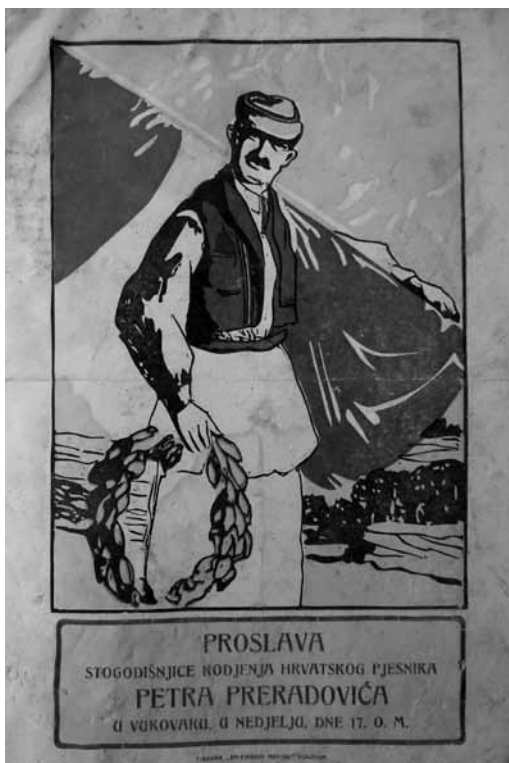
Prilog 10. Oglašavanje proslave stogodišnjice rođenja Petra Preradovića, 1928. godina