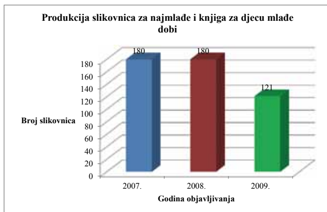
Grafički prikaz 1. Broj naslova slikovnica za najmlađe i knjiga za djecu mlađe dobi izdanih u Hrvatskoj 2007.-2009. godine

Indeks slaganja nakladnika i knjižničara u procjeni dobi kojoj je slikovnica namijenjena