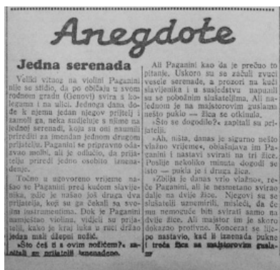
Slika 7. Rubrika Anekdote u „Hrvatskom listu“, izdanje od 13. prosinca 1936.

Početak 1941. godine naslovnice počinju odražavati tmurniju atmosferu. Svakodnevno se objavljuju vijesti o ratnim događajima i odlukama vođa. No rat nije prouzročio mijenjanje rubrika, ratni se događaji svode u postojeće (Prvi je svjetski rat u ranije analiziranim novinama stekao vlastitu rubriku, pa se ovdje može govoriti o neovisnosti rubrika čak i o iznimno turbulentnim i trajnim događajima). Zabavne rubrike opstaju, a dodaju se i nove: mala rubrika Prije 25 godina donosi vijesti iz drugih novina otprije 25 godina; Radio daje frekvencije za domaće i inozemne stanice; rubrika Za zabavu i razonodu prilog je s križaljka, vicevima i sl., nova je zabavna rubrika i Ulična prislušivanja Petera Franje . Niz je povremenih regionalnih rubrika: Novosti iz Vinkovaca , Novosti iz Vukovara , Novosti iz Slavonskog Broda , Vijesti iz bosanske Hrvatske i sl. Roman u nastavcima izlazi neometano. Nedjeljom se pojavljuju dodatni sadržaji iste naravi, npr. Iz riznice uma (poslovice i mudrosti), Za naše majke i djecu (savjeti o dječjim bolestima, higijeni itd.). Dječji Hrvatski list sada izlazi pod nazivom Hrvatski list za mladež .