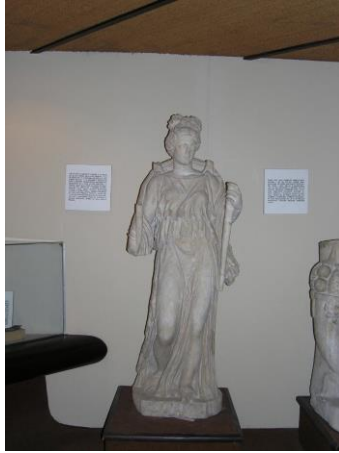
Prilog 6: ostaci kipa božice Dijane s Garduna

Imala je svetišta u svetome gaju u Nemi, na gori Tifati kod Kapue i u Ariciji. Kao svetište Latinskog saveza podignut joj je hram na Aventinu u Rimu, koji je navodno bio pod zaštitom kralja Servija Tulija. Glavno slavlje održavalo se 13. kolovoza. 30