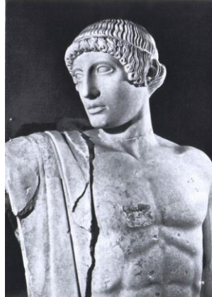
Prilog 7: kip Apolona

Jedino je Apolon zadržao svoje grčko ime jer je pod tim imenom u Rimu već bio prihvaćen. To je značilo gotovo potpuno napuštanje i zaborav izvornih priroda i uloga ranih rimskih božanstava. 33