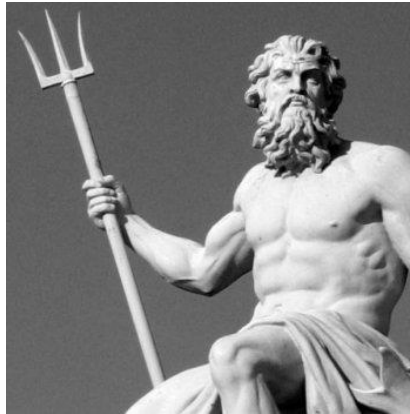
Prilog 10: Neptun

U Flaminijevu cirkusu bio je podignut žrtvenik posvećen Neptunu kao stvoritelju konja i zaštitniku konjskih utrka. Kult Neptuna kao boga mora održao se u cijelom rimskom Sredozemlju još dugo nakon pobjede kršćanstva, a njegovi ostaci žive i danas u nizu folklornih navika. 47