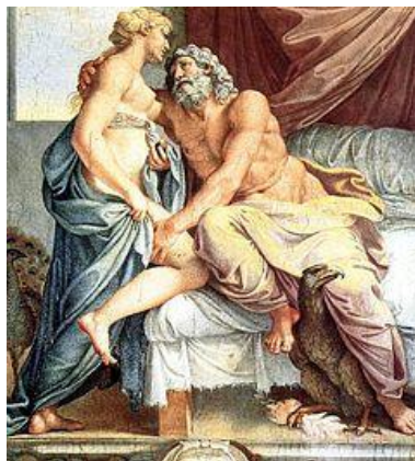
Prilog 2: Carracci: Jupiter i Junona, prikazani u zagrljaju

Junona je žensko božanstvo, koje odgovara Jupiteru. Zato je i ona božica neba, ali više noćnog neba i Mjeseca koji ga obasjava. Junona, koju su kasnije po grčkom uzoru smatrali Jupiterovom ženom, posala je i božica braka i bračnog života žena. Kako je bila i zaštitnica države, dobila je kasnije naziv Mater i Regina. 16