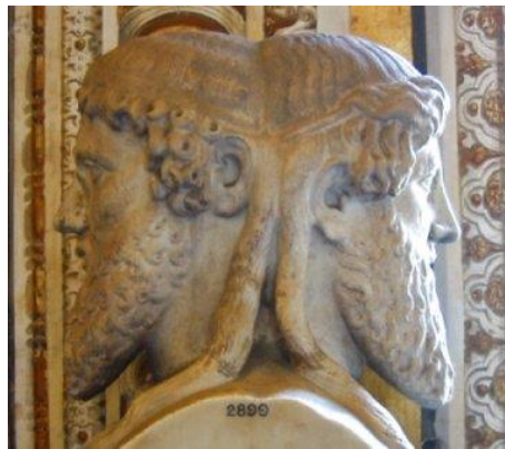
Prilog 12: Jan

Prvobitno je prema predaji, bio kralj u Laciju i utemeljio grad na jednom od sedam brežuljaka uz rijeku Tiber, na kojima se zatim razvio Rim. Taj je brežuljak dobio ime Janikulum. Ništa se pouzdano ne zna o njegovim prvobitnim božanskim funkcijama. Možda je u staroj rimskoj religiji bio bog svjetla i Sunca, a zacijelo je, prije nego je postao bogom početaka, bio bog-zaštitnik kućnih vrata. 52