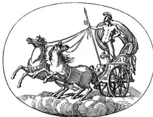
Prilog 4: Mars

Mars je italsko poljodjelsko božanstvo koje je u Rimu postalo bog rata, te je uz Jupitera i Kvirina jedan od najvažnijih rimskih bogova uopće. Mars je uzeo Rim, koji je težio za svjetskom vlašću, pod svoju zaštitu i priskrbio mu mnoge pobjede. Za Rimljane je imao veliko značenje, budući da je s vestalkom Reom Silvijom imao blizance Romula i Rema i tako bio praotac Rimljana. Za njegov kult se brinuo svećenički kolegij salijaca. Svečanosti u čast boga Marsa održavale su se u ožujku, koji je po njemu dobio ime mart, i mjesecu listopadu. Bile su to svečanosti s oružjem i procesijama. 22