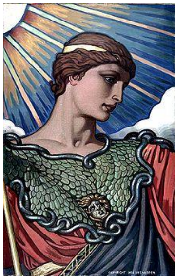
Prilog 3: Minervina glava, Elihu Vedder, 1896.

Kako je Minerva bila etruščanska božica obrtničke vještine, poistovjećena je s Atenom, te su joj pridodane Atenina mudrost i ratnička vještina. Kako je Atena rođena iz Zeusove glave, Minerva je postala Jupiterova kći. Zajedno s Jupiterom i Junonom ubrajala se u trijadu kapitolskih božanstava koja su Rimljani osobito štovali kao zaštitnike grada. 19