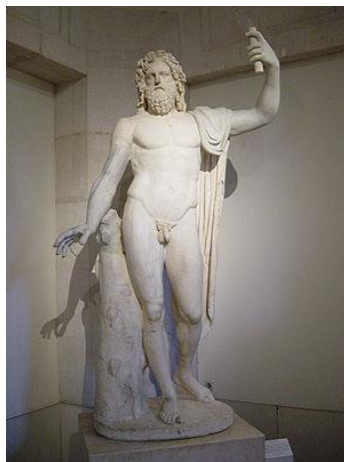
Prilog 1: Kip boga Jupitera

Jupiter ( Iupiter , od Iovis pater ) je bog neba, on s neba dijeli ljudima svjetlost, ili šalje gromove ( I. Fulgurator ) ili kišu ( I. Pluvus ). U Rimu su ga poštovali od najstarijih vremena. Njegovo glavno svetište dizalo se na Kapitolu, i upravo je tu, u tom kapitolskom hramu, Jupiter pod imenom Iuppiter Optimus Maximus bio štovan kao zaštitnik države, poštenja i zakletve, i kao davatelj pobjede. 11