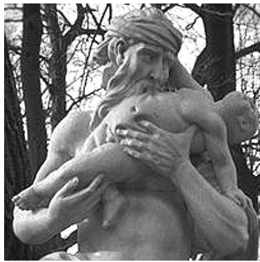
Prilog 13: Saturn

Starorimski bog seljaka i žetve bio je Jupiterov otac. Slovio je kao pravedan i prijateljski vladar Zlatnog doba. U njegovu čast su se svake godine slavile Saturnalijske, vrlo slične karnevalskom slavlju. 58