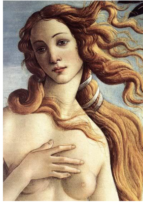
Prilog 5: Rađanje Venere, Sandro Botticelli

Podrijetlo i povijest kulta italsko-rimske božice Venere ostali su nerazjašnjeni. Ona je najkasnije u 4. st. pr. Kr. bila poistovjeđena s grčkom božicom Afroditom i od tog vremena pokazuje karakter božice majčinstva i ljubavi. Pretpostavlja se da je poistovjeđivanje Venere s Afroditom započelo u Venerinom svetištu u Eriksu na Siciliji. U rimski državni kult došla je jedno ili dva stoljeća kasnije te je, nakon apsorpiranja različitih lokalnih božanstava, postala božicom podrijetla rimskog naroda i najvažnijeg roda Julijevaca. Najviše je bila štovana u svojoj najvažnijoj funkciji kao Venus Genetrix ili Venera roditeljka. Aspekte majke zemlje i smrti imala je u obliku Venus Prosperina, u kojem je zapravo najbliža svojoj prvobitnoj pojavi. 27