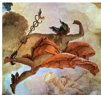
Prilog 9: Merkur

Od kraja 5. st. pr. Kr. Merkur je imao hram nedaleko od Velike arene. Na obronku Celija nalazio se njemu posvećen izvor, čijom su vodom za svečanosti u njegovu čast trgovci škropili sebe i svoju robu, ne bi li se tako očistili od ljage i olakšali teret nečiste savjesti zbog svojih prevara. 42