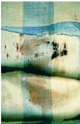
Slika 2. Oštećenje tkanine mrljama

Etnografski muzej specijalna je vrsta muzeja koja skuplja predmete na temelju etnografskog nasljeđa dok je njihova zadaća proučavanje kulture određenog naroda. U ovakvim muzejima postoje mnoge zbirke predmeta koji predstavljaju npr. alate i razne posude koje su se koristile u određenim vremenskim razdobljima te mnoge haljine i tekstilni predmeti iz raznih razdoblja u prošlosti. Upravo su ti kostimi izuzetno osjetljivi i najčešće dođe do njihovog oštećenja i to fizičkog tipa. Razlog tome je nepravilan način popravka oštećenja, napadi kukaca, pukotine, smanjenje kostima, oštećenje zbog pranja u modernim perilicama, oštećenja nastala zbog nepravilnog načina izlaganja i sl. 4 Većina ovih oštećenja dolazi zbog ljudske nepažnje i nepravilnog rukovanja, kao i lošeg skladištenja pri čemu se ne postupa pažljivo s predmetom. Npr. mnogi muzeji znaju održavati večere na kojima unajme osobe da nose povijesne kostime pomoću kojih žele oživiti to razdoblje i prikazati ga ljudima, no to bi se trebalo izbjegavati. Razlozi za to su što su to najčešće veoma stari kostimi s izuzetno osjetljivom tkaninom koja može i pri blagom napinjanju puknuti. Također može se nešto proliti po kostimu i može doći do kemijskog oštećenja (vidi sliku 2.), stoga je najbolje povijesne kostime pravilno čuvati da bi i kasnije generacije mogle vidjeti dio povijesti.