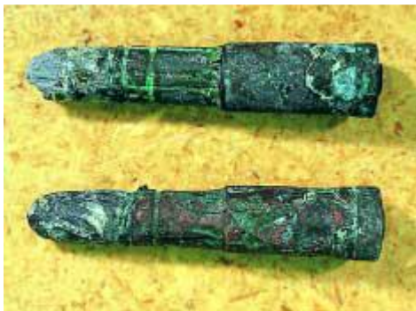
Slika 4. Prikaz utjecaja korozije (reCollections: Caring for Collections Across Australia)