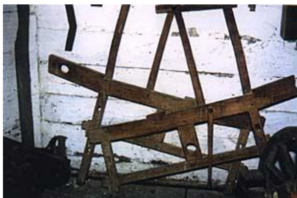
Slika 5. Prikaz dijelova uništenog tkalačkog stana ( http://www.mdc.hr/RatneStete/hr/predmet-solo.asp?brsl=353020-001-005 )

oštećenja, također tu je i kondenziranje kada voda djeluje s higroskopnim materijalom i izaziva kemijske reakcije koje pogoduju rastu različitih vrsta mikroorganizama i bakterija. 6 Još jedna od prirodnih nepogoda koja može naštetiti je vjetar koji može ovisno o snazi oslabiti nosive strukture, a ujedno čestice prašine i kamenčića nošene vjetrom mogu uzrokovati oštećenja na građevinama. Kao jedna od najrazornijih prijetnji prepoznaju se ratna razaranja, tijekom kojih cijele građevine mogu biti uništene sa svim neprocjenjivim predmetima unutar njih (vidi slika 5.). Čovjek je oduvijek bio velika prijetnja kulturnom nasljeđu i stoga ono mora biti zaštićeno od njegova štetnoga djelovanja.