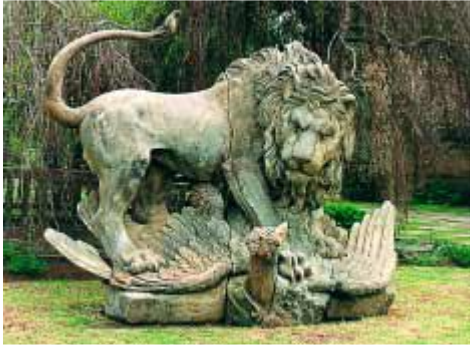
Slika 3. Prikaz pukotine nastale vremenskim djelovanjem (reCollections: Caring for Collections Across Australia)