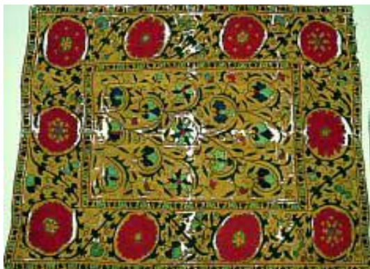
Slika 7. Prikaz oštećenog tekstilnog materijala na površini svjetlosne kutije koja omogućuje lakše uočavanje oštećenih mjesta (reCollections: Caring for Collections Across Australia)

dizanje osjetljivih materijala. U nekim slučajevima može se koristiti i tzv. svjetlosna kutija na koju se stavi tekstilni predmet i koja će detaljno prikazati koji je dio oštećen (vidi slika 7.).