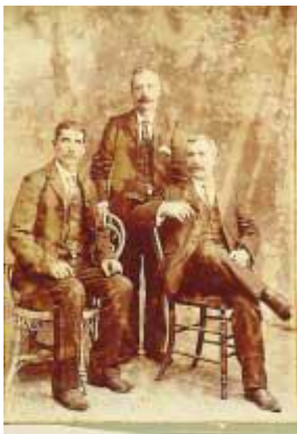
Slika 1. Prikaz gubitka detalja i blijedenja fotografije

odvajanje emulzije od papirne baze te razna kemijska oštećenja kao što su blijedenje fotografije i gubitak detalja (vidi slika 1.) požućivanje fotografije, promjena boje te razne mrlje. 2 Sve to može biti uzrokovano lošim skladištenjem i korištenjem, nepropisnim načinom izlaganja te kemijskim promjenama u samim slikama. To se lako može izbjeći pravilnim rukovanjem i prijenosom samih predmeta, a najvažnije je ako dođe do oštećenja fotografije propisno je zaštititi i potražiti savjet stručnjaka konzervatora. Druga vrsta predmeta koje nalazimo u ovakvim tipovima muzeja su slike i one su veoma osjetljive i podložne oštećenjima, bila to fizička ili kemijska oštećenja. Pod fizičkim oštećenjima smatramo pukotine i lomove, napade kukaca, deformaciju od strane prašine koja se uvuče između slojeva slike i sl. Kod kemijskih oštećenja dolazi do promjena u samim slikama i tu ubrajamo promjenu boje i blijedenje pigmenta, blijedenje laka (oboje većinom nastaje od izloženosti svjetlu i UV zračenju), može doći do propadanja određenih dijelova slike zbog loše kvalitete materijala koji su korišteni prilikom izrade te do napada plijesni. 3 Prilikom rada i prijenosa slika vrlo je važno na prikladan način rukovati s njima, a u slučaju da se naiđe na oštećenu sliku važno ju je propisno spremiti i potražiti savjet stručnjaka.