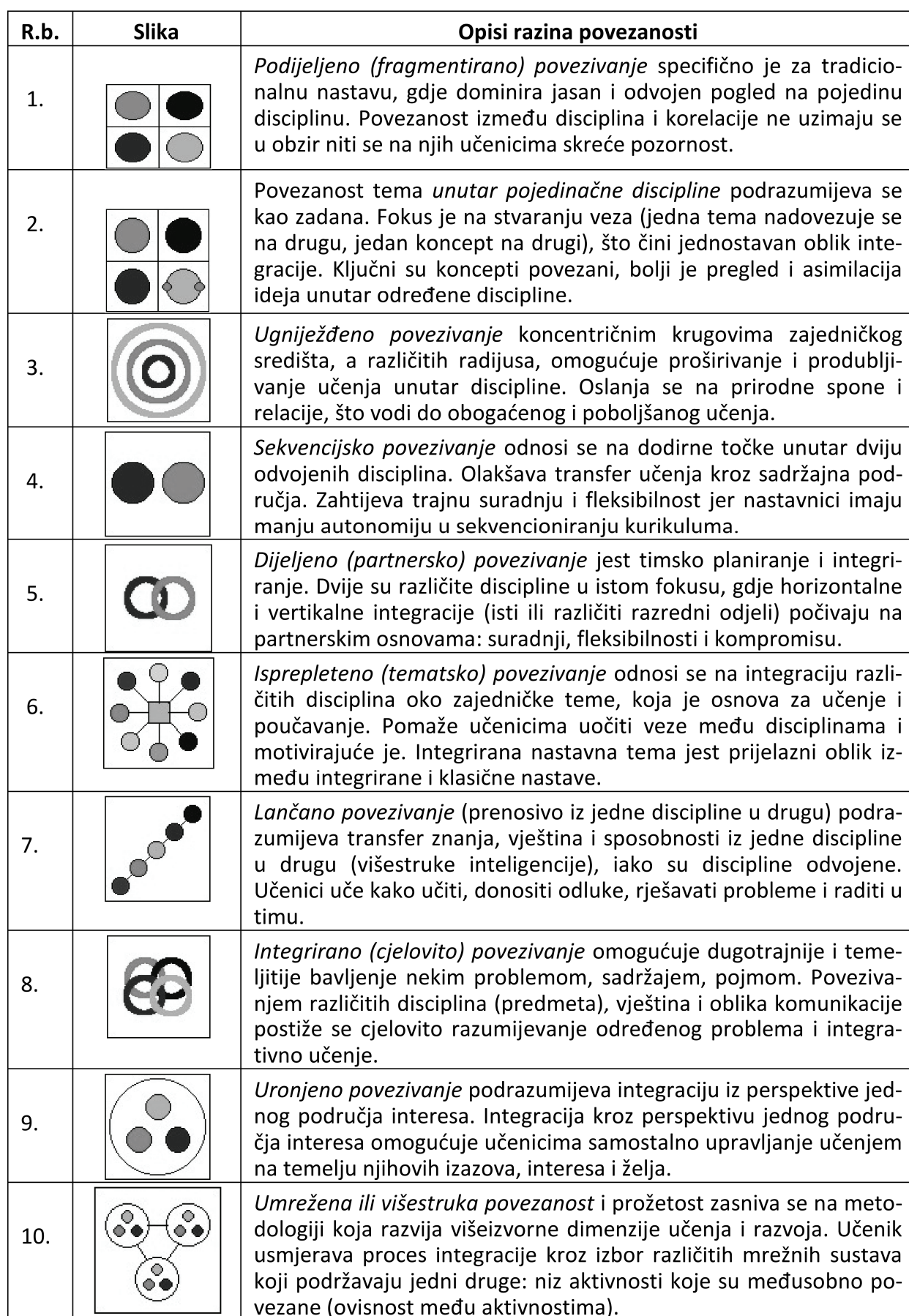
Tablica 1. Slikovni prikaz razina integriranja kurikuluma