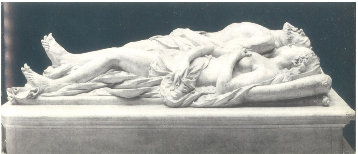
Prilog 6. Gisants Henrija II. i Katarine Medici, Germain Pilon (1563.-1570.)