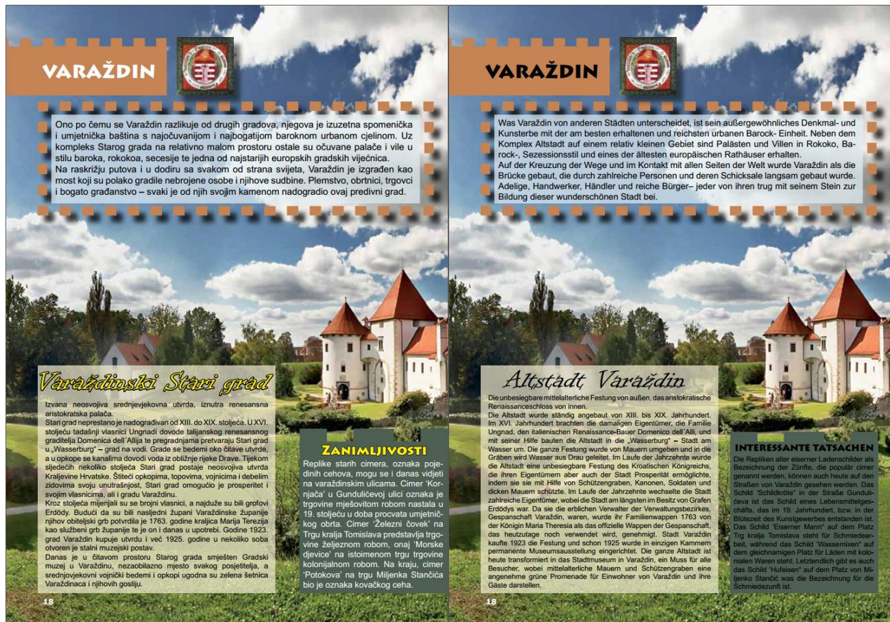
Bild 3: Beispiel der Unterschiede der Fontfarben zwischen der kroatischen Broschüre und der deutschen Übersetzung

Was die Farbe der Fonts angeht, so sind die Stadtnamen in der kroatischen Broschüre in weißer Farbe. Die Titel sind im gelben Font mit schwarzem Rand geschrieben. Der Text in den Schachteln ist dann entweder schwarz oder weiß, abhängig von der Farbe des Hintergrunds. Jedoch wird in allen Übersetzungen, so auch in der deutschen Übersetzung, die Farbe der Fonts geändert. In der Übersetzung sind die Farben der Fonts aus einem unbekanntem Grund nicht beibehalten worden. Das heißt, dass alle Titel und Texte schwarz sind, was nicht dem Quelltext entspricht. Generell stört die schwarze Farbe nicht, doch leider ist es in einigen Stellen deswegen schwer, den Titel zu lesen. In der ganzen Broschüre ist der schwarze Text in den Textschachteln von interessanten Tatsachen auch etwas schwer zu lesen, weil es wieder ein schwarzer Text auf einem dunklen Hintergrund ist. Wieso die Fonts in der Übersetzung geändert worden sind, ist nicht bekannt.