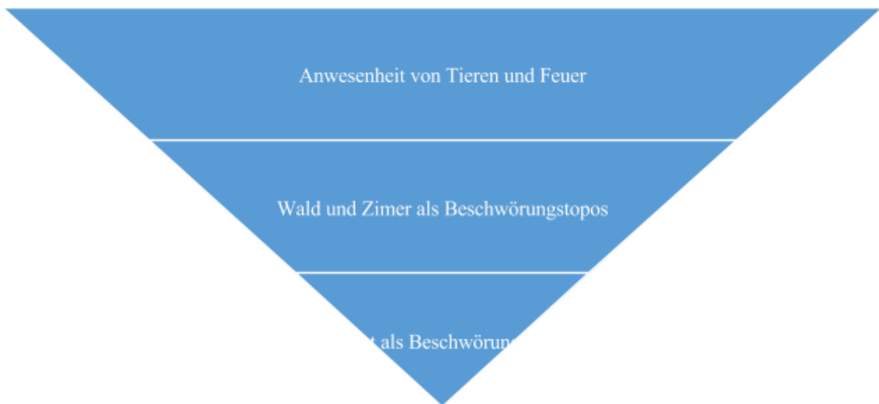
Abb. 3 Gemeinsamkeiten und Unterschiede in Bezug auf die Ausgestaltung der Teufelsbeschwörung

In der dritten Pyramide werden Unterschiede und Gemeinsamkeiten in Bezug auf den Prozess der Teufelsbeschwörungen in den einzelnen Werken dargestellt. Bei Goethe und Heine nimmt der Teufel eine Tiergestalt an: Bei Goethe erscheint der Teufel zuerst als ein Pudel, danach kommt er in Form eines Menschen vor. Heines Teufelin erscheint zuerst als ein Tiger und dann als eine Schlange. Als die Faust-Gestalten bei Spies und Schwab den Teufel beschwören, beginnt ein Feuersturm und Wagen mit Pferden fahren neben ihnen.