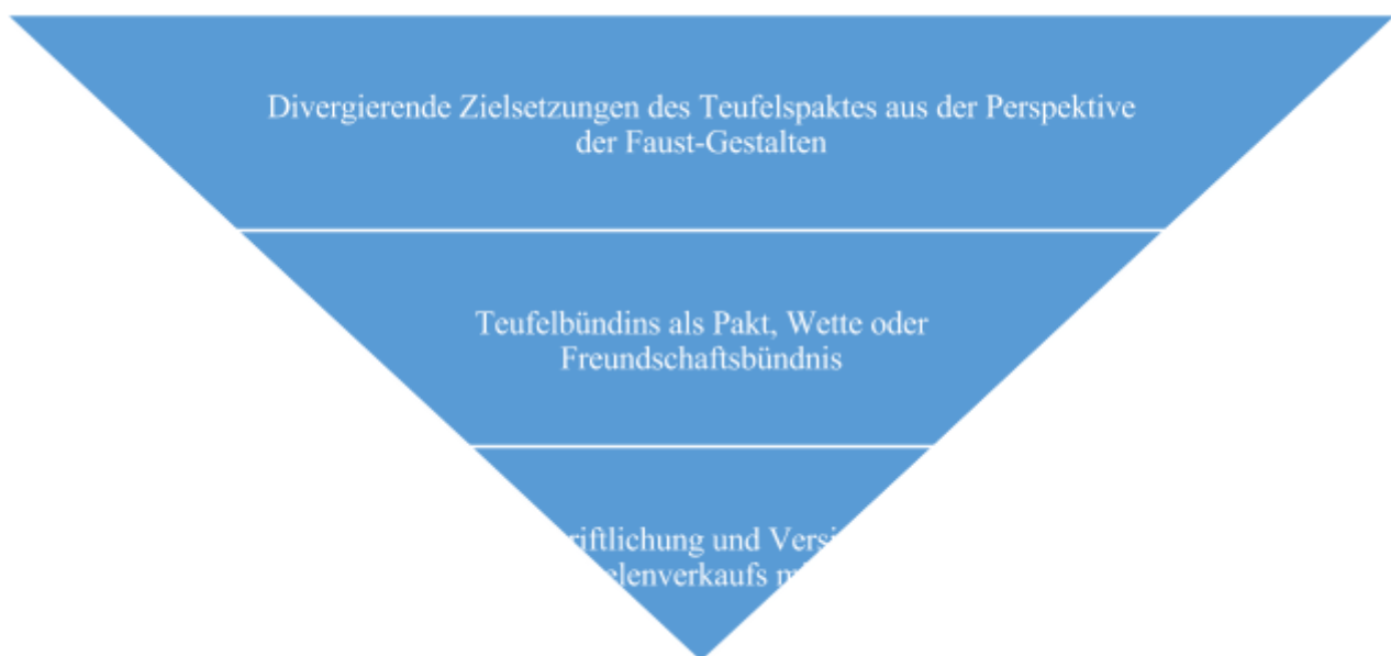
Abb. 4 Gemeinsamkeiten und Unterschiede in Bezug auf die Ausgestaltung der Form und des Inhalts des Teufelspaktes

In der vierten Pyramide werden die verschiedenen Forderungen der Faust-Gestalten als der größte Unterschied in Bezug auf den Inhalt des Teufelspaktes angeführt. Faust-Gestalten streben bei Spies, Goethe und Schwab nach irdischen und außerirdischen Genüssen und Erkenntnissen. Sie fordern von dem Teufel, dass er ihnen alle Wünsche erfüllt. Heines und Manns Faust-Gestalten sind ein bisschen bescheidener, sie fordern nur die Erfüllung der irdischen Genüssen. Als eine