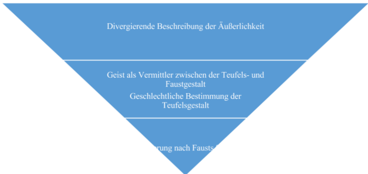
Abb. 2 Gemeinsamkeiten und Unterschiede in Bezug auf die Ausgestaltung der Teufelsgestalt

Obwohl die äußerlichen Merkmale der Teufelsgestalt in den analysierten Werken unterschiedlich beschrieben werden, haben schon diese einiges gemeinsam. So weisen die Teufelsgestalten in den Werken von Spies, Mann, Klinger und Schwab mehrere physische Ähnlichkeiten auf: Bei Spies ist der Teufel ein feuriger Mann, bei Schwab hat er einen menschlichen Kopf und einen zottigen Leib. Er hat feurigen Augen genau wie Manns und Klingers Teufel, wobei der letztere einen menschlichen Leib hat.