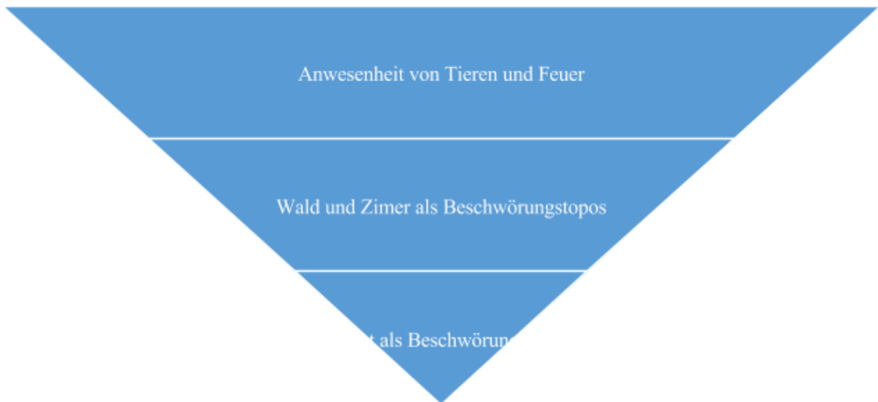
Abb. 3 Gemeinsamkeiten und Unterschiede in Bezug auf die Ausgestaltung der Teufelsbeschwörung

In der dritten Pyramide werden Unterschiede und Gemeinsamkeiten in Bezug auf den Prozess der Teufelsbeschwörungen in den einzelnen Werken dargestellt. Bei Goethe und Heine nimmt der Teufel eine Tiergestalt an: Bei Goethe erscheint der Teufel zuerst als ein Pudel, danach kommt er in Form eines Menschen vor. Heines Teufelin erscheint zuerst als ein Tiger und dann als eine Schlange. Als die Faust-Gestalten bei Spies und Schwab den Teufel beschwören, beginnt ein Feuersturm und Wagen mit Pferden fahren neben ihnen.