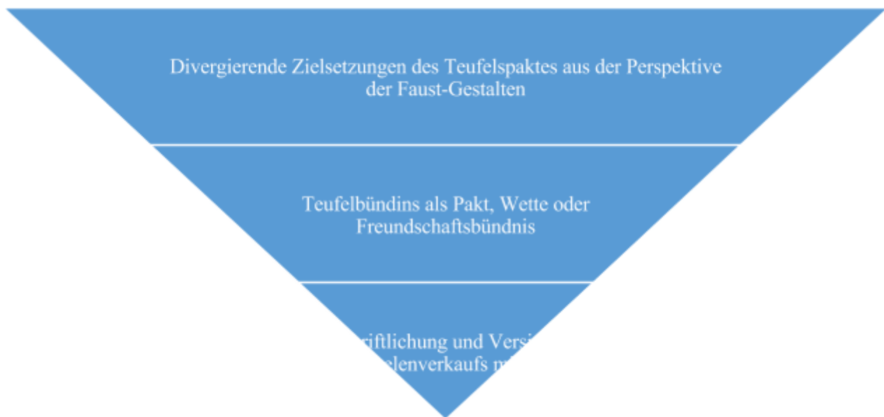
Abb. 4 Gemeinsamkeiten und Unterschiede in Bezug auf die Ausgestaltung der Form und des Inhalts des Teufelspaktes

In der vierten Pyramide werden die verschiedenen Forderungen der Faust-Gestalten als der größte Unterschied in Bezug auf den Inhalt des Teufelspaktes angeführt. Faust-Gestalten streben bei Spies, Goethe und Schwab nach irdischen und außerirdischen Genüssen und Erkenntnissen. Sie fordern von dem Teufel, dass er ihnen alle Wünsche erfüllt. Heines und Manns Faust-Gestalten sind ein bisschen bescheidener, sie fordern nur die Erfüllung der irdischen Genüssen. Als eine