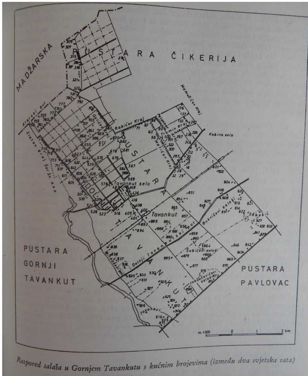
Slika 4: Karta Gornjeg Tavankuta

U Gornjem Tavankutu (vidi Sliku 4) živi oko 1400 stanovnika. Godine 1924. ondje je zgrađena kapelica Sv. Ane. Sekulić (1991) je zabilježio da ju je podigao Mate Vuković. Na tom mjestu sačuvani su i ostaci iz sarmatskog i srednjovjekovnog razdoblja (Sekulić, 1991). Većinu stanovništva čine bunjevački Hrvati.