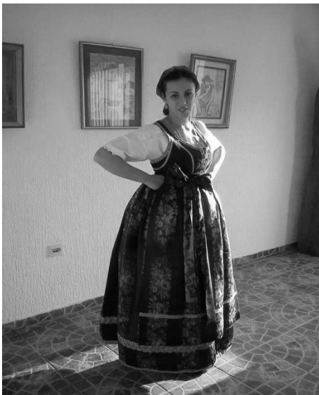
Slika 5: Djevojka u svili, bunjevačkoj narodnoj nošnji

šubara/šepica – ž. r., krzneno pokrivalo za glavu, velika krznena kapa, nose samo muškarci