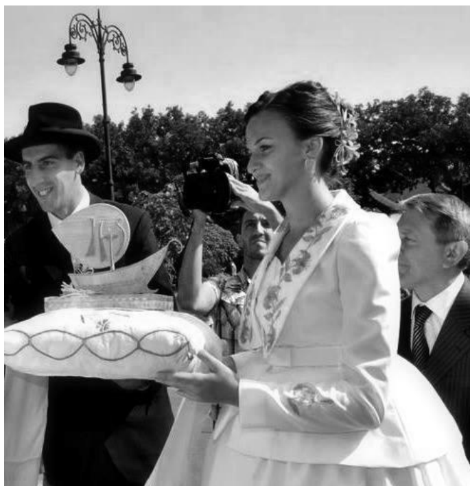
Slika 2: Bandaš i bandašica

Jedni od najstarijih bunjevačkih običaja jesu običaji pripreme za Božić. Posebno se ističu Materice , dan bunjevačkih majki koji se slavi treće nedjelje Došašća, a četvrte nedjelje slave se Oci , dan bunjevačkih očeva. Materice su »otvorenije« od Oca jer se na taj dan recitiraju brojne pjesmice i postoje ustaljeni oblici čestitanja, dok je na Oci to puno skromnije, tj. taj se dan samo obilježava kao dan očeva i nema oblika čestitanja ili posebnog darivanja kao što je to na Materice (Sekulić, 1991). Prvi dan Duhova obilježavaju »kraljice«. To je skupina od oko osam djevojaka koje su obučene u narodnu nošnju s krunama koje pridržavaju vrpčama na glavi. One obično pjevaju u crkvi, a prije su išle od kuće do kuće u određenom mjestu i pjevale (Sekulić, 1991).