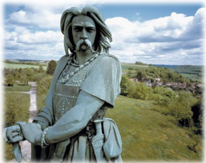
Slika 4. - Vercingetoriks

Otpor Belga, a pogotovo Eburona pod vodstvom Ambioriksa, pomogao je rasplamsavanju duha otpora u Galiji u zimi između 53. i 52. g. pr. Kr. Politička previranja u Rimu dali su Galima daljnji razlog za nadu da se mogu riješiti svojih osvajača. Velika većina Gala je sudjelovala u pokretu otpora, a rijetki su ostali na strani Rima, pa tako čak i Heduanci za koje se smatralo da su veliki saveznici Rima. Vercingetoriks je vjerovao kako je za pozitivan utjecaj na