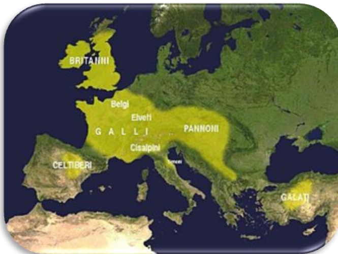
Slika 1 - Rasprostranjenost Kelta

Svi povijesni izvori koji su nam na raspolaganju su u neku ruku subjektivni, što je inače priroda povijesnih izvora ove vrste. Ali, oni nas ne spriječavaju pri karakteriziranju Kelta kao društva i pri karakteriziranju njihovog ratovanja. Najveći problemi nam dolaze radi kronologija i regionalnih varijacija pa nas generaliziranje u takvom slučaju može dovesti do krivih predodžbi i zaključaka. Dobar dio izvora se zato odnosi većinom na plemena koja su bila blizu Mediterana od četvrtog do drugog stoljeća, pa iz toga možemo otprilike rekonstruirati nekakvu sliku tih ljudi. Kasnije sličnosti s ponašanjem i ratovanjem, npr. Kelta u Britaniji, možda nisu vezane s arhaičnim ponašanjem Kelta kao grupe naroda, već s primitivnim ponašanjem i ratovanjem neovisno o vremenu, mjestu ili etničkoj pripadnosti. Prema Strabonu, Kelti su narod koji je