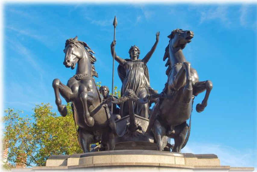
Slika 6. - Kraljica Budika

Iceni su bili pleme u istočnom dijelu Britanije (današnji Norfolk i Suffolk). Nakon invazije Britanije 43. g. Iceni su sklopili savez Rimljanima, te dobili jamstvo kako će njihova zemlja biti zaštićena i pošteđena od uništenja. U narednim godinama i raspoređivanjima po Britaniji, u Colchesteru je ostao izrazito mali garizon vojnika, te je radi straha uslijedilo razoružavanje Ikena. Ovo je posebice zasmetalo keltskim ratnicima, a nakon puča, na vlast dolazi kralj Prasutag. On obnavlja svoj savez s Rimljanima, ali je vodio politiku koja nije bila pro-rimska kao politika svoga prethodnika što je dodatno smetalo Rimljanima. Nakon njegove smrti, Svetonije se pribojavao kako bi Iceni mogli stvarati dodatne probleme, pa je tako odlučio nasilno aneksirati njihove krajeve i uspostaviti svoje administratore kako bi održavali rimski zakon. Ovo je razjarilo Icene, te nakon javnog bičevanja kraljice Budike, koja je jednom prilikom javno kritizirala Rimljane, dolazi do prave pobune. Budika ubrzo postaje simbol otpora, a povjesničar Dion Kasije je kasnije opisuje kao „visoku, strašnu i podarenu snažnim glasom. Njena crvena kosa protezala se do koljena, te je nosila kitnjast zlatni torkves, višebojnu haljinu i raskošan plašt učvršćen brošem. Nosila je dugačko koplje, te izazivala strah u svakome tko ju je pogledao.“ 79