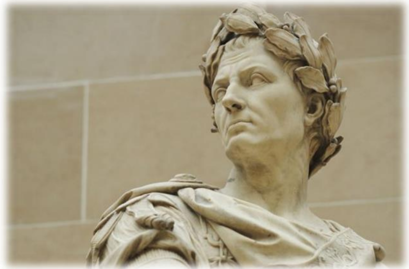
Slika 2 - Gaj Julije Cezar

Gaj Julije Cezar, rodom iz patricijske obitelji Julijevaca za koje legenda kaže da potječu od samoga Eneje, trojanskog junaka, rodio se 13. srpnja 101. g. pr. Kr. Malo je toga poznato o njegovom djetinjstvu. Otac istoga imena umire dok je Cezar bio mlad, pa odgoj preuzima njegova majka Aurelija. Kao nećak slavnog