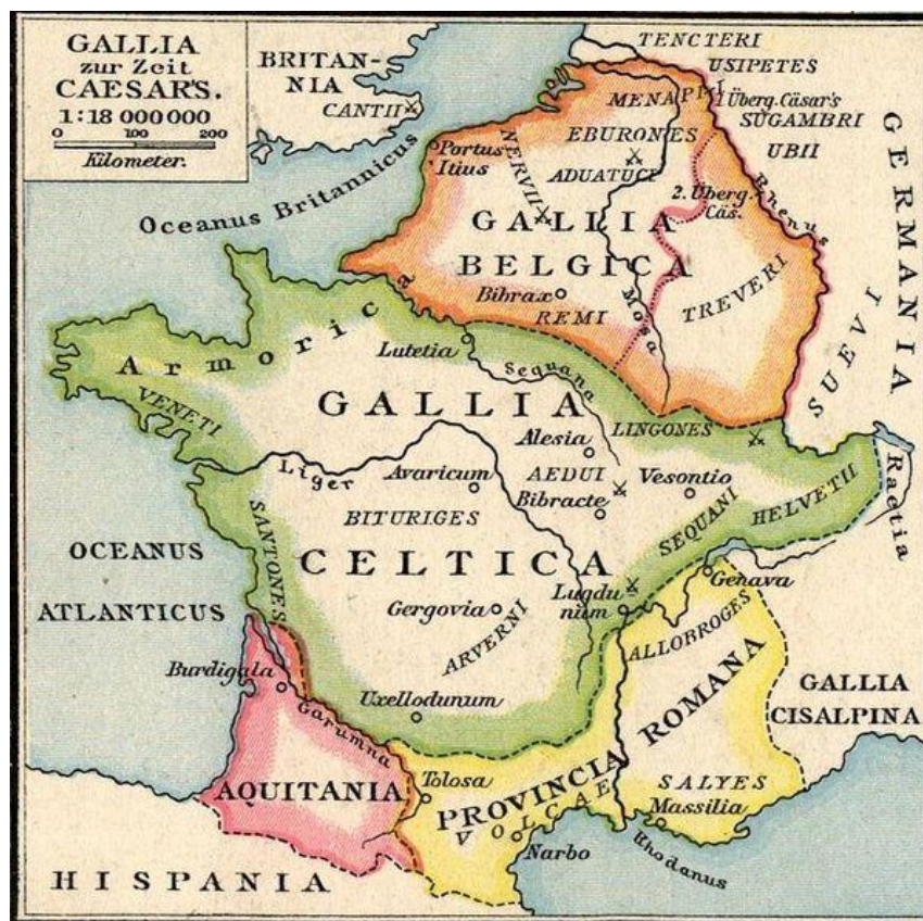
Slika 3 - Galija u vrijeme Cezara

Rimljani su došli do porječja rijeke Rhône u kasnom drugom stoljeću pr. Kr. Ono što su ubrzo shvatili jest da je područje sjeverno od njih naseljeno od strane Kelta. 58 Imajući na umu da su Rimljani vodili ekspanzionističku politiku bilo je teško za očekivati da se prije ili kasnije neće okrenuti prema Galiji. Nemilosrdan i oportunistički nastrojen Cezar trebao je bogatstvo i vojnu slavu kako bi se uspio držati bok uz bok s trijumvirima Pompejem i Krasom. Nije imao Pompejeve vojne uspjehe niti Krasovo bogatstvo, a upravljao je Ilirikom, Cisalpinskom i Transalpijskom Galijom. Zadaća mu je bila brinuti se za sigurnost ovih provincija, odnosno brinuti se za saveze i granice, a odobrenje za invaziju na Galiju od Senata nije imao. 59