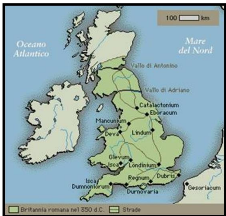
Slika 7. – Provincija Britanija

Ova pobuna je Rimu poslužila kao upozorenje, te je u provinciju premješten dio vojske iz Germanije. Dok su se legionari osvećivali lokalnim plemenima, poduzimali su se koraci kako do ovakvih pobuna više nikada ne bi došlo, a Svetonije je pozvan natrag u Rim. Narednih godina, situacija se smirila zbog vođenja blaže politike od strane Rimljana, a južna Britanija je postala većinom mirna provincija gdje su protekli sukobi između plemena zamijenjeni s trgovinom. 80