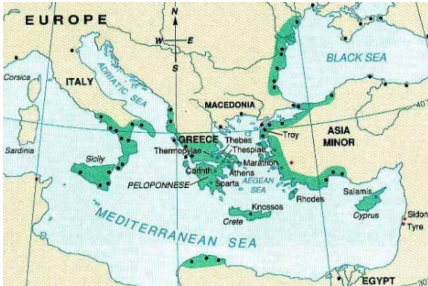
Slika 1 – karta stare Grčke

Kada govorimo o staroj Grčkoj, o onoj Grčkoj koja je sudjelovala u grčko-perzijskim ratovima, ne možemo misliti samo na područje grčke države koju mi poznajemo danas. Stoga u staru Grčku ubrajamo sva područja koja su bila naseljena Grcima, ali i stanovnicima koji su pričali grčkim jezikom u doba antike.