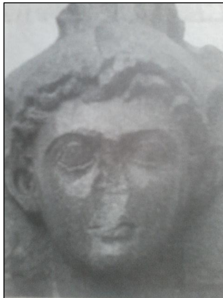
Prilog 4. Navodni prikaz Cezariona, nalaz iz istočne Aleksandrije. Prikaz se sastoji od grčke glave a sumnja se da je izvorno bio u paru s prikazom Kleopatre. (Stacy Schiff, Kleopatra: Život)