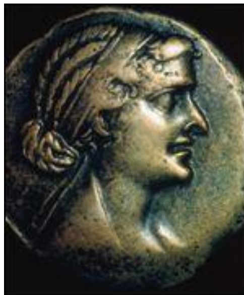
Prilog 2. Novac iskovan u Aleksandriji prizazuje Kleopatru s kukastim nosom i isturenom bradom. Na novcu su se nos i oči često naglašavali kao pokazitelji snage volje i autoriteta vladara tj vladarice. ( http://www.fanpop.com/clubs/ancient-egypt/images/37472819/title/cleopatra-coin-photo )