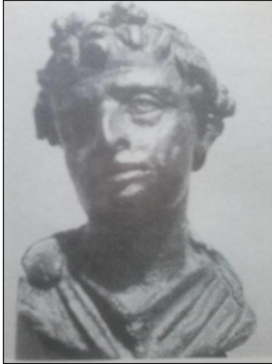
Prilog 3. Kleopatrin otac Ptolemej Aulet prikazan kao Dioniz. (Stacy Schiff, Kleopatra: Život)